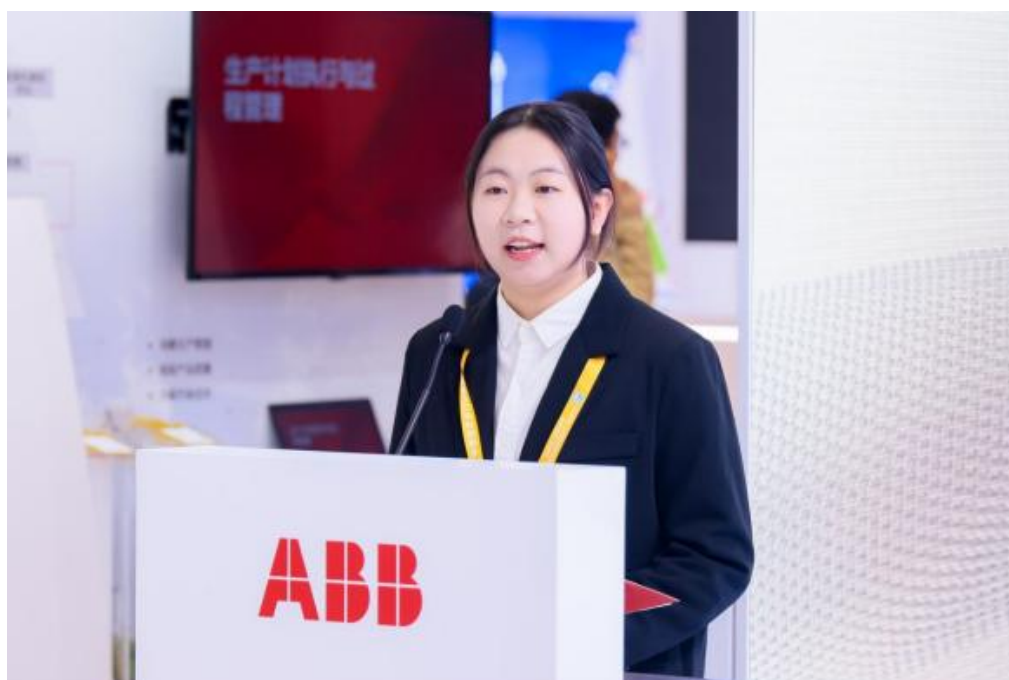
图 2 学生代表分享