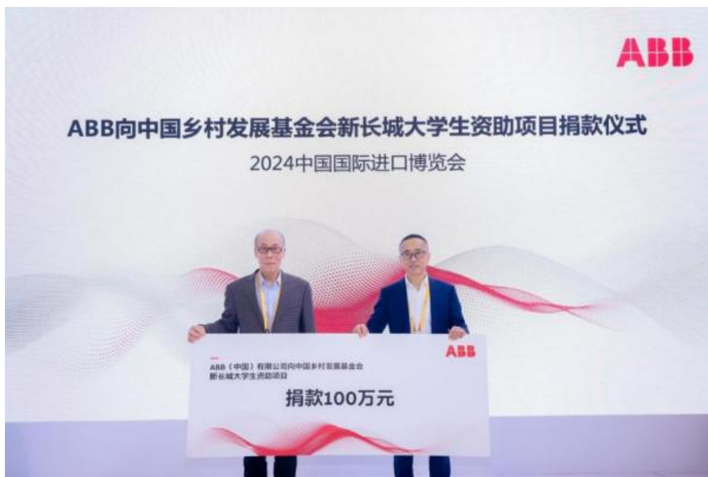
图 1 捐赠仪式