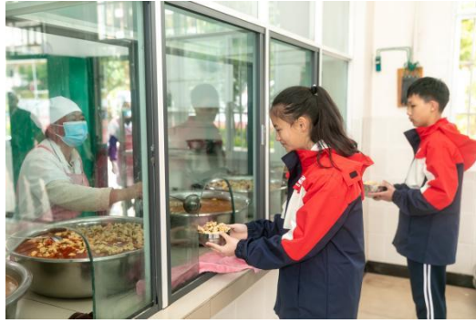
捐一元爱心厨房受益学校厨工为学生打饭；