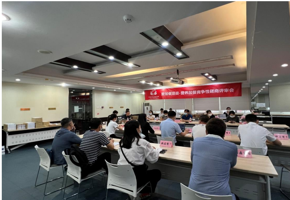
图：中国乡村发展基金会召开爱加餐项目-营养加餐竞争性磋商会。