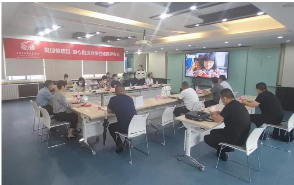
图：中国乡村发展基金会召开爱加餐项目-爱心厨房竞争性磋商会。