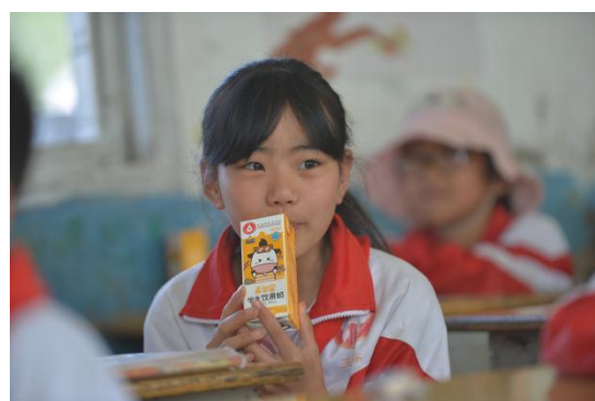
捐一元项目受益学生在课间补充蛋奶营养；