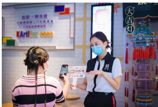
2022 年捐一元活动线下肯德基餐厅劝捐现场；

等网上订餐平台以及字节跳动公益、腾讯公益等线上公开募捐平台同步开展。活动持续拓宽筹款渠道、联动平台资源参与筹款，包括肯德基中国 35 周年 DIMOO 联名款上校爱心义卖、肯德基餐厅自助点餐机开屏筹款、抖音短视频筹款、达人直播筹款等方式，同时，活动通过邀请明星、达人、广告投放、平台资源置换等方式，深入打造项目品牌影响力。2022 年捐一元活动累计募集善款超过 1200 万元，超过 375 万人次参与捐赠。