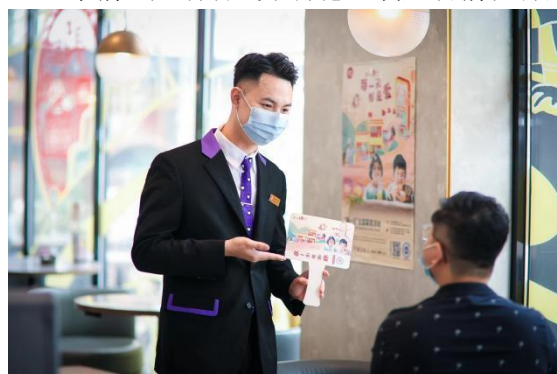
2022 年捐一元活动线下必胜客餐厅劝捐现场；