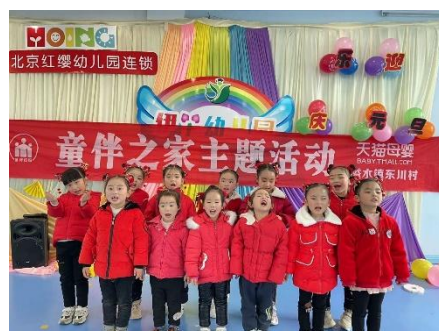
左图：湖北竹山县东川村童伴之家举办“庆元旦文艺汇演”主题活动

第一季度，项目区开童伴之家共开放 2.71 万次，组织活动 2.18 万次，有 18.98 万人次的儿童，2.96 万人次的家长参加童伴之家的日常活动和“庆元旦”、“美丽地球”、“集体生日会”等主题活动。孩子们在活动中学习传统文化知识，培养孩子们对传统文化的兴趣。