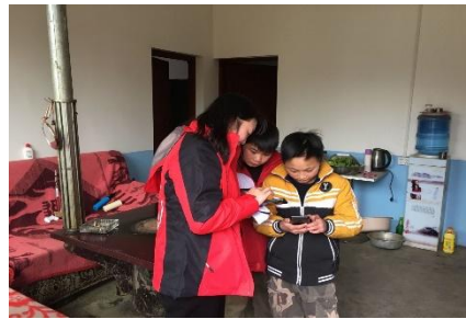
右图：贵州绥阳县太平村童伴妈妈入户走访，为儿童建立档案