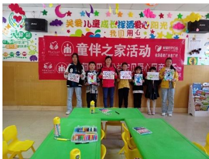
左图：安徽金寨县张冲村童伴之家开展“集体生日会”主题活动