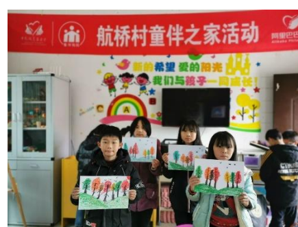
右图：江西乐安县航桥村童伴之家举办“美丽地球”主题活动