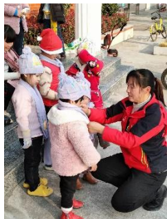
左图：湖北崇阳县白霓村童伴妈妈入户走访，了解孩子生活情况