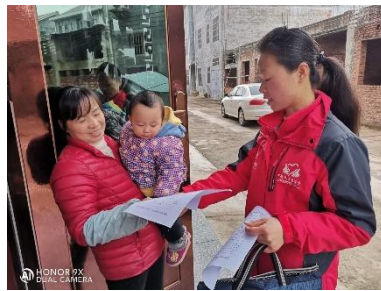
左图：江西万安县村背村童伴妈妈入户走访，宣传防疫知识

请农村合作医疗、协助办理低保、协助辍学儿童返校、协助户籍登记等 2.97 万余例，提供其他服务包括资源链接、辅导儿童作业等 1.96 万余例。