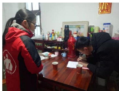
右图：安徽望江县佩山村童伴妈妈入户走访，为孩子辅导功课