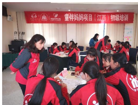
童伴妈妈项目江西第三批初级培训在婺源举行