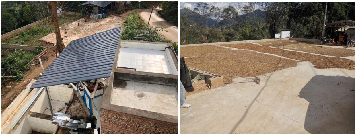
漫海村蓄水池，脱皮脱胶机等咖啡初加工水利设施设备、污水处理池、彩钢棚等加工厂基础设施建设

水池，晾晒架 840 m 2 ；信岗村仓库及透明晒场 300 m 2 及 2 台烘干机建设；勐白村烘干机初加工设备，生物燃料机，地坪称建设工作，完成污水处理设备安装。初加工厂覆盖面积 10122 亩，直接受益咖农 1038 户，3114 人；通过提升项目村咖啡初加工设施、设备，改善咖啡种植、加工环境，缓解项目村因咖啡加工造成的环境污染；通过咖农鲜果统一加工有利于咖啡品质提升及稳定。