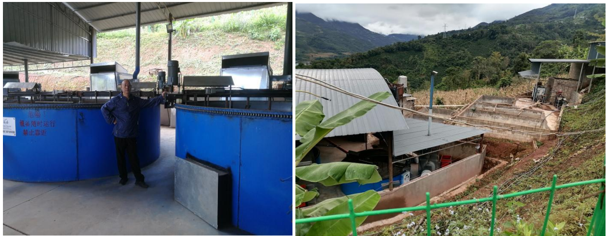
漫芽村蓄水池，脱皮脱胶机等咖啡初加工水利设施设备、污水处理池、彩钢棚等加工厂基础设施建设