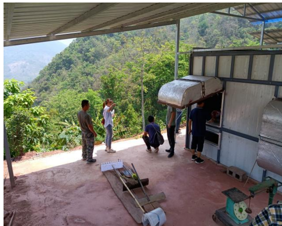
普胜村蓄水池，脱皮脱胶机等咖啡初加工水利设施设备、污水处理池、彩钢棚等加工厂基础设施建设