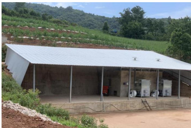
信岗村仓库及透明晒场 300 m 2 及 2 台烘干机建设