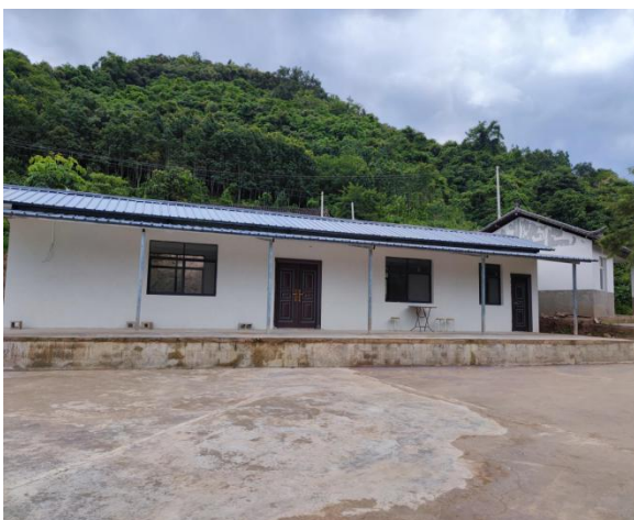
秀柏村蓄水池，脱皮脱胶机等咖啡初加工水利设施设备、污水处理池、彩钢棚等加工厂基础设施建设