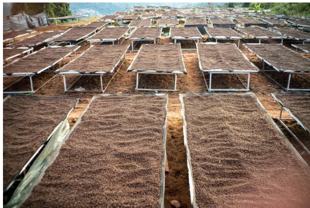
完成孟连县芒冒村晒场 1800 平，咖啡生产用水蓄水池，晾晒架 840 m 2