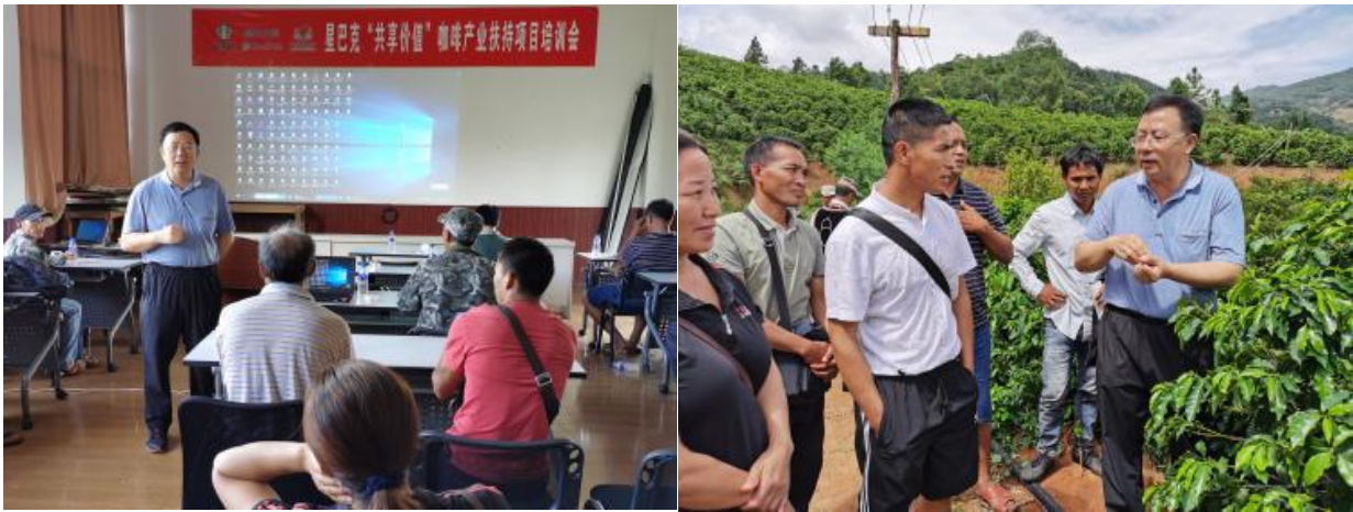
小粒咖啡技术培训