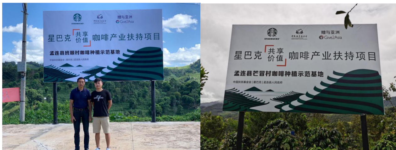
小粒咖啡示范基地建设基地牌