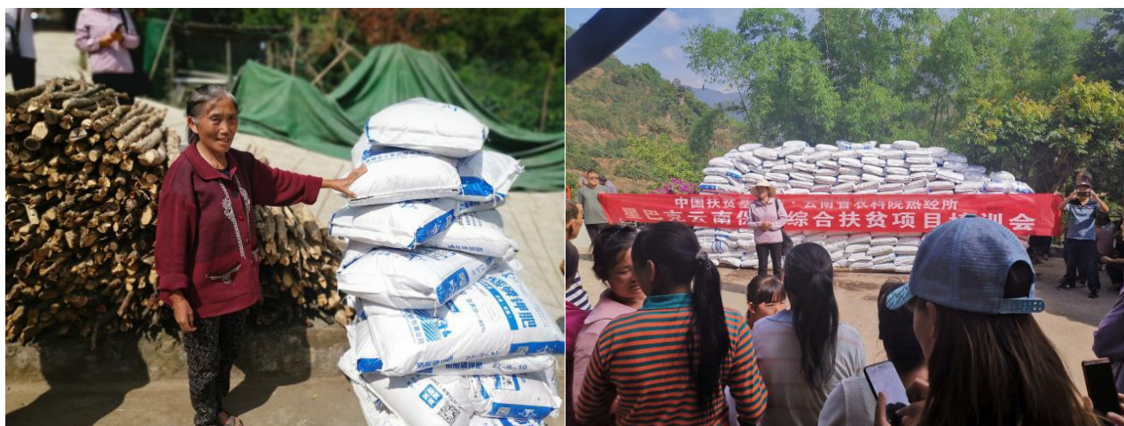
赧亢村肥料培训及发放