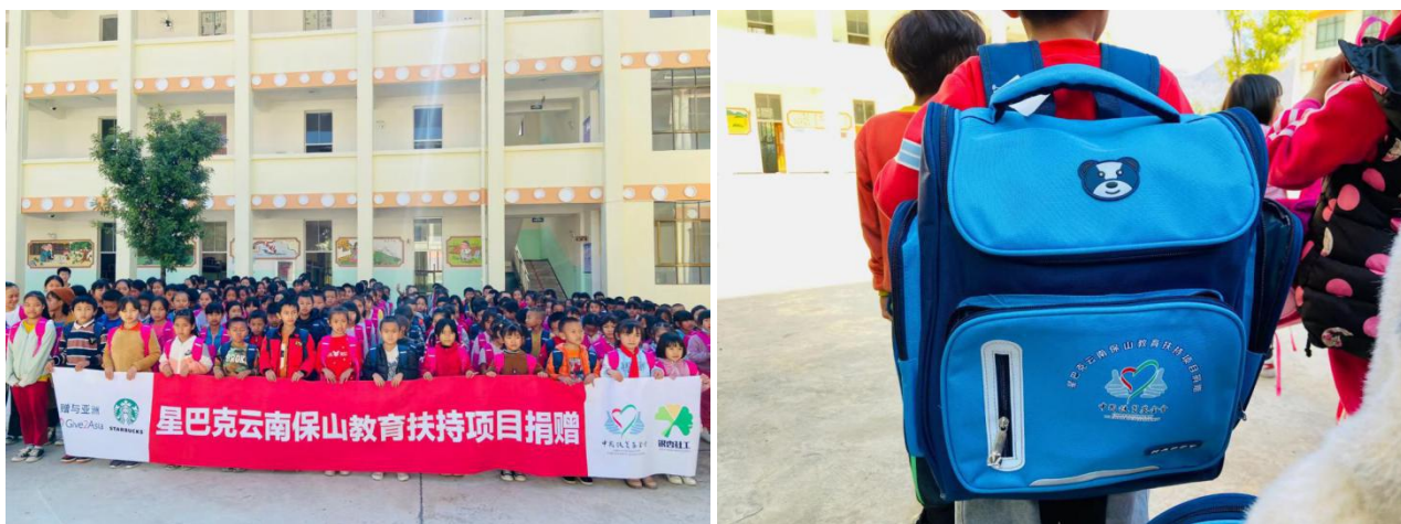
爱心包裹捐赠及发放