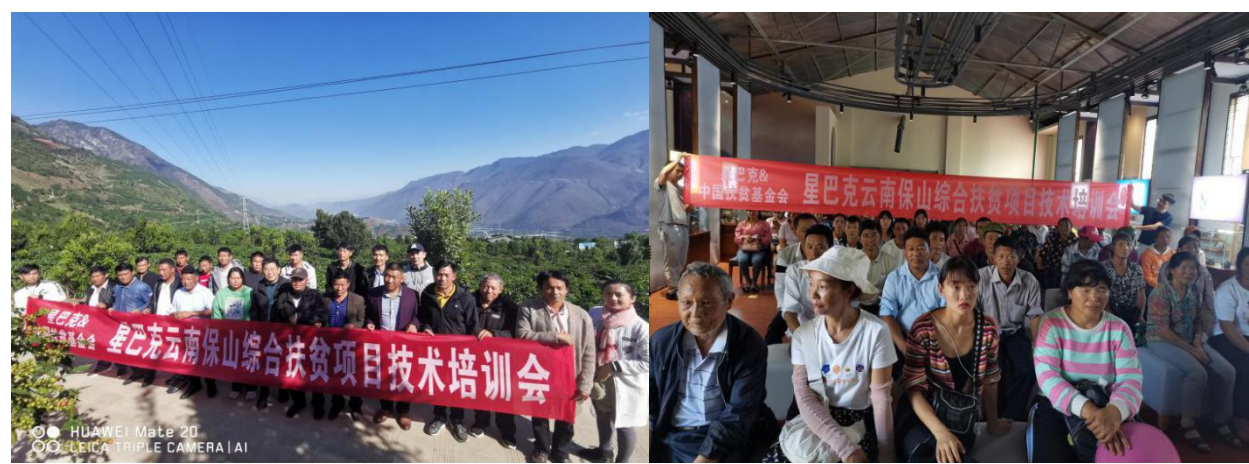
小粒咖啡技术培训