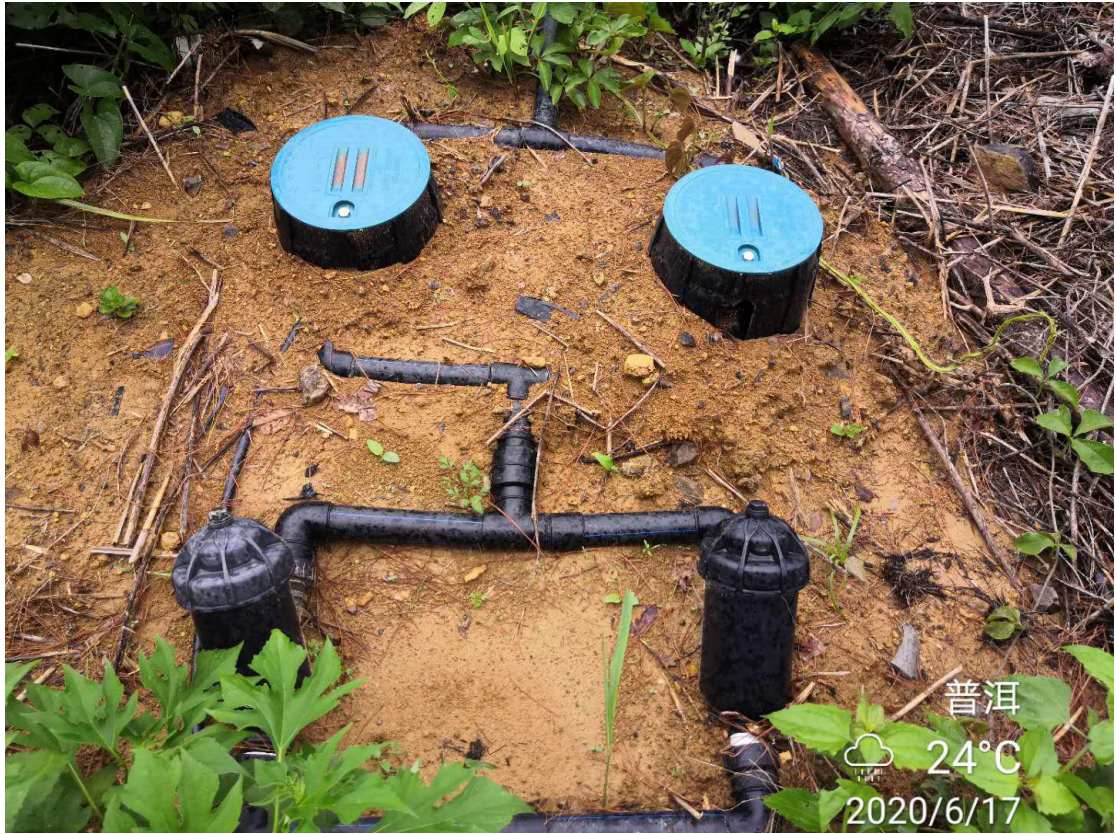
智慧农业系统硬件设施设备