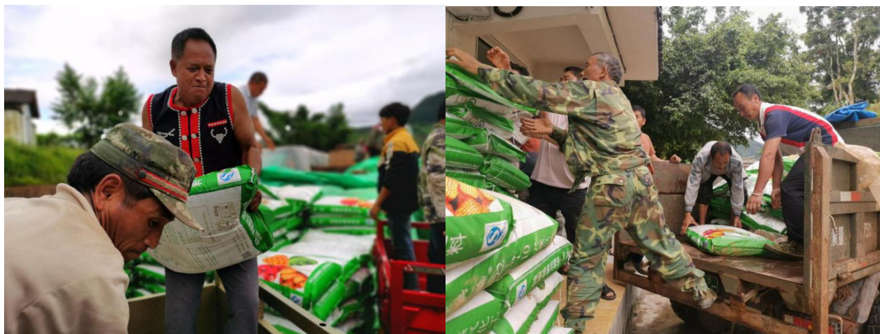
小粒咖啡示范基地建设肥料补贴发放