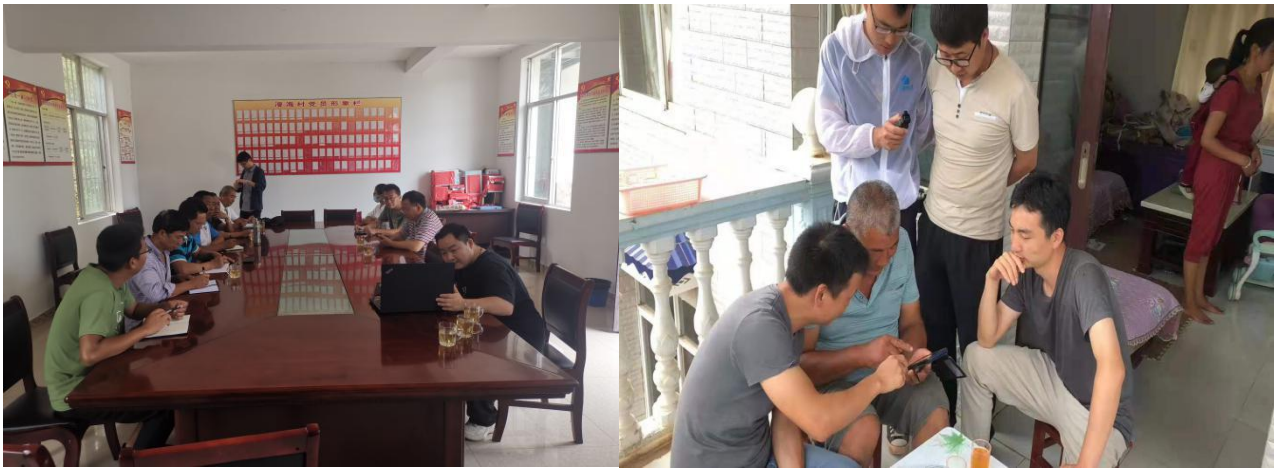
系统使用操作培训