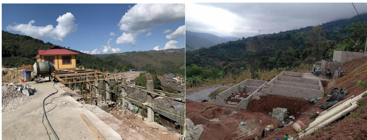
小粒咖啡初加工厂建设现场