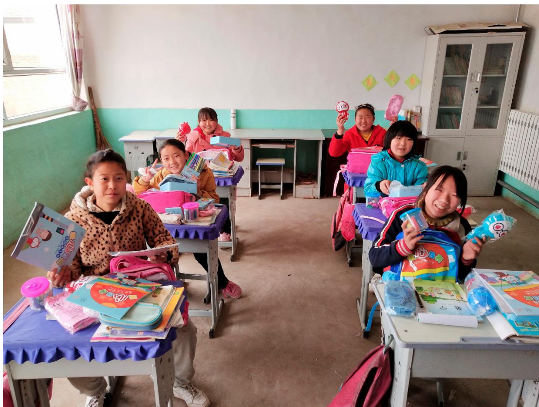
山西省灵丘县东武庄小学学生收到爱心包裹好开心呀