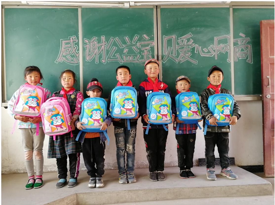
甘肃省秦安县千户镇徐王教学点学生收到包裹