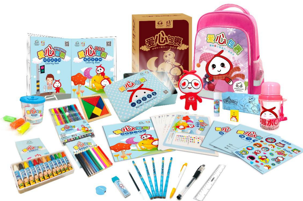
图为学生型美术包，因厂家和生产批次不同，包裹颜色略有不同