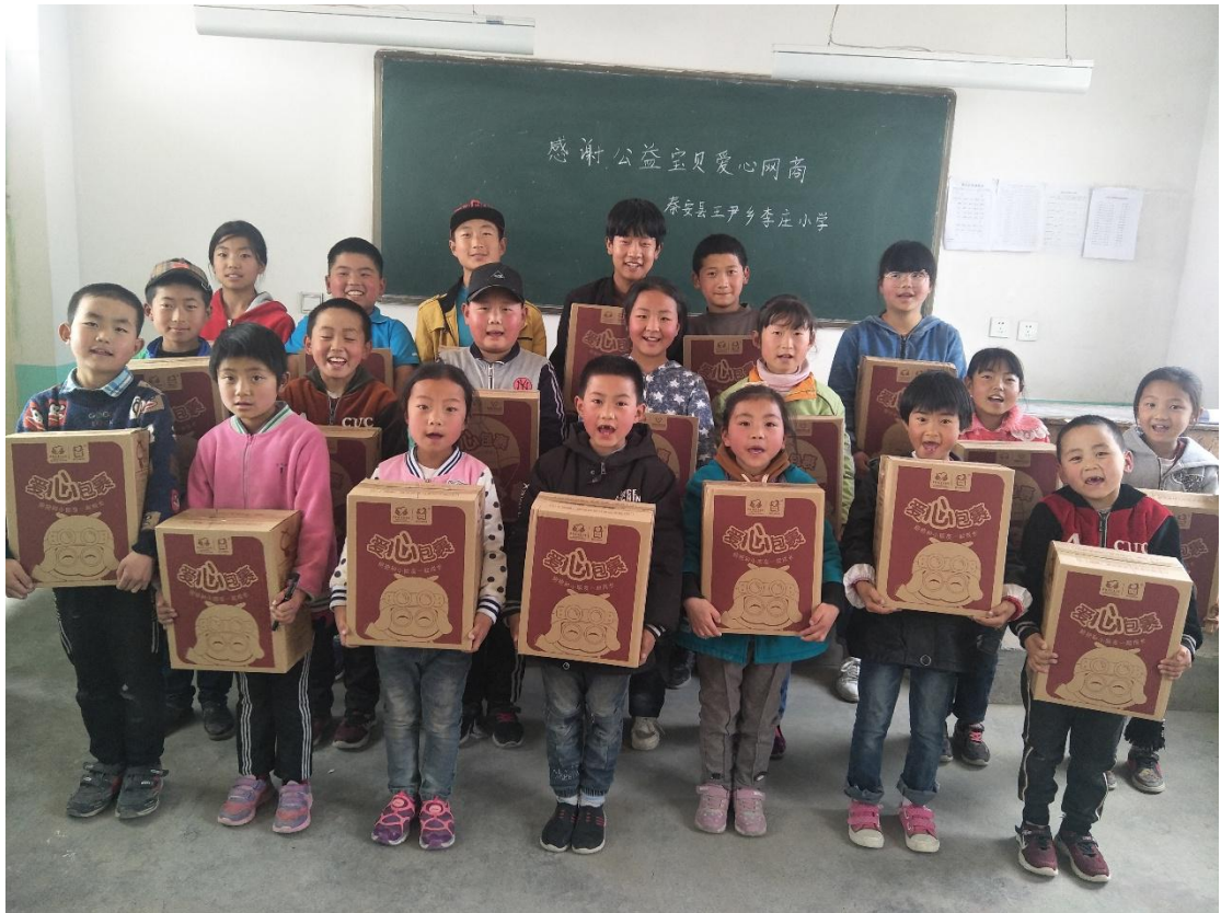
安徽省萧县李庄小学学生收到爱心包裹