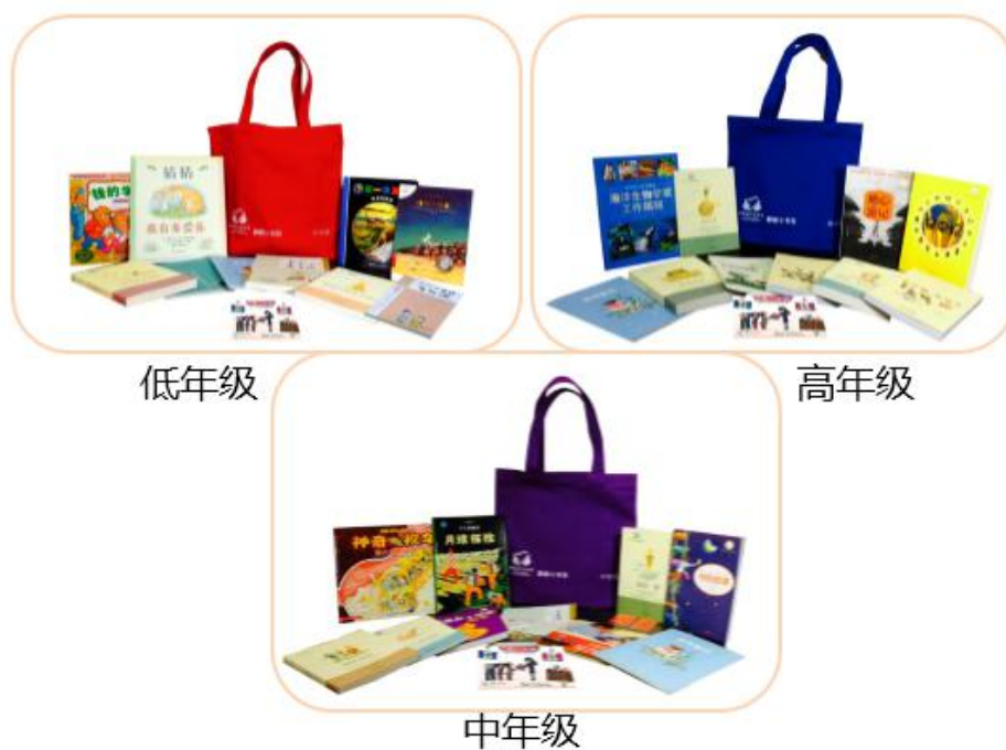
图为图书包裹，因生产批次不同，包裹产品细节略有不同