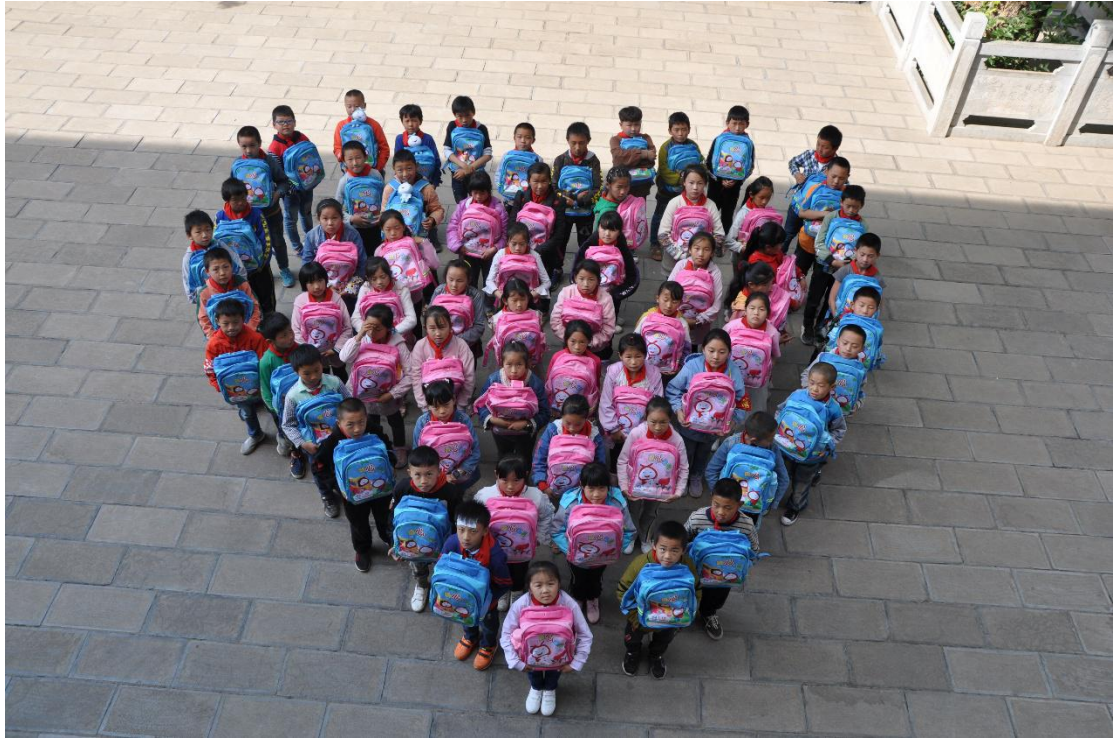
云南会泽县迤车镇索桥小学收到爱心包裹