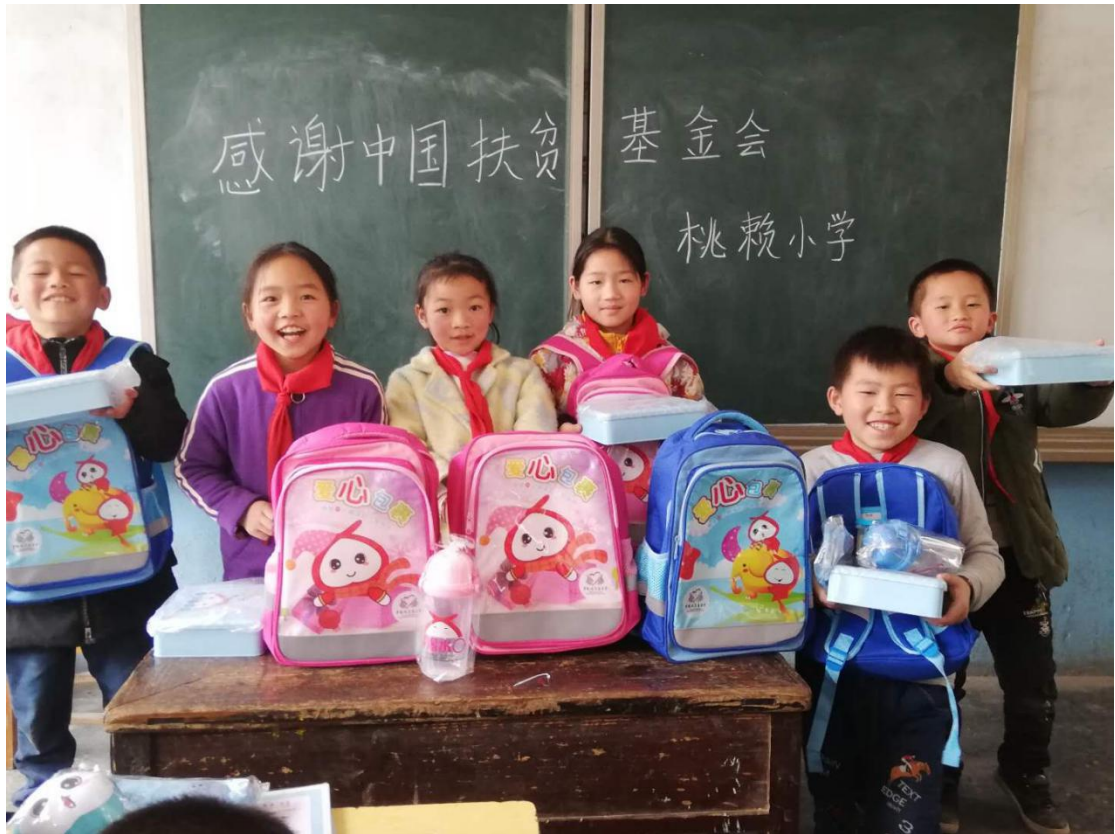
公众-贵州省台江县桃赖小学学生收到爱心包裹