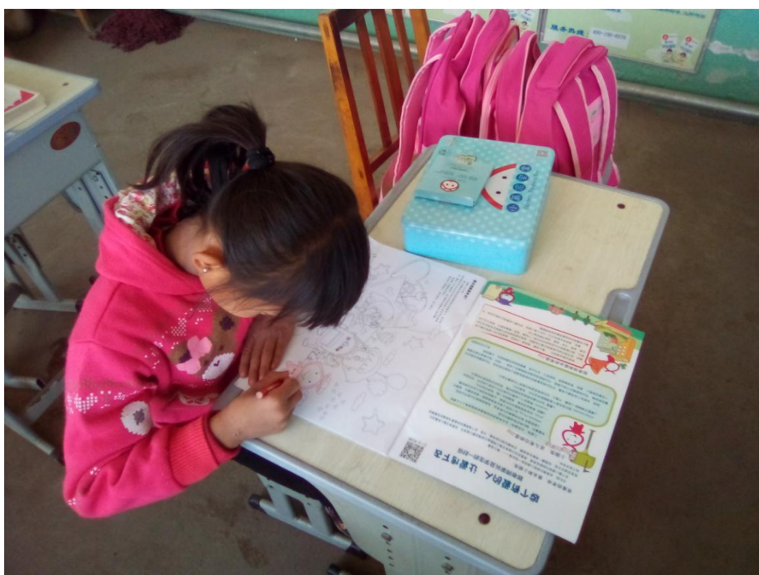
抱抱太可爱了先给它涂上颜色