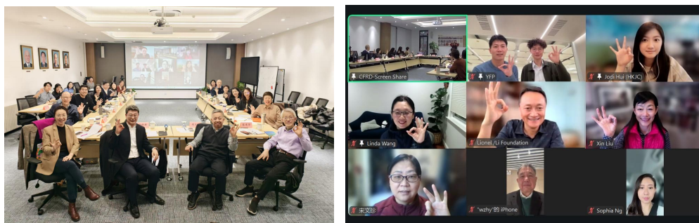
2 月 4 日，中国儿童早期发展共建项目第五次决策人会议以线上+线下方式开展

2 月举行了第五次决策人会议，明确了各板块年度核心工作目标，为全年工作奠定了基础。