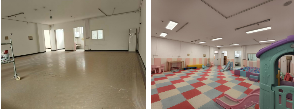
北京市平谷区、江西省石城县完成中心建设，60 站点完成物资配送，图为平谷中心建设前后对比