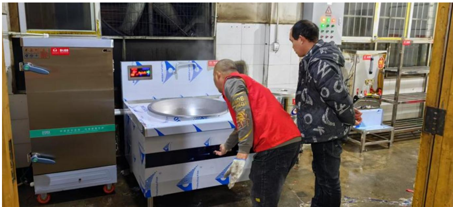
项目实施后，云南省威信县罗布镇顺河小学安装设备