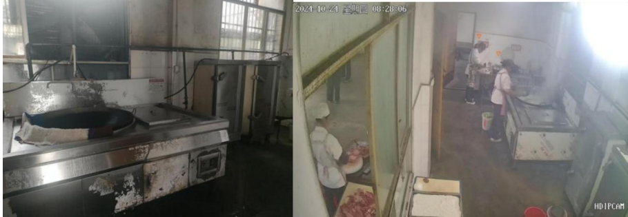
项目实施前，云南省威信县罗布镇顺河小学的生物燃料锅灶