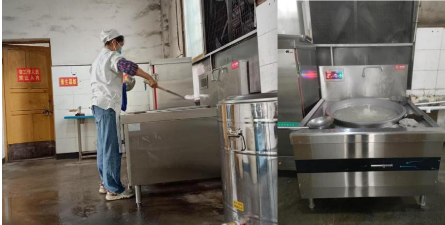
项目实施后，云南省威信县罗布镇顺河小学厨工使用设备