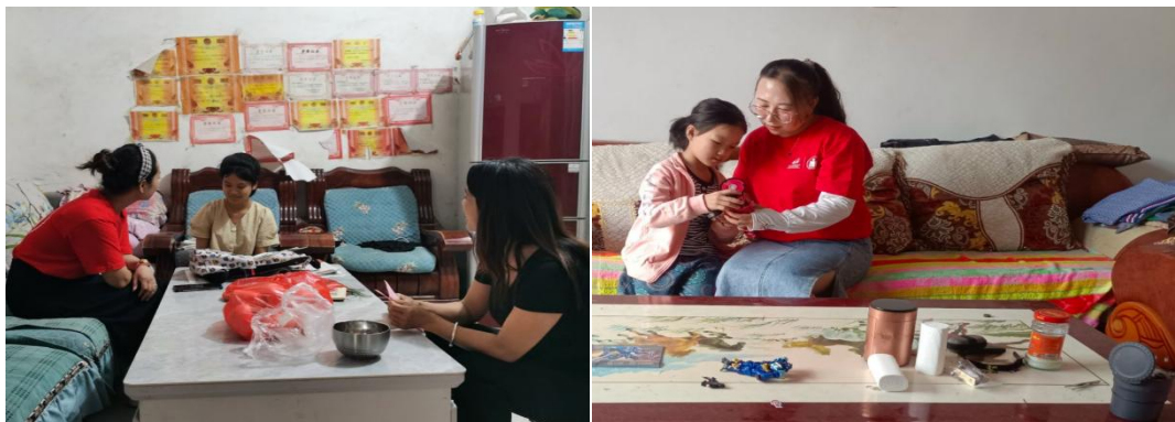
左图：河南汝阳县童伴妈妈进行走访，跟进假期儿童的学习情况