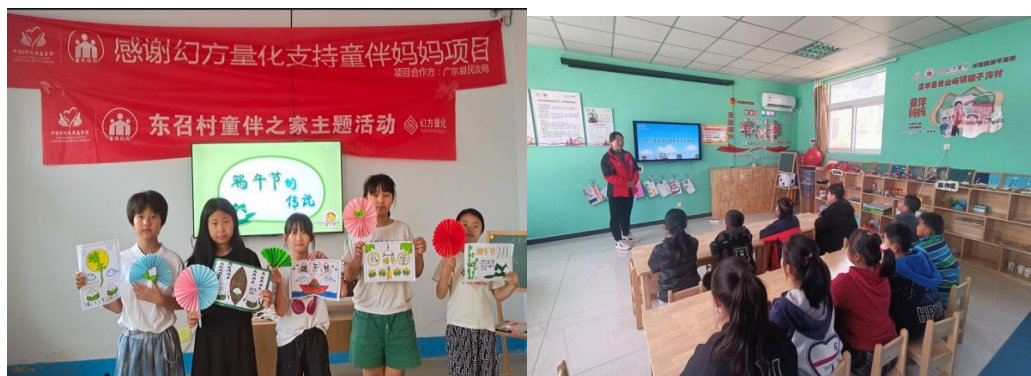
左图：陕西长武县童伴之家开展“欢度国庆”主题活动

2024 年，项目区童伴之家共组织活动 10.66 万余次，有 108.54 万余人次的儿童，16.24 万余人次的家长参加童伴之家的日常活动和 “预防校园欺凌”、“童心共筑忠魂梦 爱国情怀代代传” 等主题活动。活动不仅丰富了孩子们的日常生活，搭建起亲子沟通的桥梁，提高了孩子们的安全意识，同时也促进了孩子的身心健康发展。