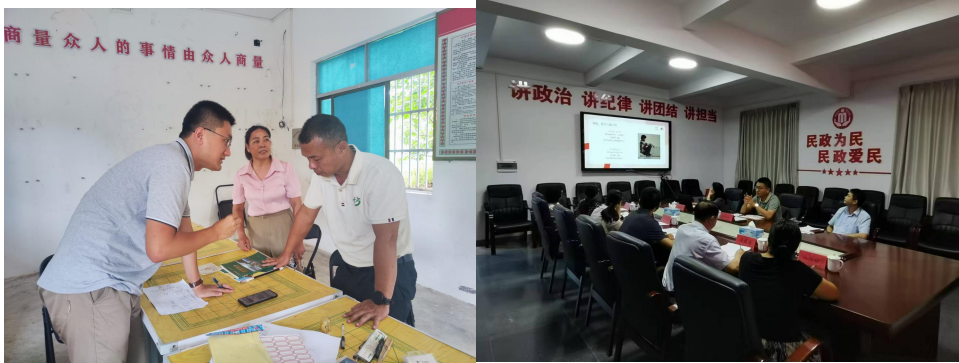
开展新增项目区实地调研

点关注地区的深度衔接，在贵州、江西、湖北、甘肃、陕西等地新增 310 个项目村。