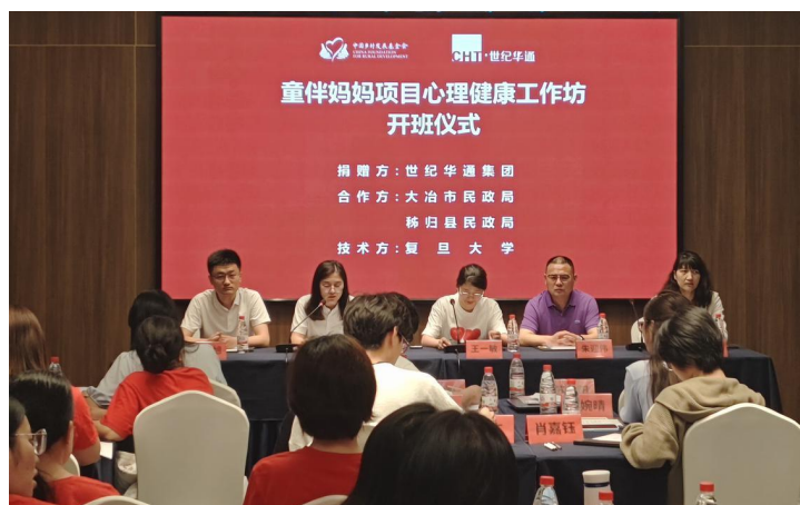
2024 年度童伴妈妈项目培训及督导工作开展