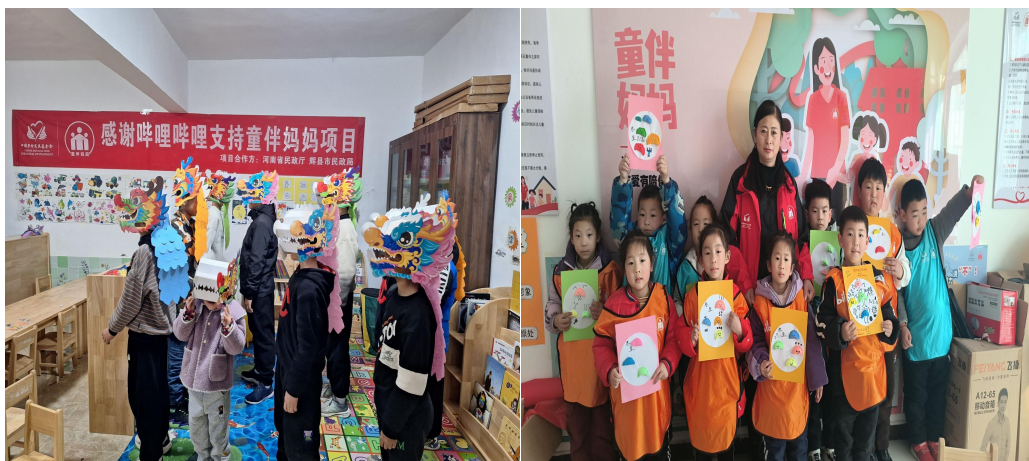
左图：辉县市童伴之家开放，孩子们一起设计自己的拼搭作品