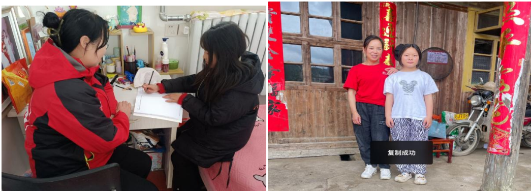
左图：河北滦平县童伴妈妈入户走访，帮助孩子辅导作业