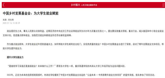
(人民日报民生周刊报道)

2024年，可持续玛上GO项目、大学生就业力实践项目、露露乐蒙青少年赋能计划等项目的启动仪式、总结会、项目十周年总结会累计在各地网络、电视、报纸媒体报道超过200次。如人民日报民生周刊、光明网、中国日报、人民政协报、北京电视台、中国环境报、中国经济新闻网等多家主流媒体深度报道。