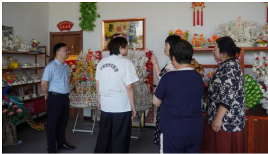
(实践团成员在采摘茶叶)

此外，云端塑梦团队没有止步于国内市场。通过参与国际交流活动，团队成功举办了 13 场面塑推广活动，携手“一带一路”研究院走进东南电梯等企业，让非遗面塑顺利“出海”，向全世界展示了中国传统文化的独特魅力。