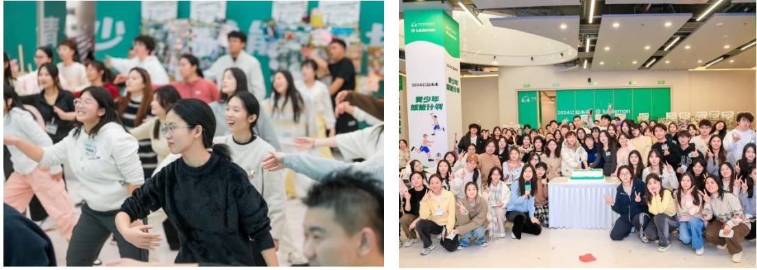
(总结会现场部分展示)