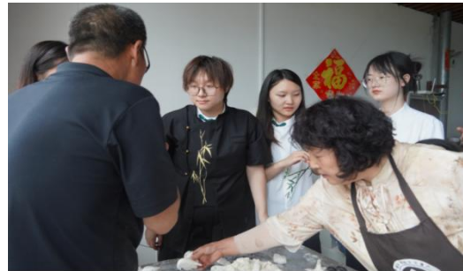
调研制茶车间，了解加工情况