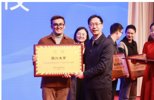
（花旗项目十周年致敬高校老师）

通过“可持续，玛上GO”项目和花旗项目十周年的契机，扩大项目传播；搭建多方交流平台，邀请过往合作机构、高校、媒体、同行公益机构共同参与。