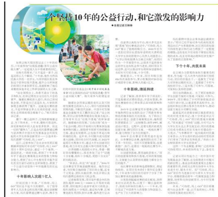
(中国环境报刊面报道)