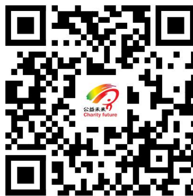
公益未来·“可持续玛上GO”项目十周年纪念册 （扫码查看文件）