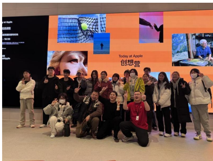
(北京场嘉宾课程合影)