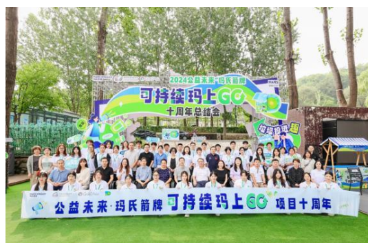
（当地政府和环保协会参与项目十周年）