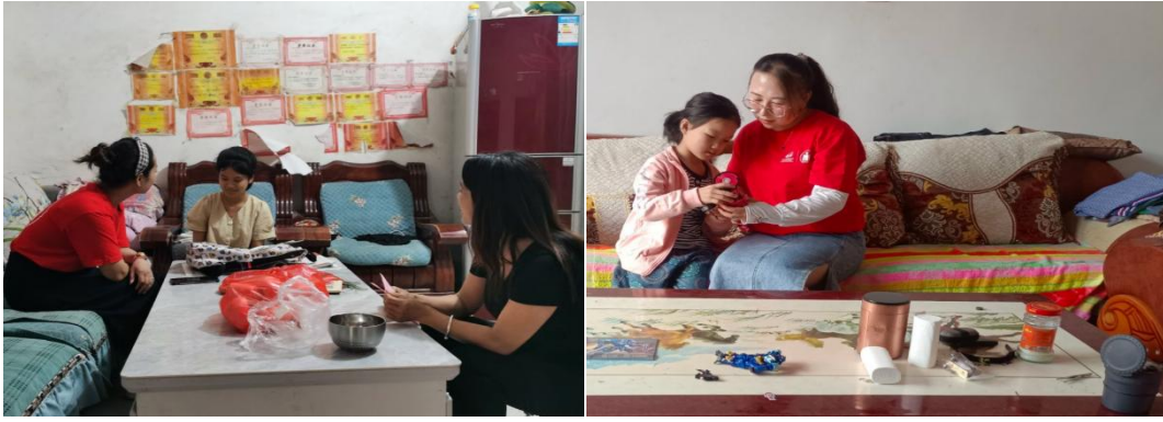
左图：河南汝阳县童伴妈妈进行走访，跟进假期儿童的学习情况