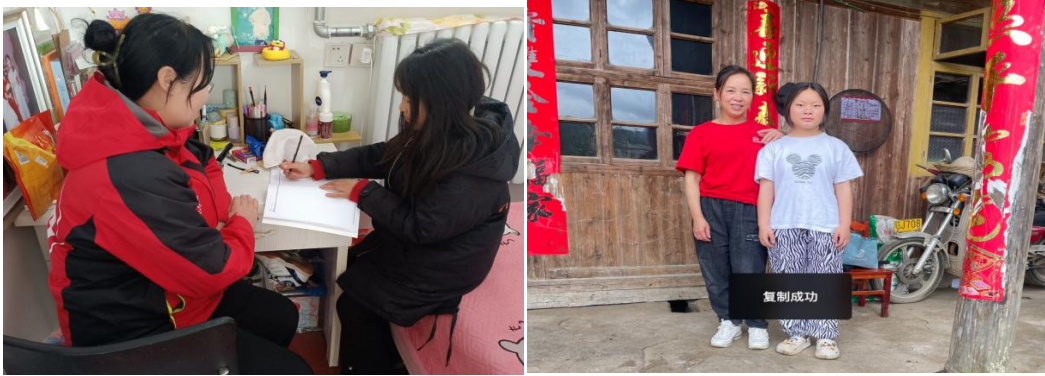
左图：河北滦平县童伴妈妈入户走访，帮助孩子辅导作业