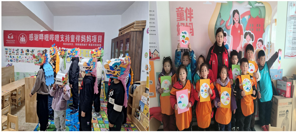
左图：辉县市童伴之家开放，孩子们一起设计自己的拼搭作品