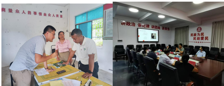
开展新增项目区实地调研

点关注地区的深度衔接，在贵州、江西、湖北、甘肃、陕西等地新增 310 个项目村。