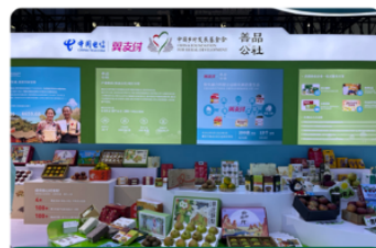
参加展销会科技生态大会等推广活动