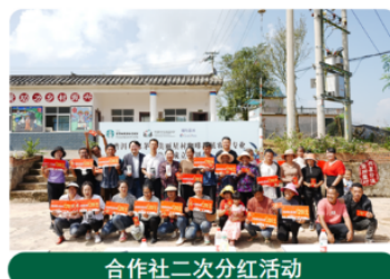
合作社二次分红活动

市场推广：以咖啡为试点产品，截至12月底累计发运普洱咖啡2000余笔订单，消费帮扶近80万元