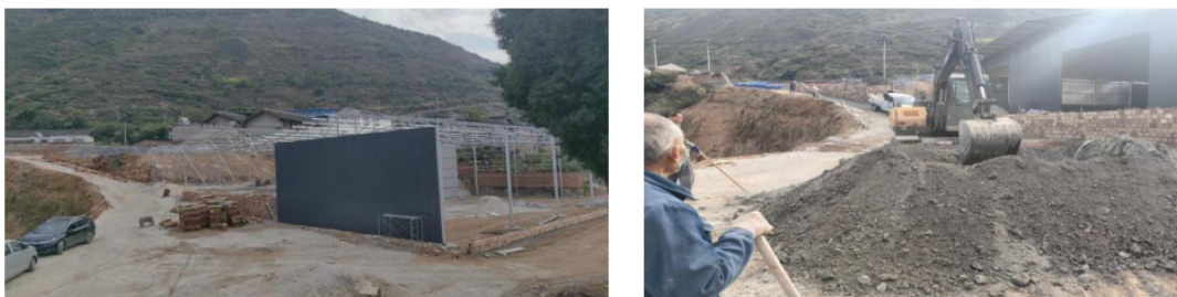
(雅安项目点县域涉农企业在项目支持下开展厂房扩建及路面硬化工作)

2024 年 10 月-12 月，富民车间项目新增 4 个项目点，其中 1 个项目点完成签约及首款拨付工作，支持雅安市汉源县马烈乡新华村股份经济合作联社入股汉源县源祖皇种植专业合作社。