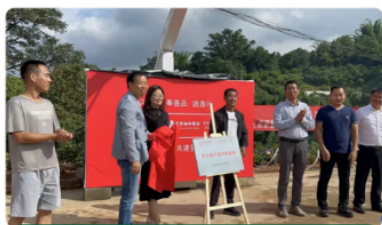
对接渠道资源战略合作签约