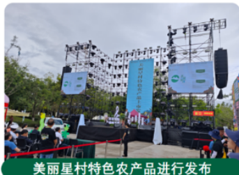
美丽星村特色农产品进行发布