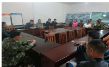
村民小组活动室前

(2) 村庄基础设施建设: 村庄绿化美化提升, 新建小组活动室、河道栈道, 村组道路改造, 公共区域游客中心、咖啡广场、内部水景观等公共区域建设。