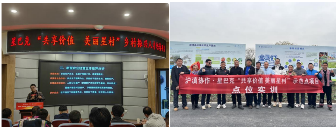
(合作社理事长带头人培训)