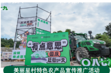
美丽星村特色农产品宣传推广活动