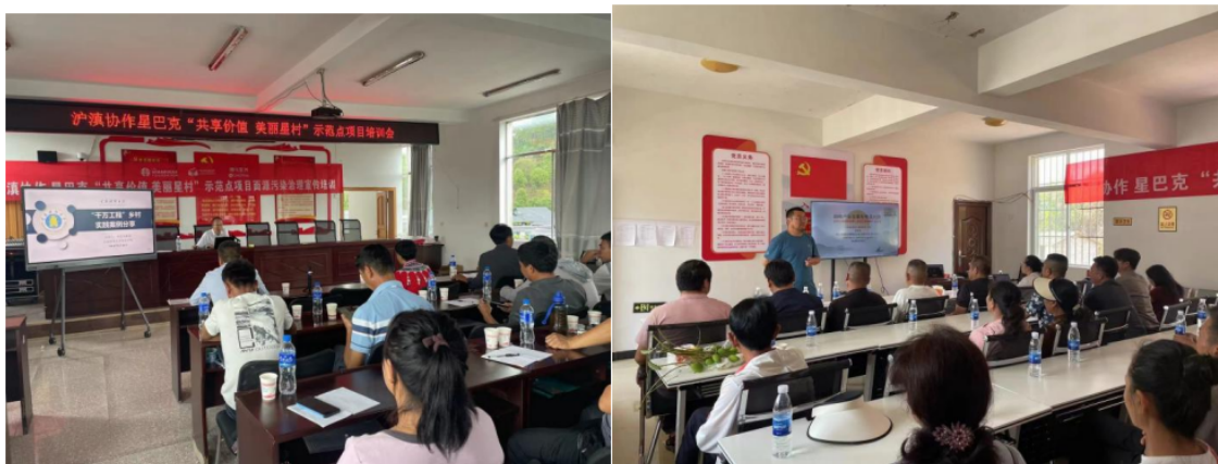
(现代农业技术应用培训、乡村振兴政策解读)

乡村职业经理人 TOT 培训依托中国乡村发展基金会、四川蒙顶山合作社发展培训学院等一个实体学院、两个常设教学点、20 个实训示范基地的资源优势，通过“合作社理事长+考察游学+实习操盘+新农人计划”等四位一体成熟培训体系，针对种植大户、合作社带头人、返乡青年和基层干部等开展乡村职业经理人培训。共计开展 13 场培训，覆盖普洱市、西双版纳、保山的 5 个州市，累计培训 508 人次。