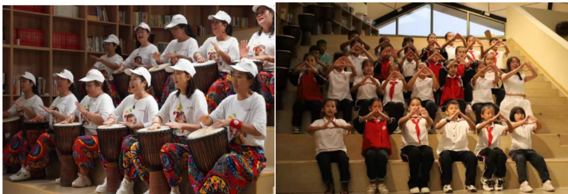
(儿童合唱团 乡村手鼓队)