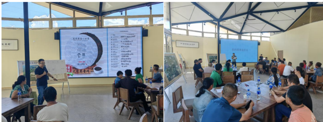
(现代农业技术应用培训+乡村振兴交流会)

农民职业技能培训依托职业技能培训学校等专业机构，针对返乡青年，妇女，产业带头人等开展民宿管家、乡村工匠技能、非遗和咖啡师技能等培训，提高村民的理论知识水平，达到实践与理论相结合并通过职业技能认定，持证上岗，促进农民就近就地就业，为乡村振兴添动力。共计开展 13 场培训，累计培训超 283 人次，实现就近就地就业 20 余人。