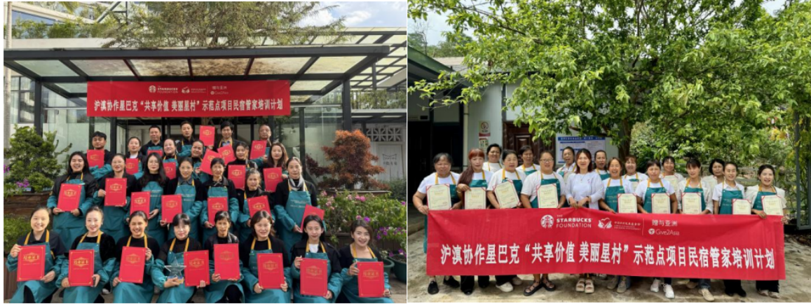
(技能培训-民宿管家培训)