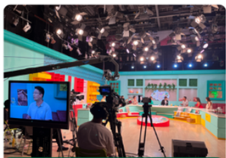
上海电视台都市频道推荐产品