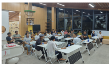
村民小组活动室后