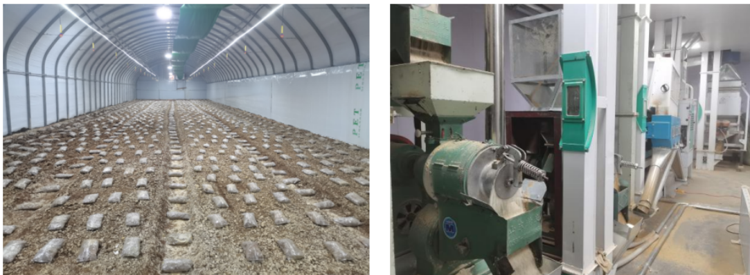
(富民车间调研小组调研相关县域农企照片)

另外 3 个项目点完成了调研、资料收集及签约工作。支持建昌县巴什罕乡土城子村股份经济合作社入股建昌县佳禾林农产品加工有限公司，支持龙井市开山屯镇爱民村经济合作社入股龙井市锋山食品有限公司，支持龙井市开山屯镇光昭村经济合作社入股龙井市御谷田粮油农民专业合作社。