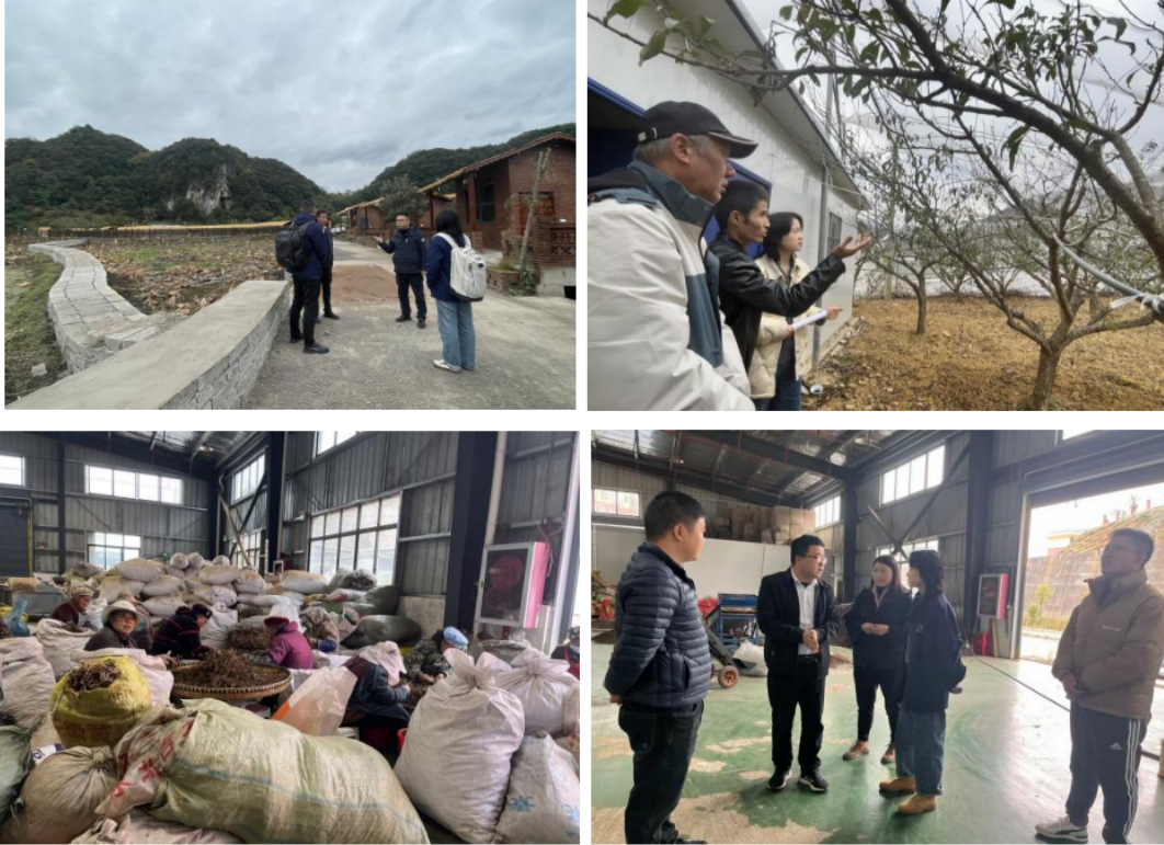
(项目回访督导照片)