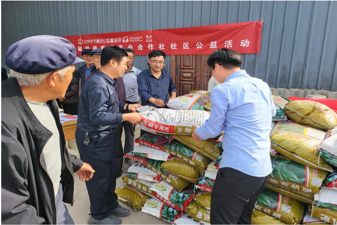
积石山县灾后产业恢复与发展项目花椒专用肥发放