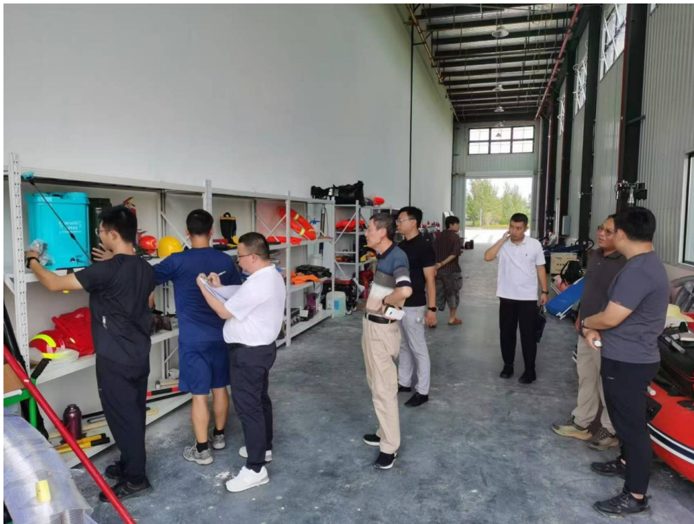
应急小站项目样品验收现场

7月-9月，积石山地震救援一应急小站项目完成甘肃省积石山县、永靖县，青海省民和县57个项目受益村应急物资确认，并开展样品验收和供应商走访工作。