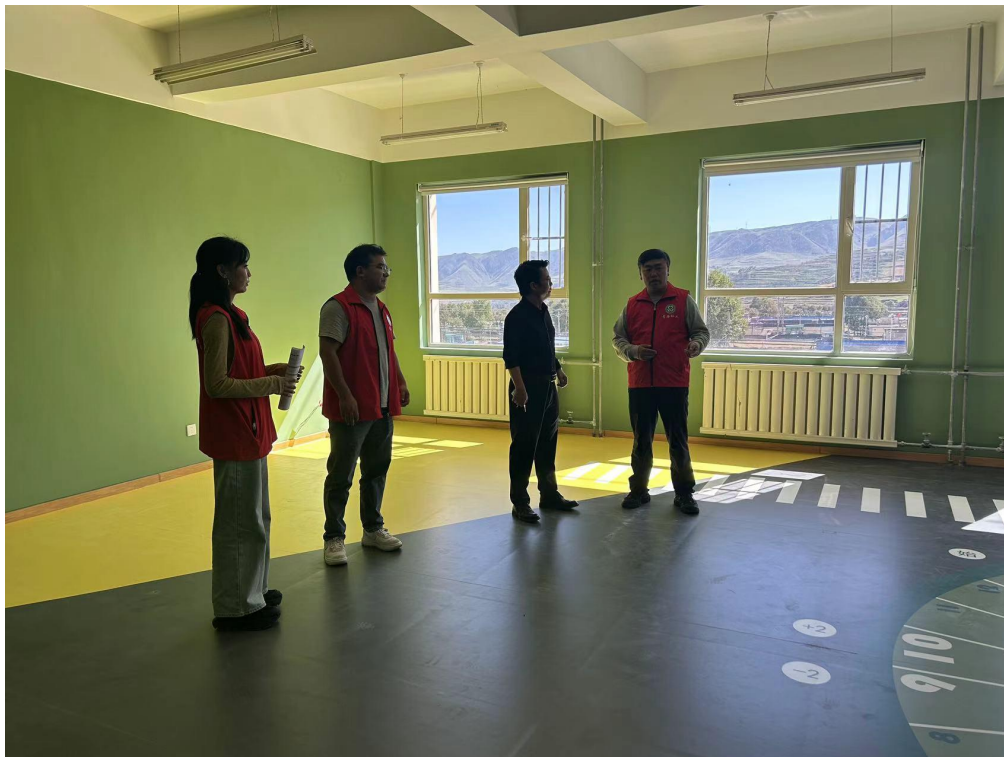
课程及教师能力建设执行机构入校调研照片