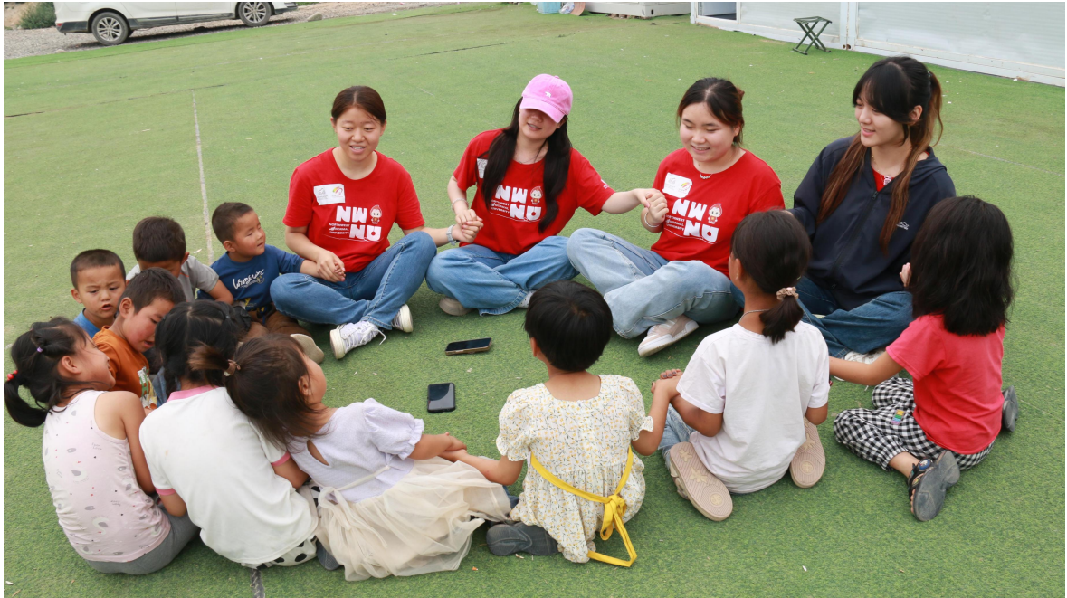
西北师范大学志愿服务团队开展活动