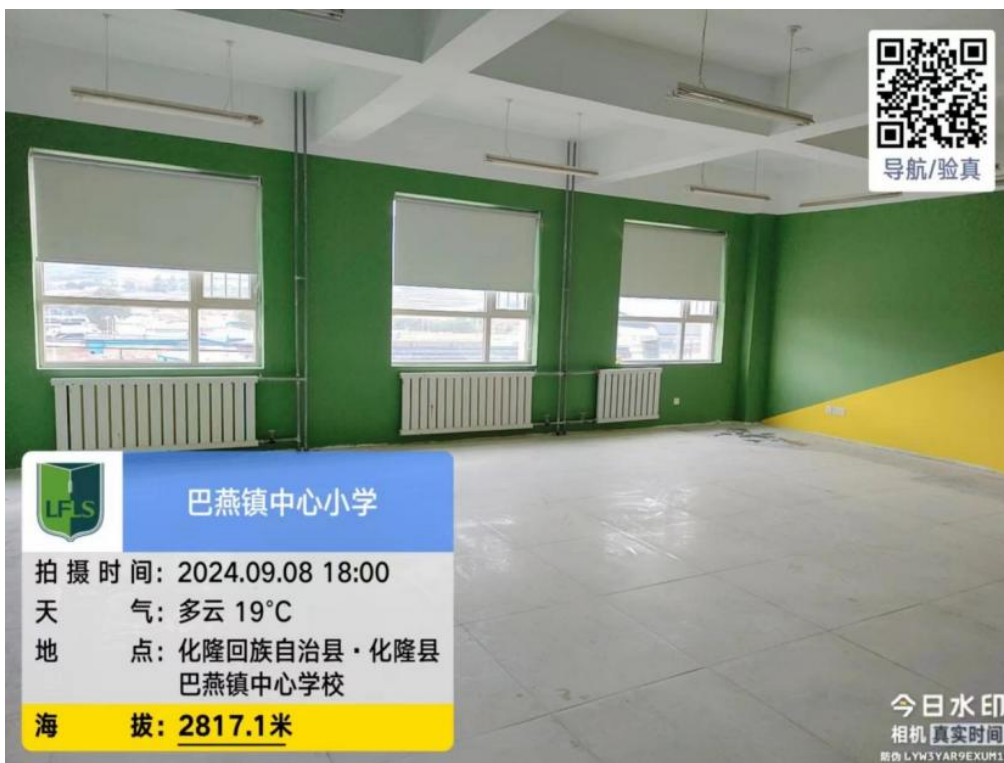
教室建设现场照片