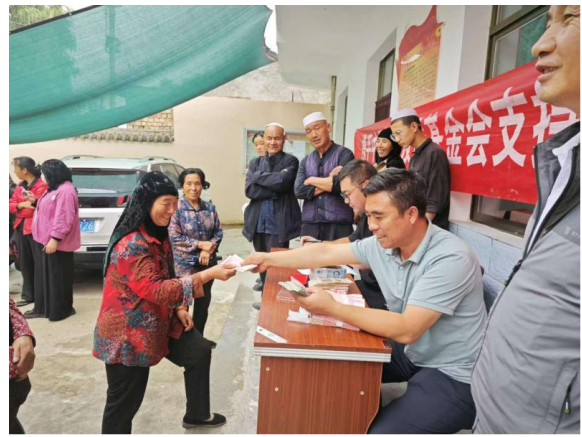
以工代赈项目村开展灾后重建工作照片、补贴发放现场照片