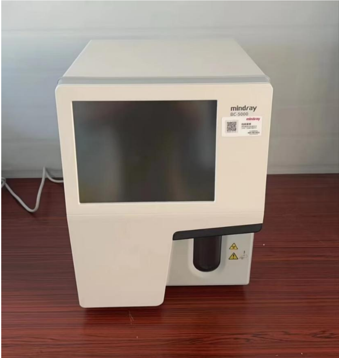
积石山地震救援 - 乡村健康卫生项目援助民和县医疗设备照片

7月-9月，积石山地震救援—乡村健康卫生项目完成民和县医疗设备的采购与发放，推进积石山县女性大病救助受益人名单确认、协议签署等。