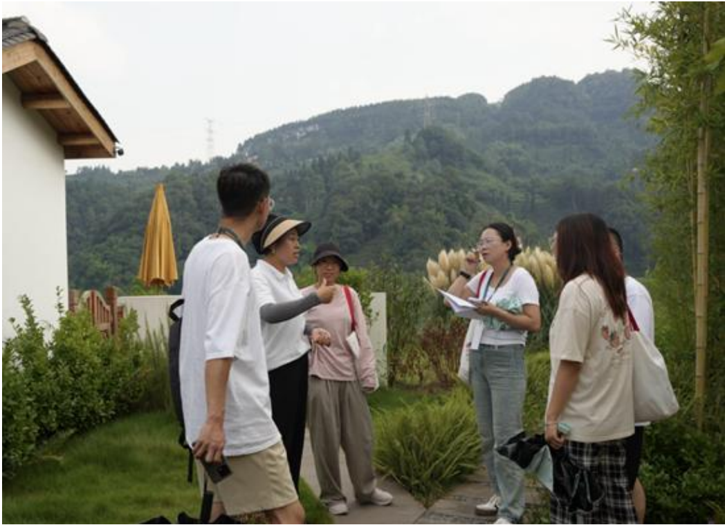
参会学生开展田野调查