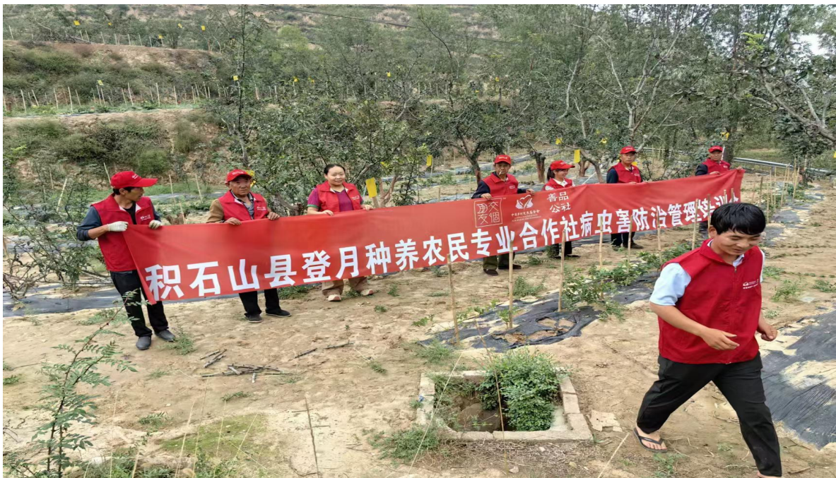
积石山县灾后产业恢复与发展项目花椒技术培训