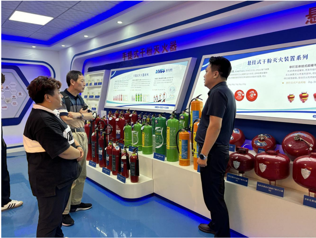
应急小站项目走访应急物资及伴随服务供应商