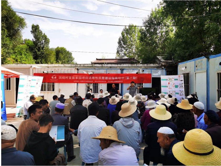
开展适用性民居建设指南培训照片