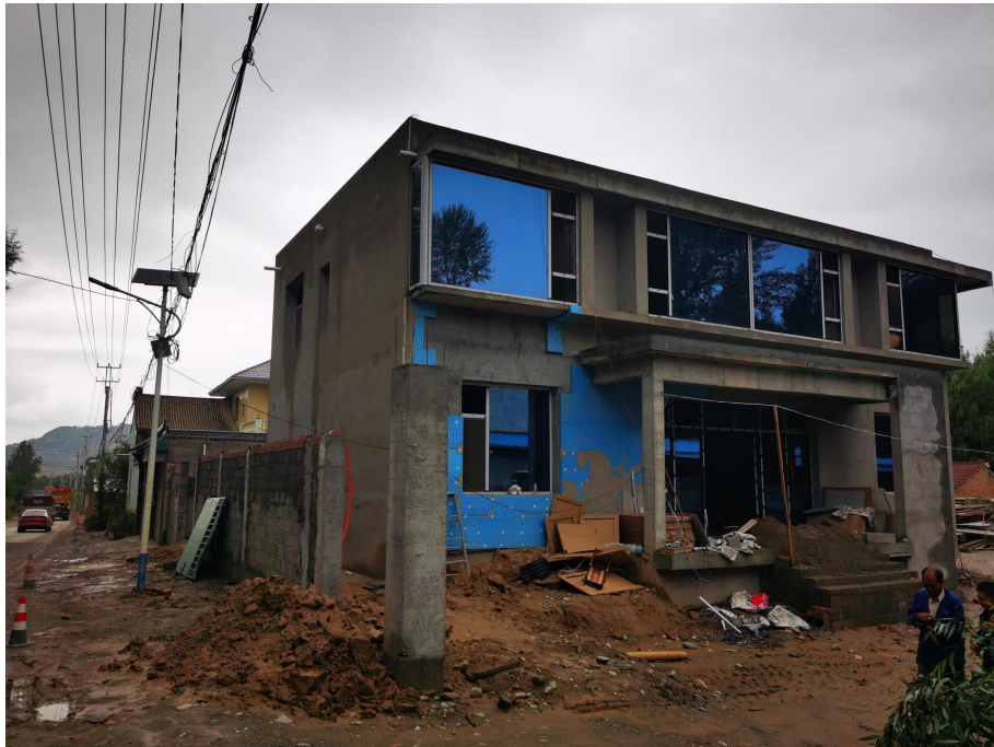
示范户施工建设照片