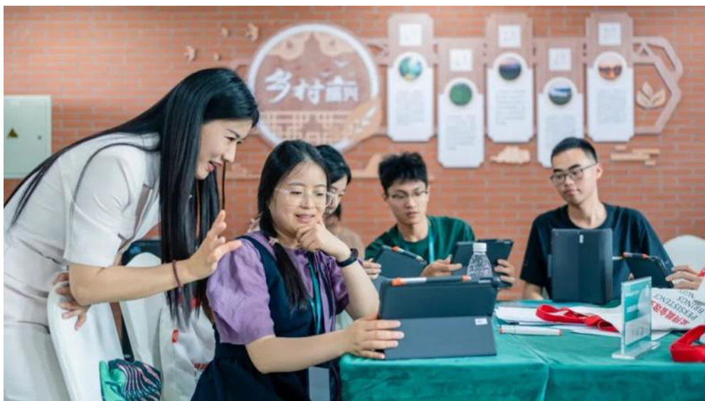
(学生学习拍摄剪辑技巧)