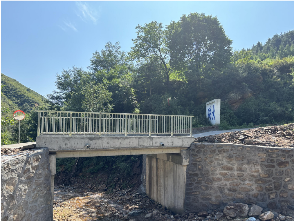
修建后的阜平县龙泉关镇黑林沟-大萝卜交叉口便民桥