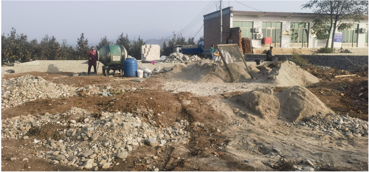
顺平县冷链库房修建实况