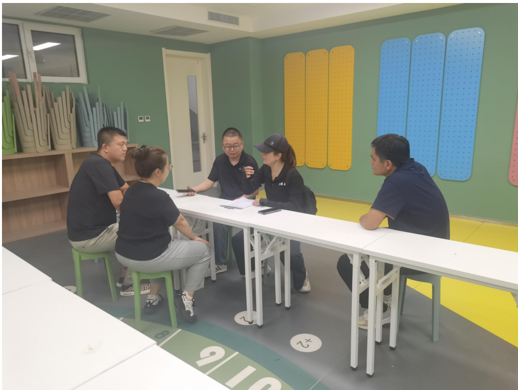
课程及教师能力建设执行机构入校调研照片