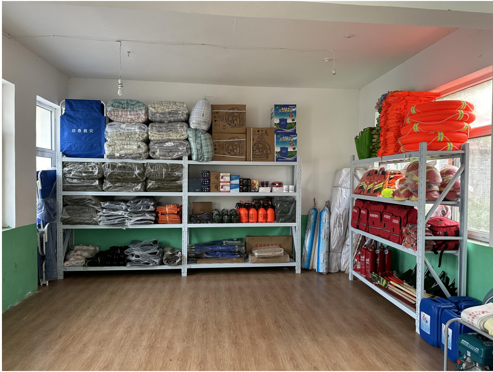
应急小站项目临城县项目区应急物资配送到位后的照片