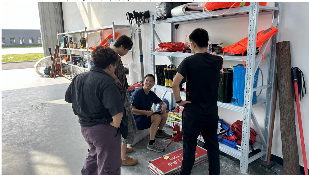
应急小站项目应急物资验收现场