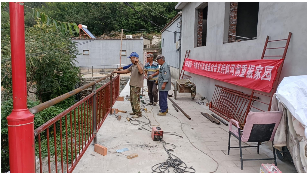
北京市门头沟区妙峰山镇斜河涧项目实施现场照片

7月-9月，支持北京市房山区及门头沟区共18个村开展灾后乡村微助计划，其中房山区霞云岭乡10个项目村及史家营乡5个项目村完成项目结项；门头沟区2个村项目正在开展中。