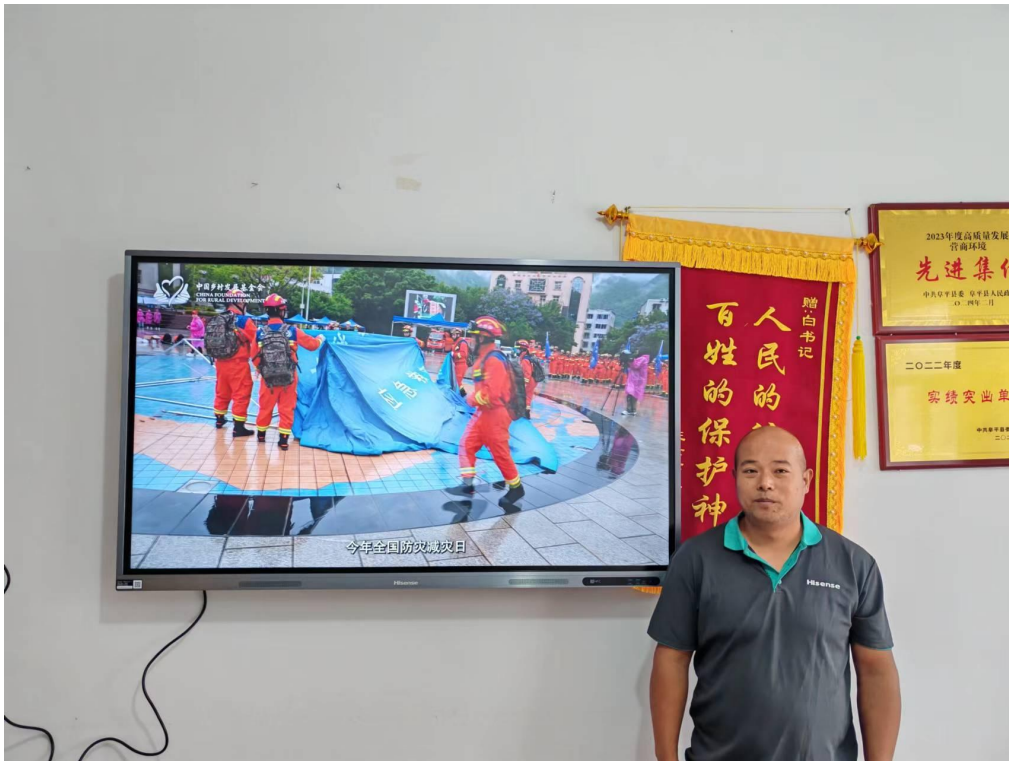
应急小站项目安装后的阜平县一体机照片

7月-9月，应急小站项目完成保定市、邢台市32个项目受益村应急物资确认，并开展样品验收和供应商走访工作。完成保定市、邢台市2市4县19个应急小站物资配送。