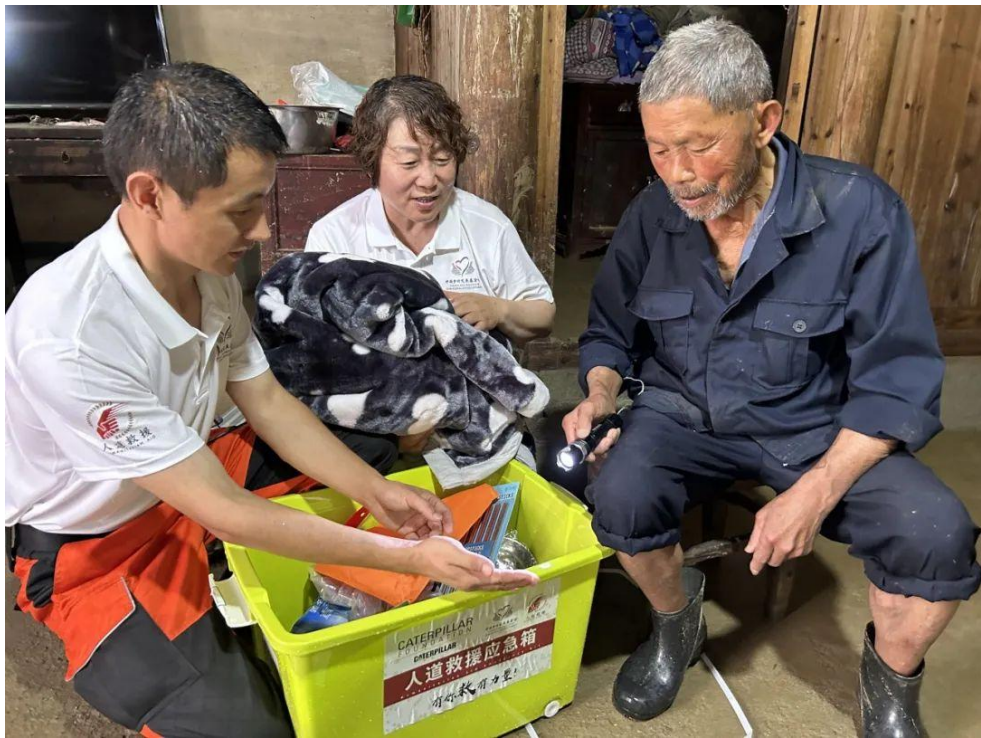
6·20 安徽黄山歙县洪涝灾害救援行动发放人道救援应急箱