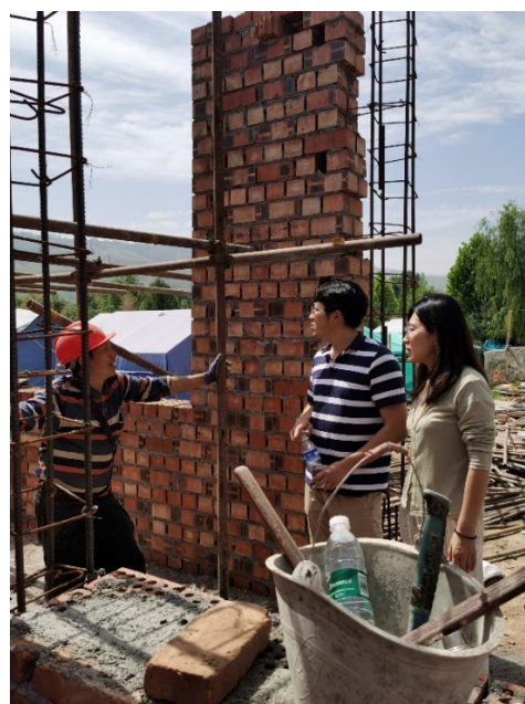
示范户施工设计指导