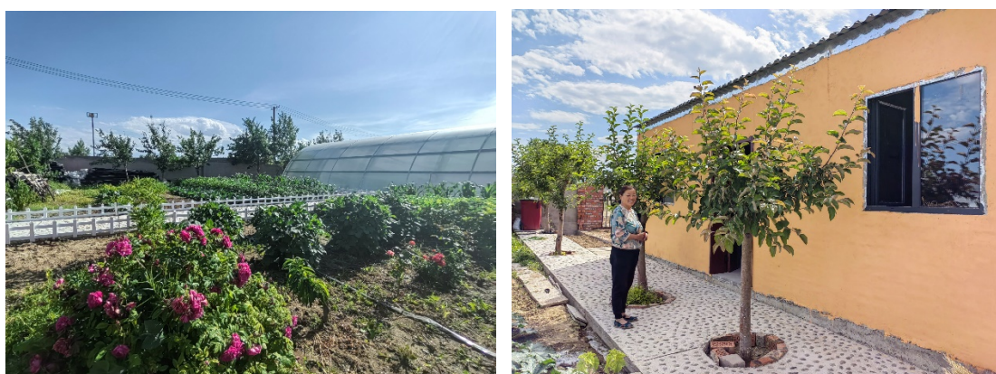
吉木乃县中国石油乡村环境综合整治提升项目（二期）成果之零碳小院

乡村人居环境改善合作项目第二季度完成了上杭县老兵智慧教室项目启动，由上杭县退役军人事务局承接；隆化县生态宜居你我同行项目启动，由隆化县教育体育局、隆化县苔山镇人民政府、隆化县农业农村局共同承接；共助囊谦新媒体建设项目启动，由囊谦县广播电视台承接。