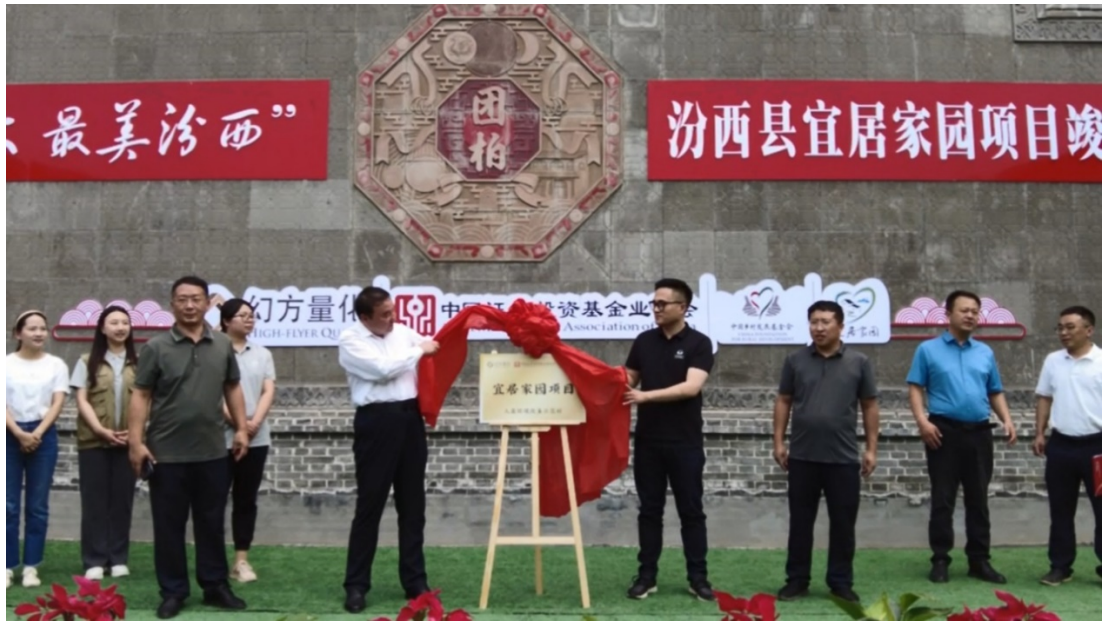
汾西县宜居家园项目竣工仪式