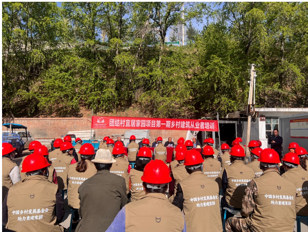
乡村建筑从业者技能培训照片

建设指导，开展一场乡村建筑从业者技能培训。截止6月30日，项目支出309.92万元，其中设计服务费17.25万元，农房补贴第一笔资金292.67万元。