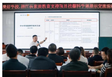
（榕江县老师们在古州第二小学集中培训）