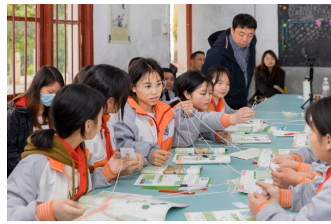
（专家名师在 3 所项目学校走访、听评课，与校长老师们交流）