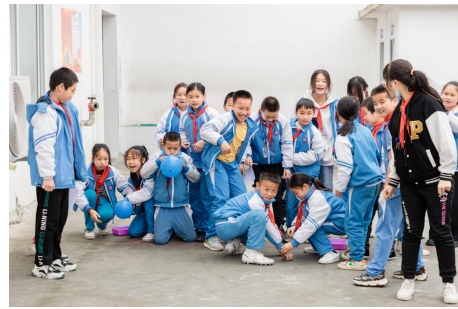
（湖州名师展示课《用气球驱动小车》小朋友们非常开心地参与其中）