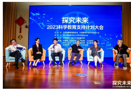
（榕江老师在浙江参与科学教育支持计划大会进行学习）