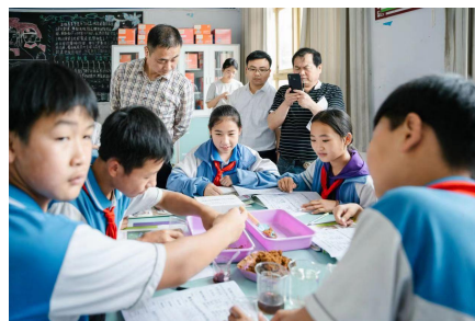
（寨蒿镇中心校、平江镇中心校老师在上科学展示课）