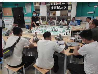
（榕江老师在湖州的学校进行听评课、学习交流互动）