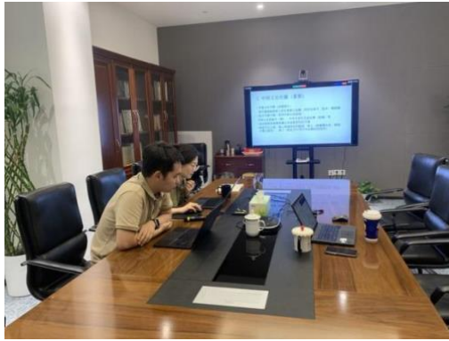
▲国际爱心包裹项目组同缅甸、尼泊尔、埃塞俄比亚当地执行团队召开项目专题沟通会