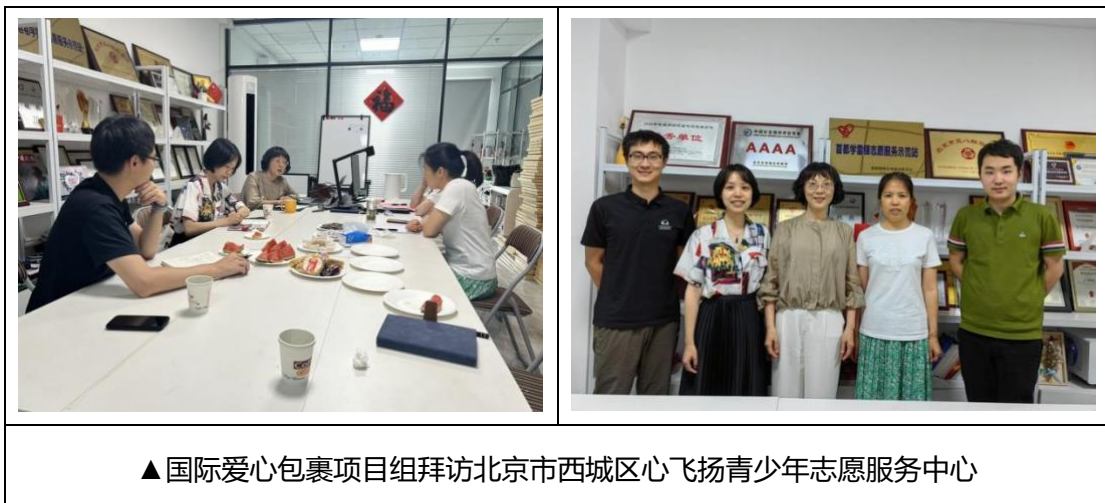
▲国际爱心包裹项目组拜访北京市西城区心飞扬青少年志愿服务中心