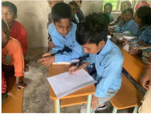
▲受益学生正在包裹领取表上签字