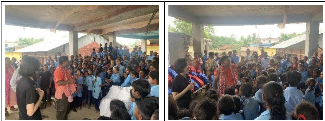
▲项目工作人员小戴正在向当地学生介绍中国