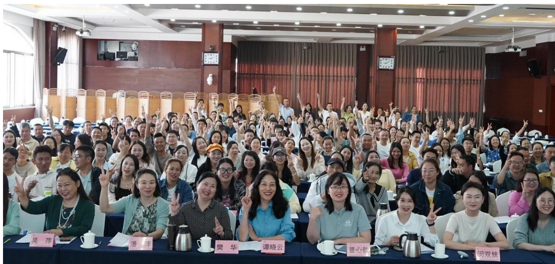
（南网知行书屋项目阅读培训）

屋项目 2024 年项目交流会。来自广东、广西、海南、贵州、云南 5 省（自治区）16 县的教育局项目负责人参会。本次交流会围绕南网知行书屋项目 2024 年重点工作安排、项目操作流程、项目影响力建设、打造书香校园等主题开展，设计了项目讲解、互动讨论、参访学习等多个环节，助力项目县负责人加深对项目的认识，提升项目管理能力。