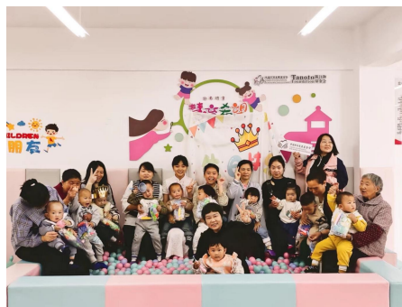
左图：宿迁市罗圩村中心，开展“人间五月天，童心表爱意”母亲节主题活动 右图：绥阳县蒲场社区中心，开展五月份母亲节暨幼儿集体生日会活动