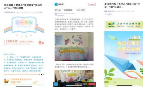
上图：江西省慈善总会官微、婺源县融媒体、宿迁市项目号进行六一主题传播