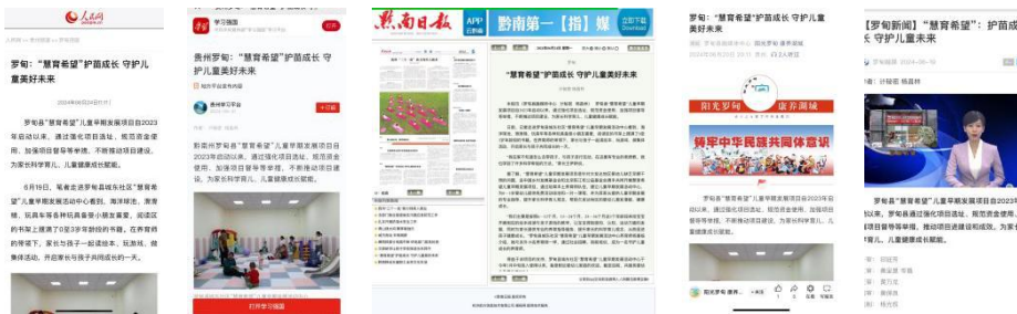
上图：人民网、学习强国、黔南日报、罗甸县融媒体、罗甸县电视-深度报道：贵州罗甸慧育希望护苗成长守护儿童美好未来

项目组积极调动项目区，鼓励引导项目区和养育师积极运用地方媒体等平台进行项目传播，扩大项目在受益地区的影响力。