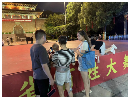
右图：绥阳县溪源村，养育师送课“一对一亲子阅读”