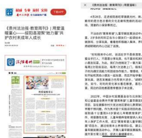
上图：贵州省法治报对于绥阳县“慧育希望”进行深度报道