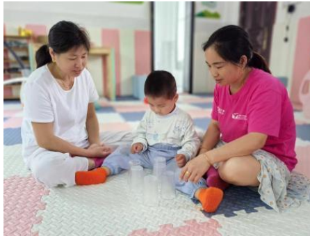
左图：凤冈县凤翔社区中心，养育师开展“一起来钓鱼”一对一亲子游戏 右图：乐平市耆德村中心，养育师开展“三层金字塔套杯”一对一亲子游戏