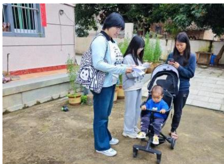
左图：莆田市荔城区畅林社区，养育师设计进行社区动员招生