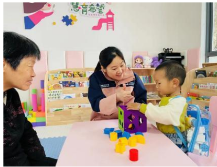
左图：会昌县晓龙乡中心，养育师开展“小鸭子”一对一亲子游戏 右图：婺源县幸福里社区中心，养育师开展“形状屋”一对一亲子游戏