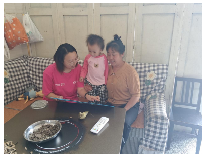
左图：凤冈县崇新村，养育师送教上门“一对一亲子游戏”