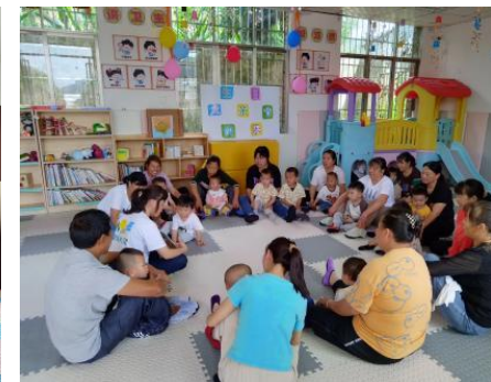
左图：赤水市康乐社区中心，养育师组织开展六一主题活动 右图：绥阳县晨光村中心，开展父亲节主题活动