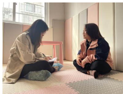
上图：绥阳县晨光村和蒲场社区调研访谈