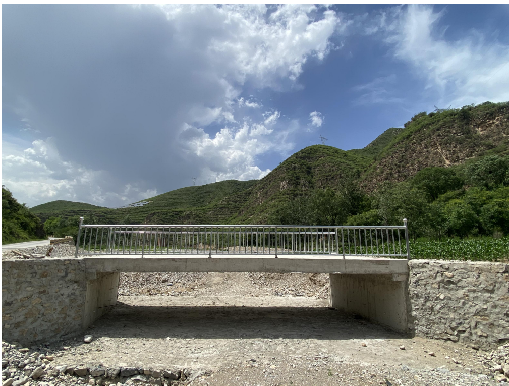
修建后的涑水县龙门乡野孤村杨家台便民桥

4月-6月，溪桥工程项目支持北京市、河北省、黑龙江省7个县（区）的78座桥，其中23座桥已竣工，45座桥已开工建设，10座待开工建设。项目支持天津市武清区、西青区、静海区7个乡镇的23个农业基础设施援助项目，其中4个项目已开工建设，19个项目待开工建设。