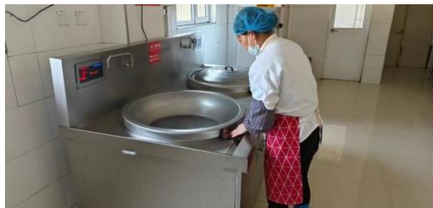
项目实施后，阜平县龙门小学厨工使用新爱心厨房设备做饭