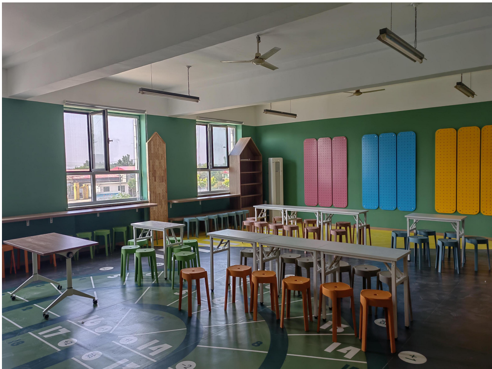
项目学校教室建设验收现场照片