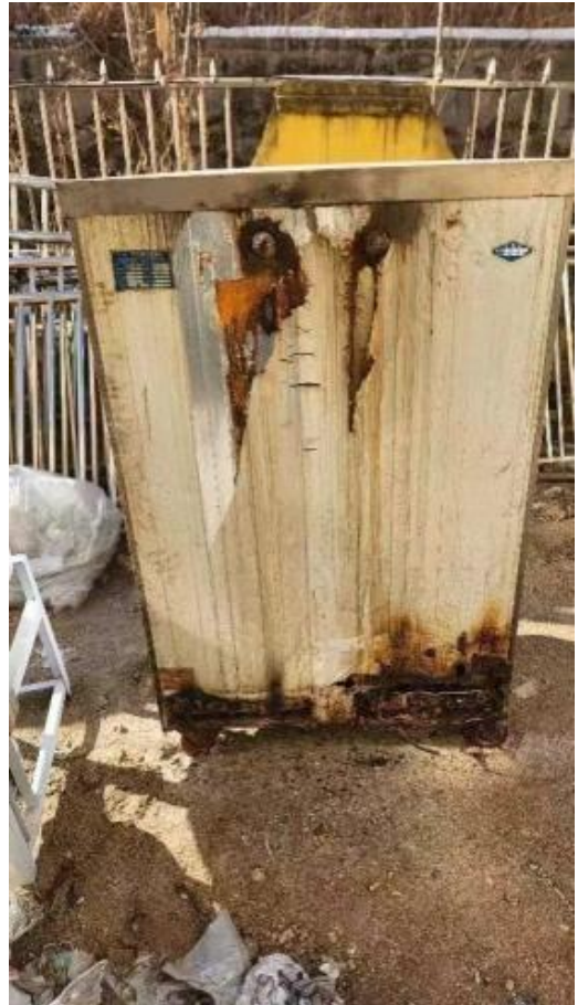
项目实施前，阜平县阜平镇农行大道小学厨房设备因灾受损