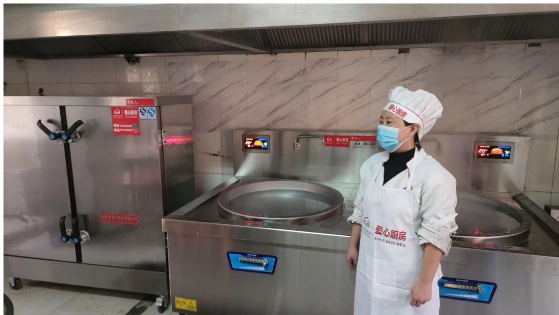
项目实施后，阜平县阜平镇农行大道小学厨工使用新设备