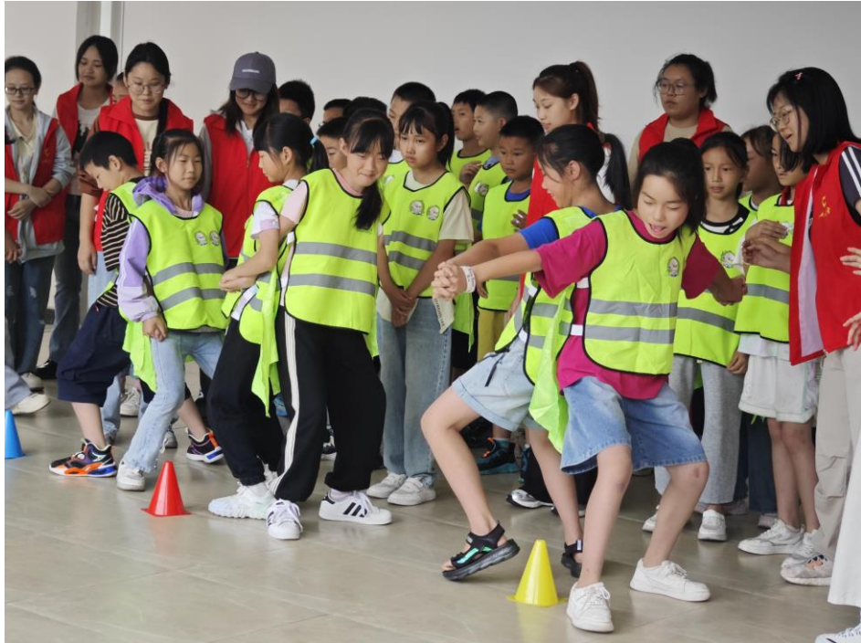
防灾减灾儿童安全课程活动开展现场