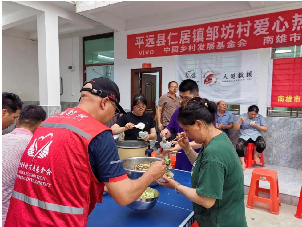
6·17 广东梅州平远县洪涝灾害救援行动开展热餐供应