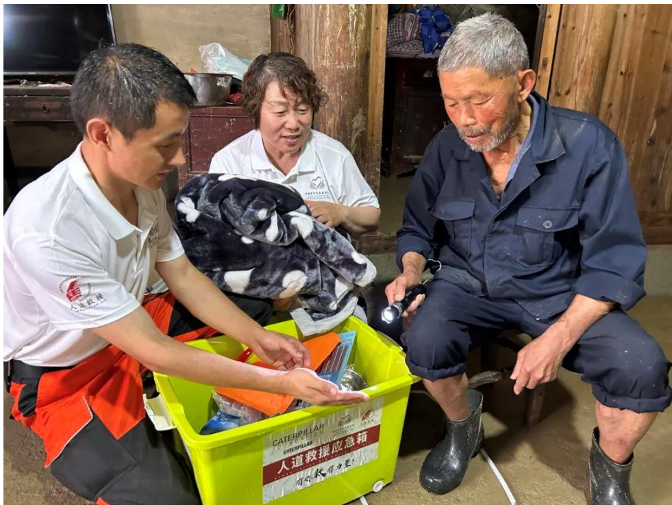
6·20 安徽黄山歙县洪涝灾害救援行动发放人道救援应急箱