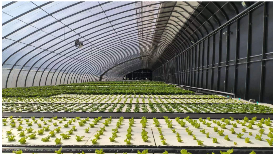
(温室园艺中心调研)