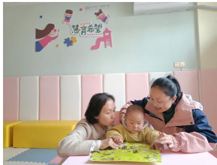
左图：凤冈县新建社区中心，养育师开展《我的妈妈去上班》一对一亲子阅读 右图：婺源县七里亭社区中心，养育师开展《动物》一对一亲子阅读