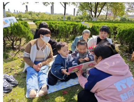
上图：婺源县武口社区中心，养育师组织开展集体生日会和“找春天”户外集体活动