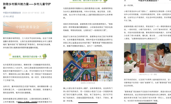
上图：我会官方公众号发布的妇女节推文

第一季度，项目结合三八妇女节开展节点传播。同时，引导项目区运用地方媒体等平台进行项目传播，扩大项目在受益地区的影响力。