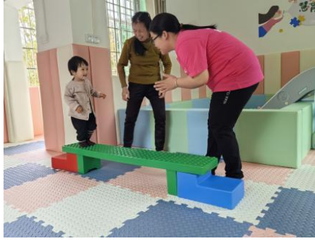
左图：绥阳县红海清华苑中心，养育师开展“爵士鼓演奏”一对一亲子游戏 右图：会昌县站塘村中心，养育师开展“学走平衡木”一对一亲子游戏动