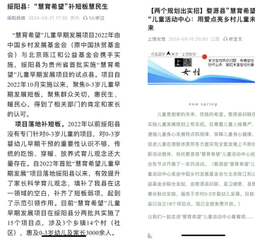
上图：绥阳民政、上饶妇联对于项目深度解读报道