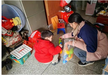
左图：绥阳县光明社区，养育师入户家访，了解儿童家庭情况 右图：泗洪县瑶沟乡，养育师送教上门，开展“保龄球”一对一亲子游戏