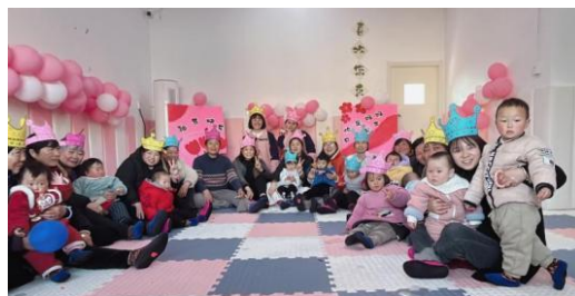
上图：宿迁市崞山村中心及罗圩村中心，养育师组织开展三八妇女节主题活动