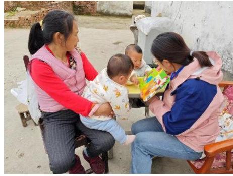
左图：乐平市环秀村，养育师送教上门，开展《水果》一对一亲子阅读 右图：婺源县武口社区，养育师送教上门，开展《农场》一对一亲子阅读