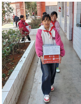
云南省宣威市前吉完小的学生正在打扫营养加餐储藏室（左）、搬运牛奶鸡蛋（右）