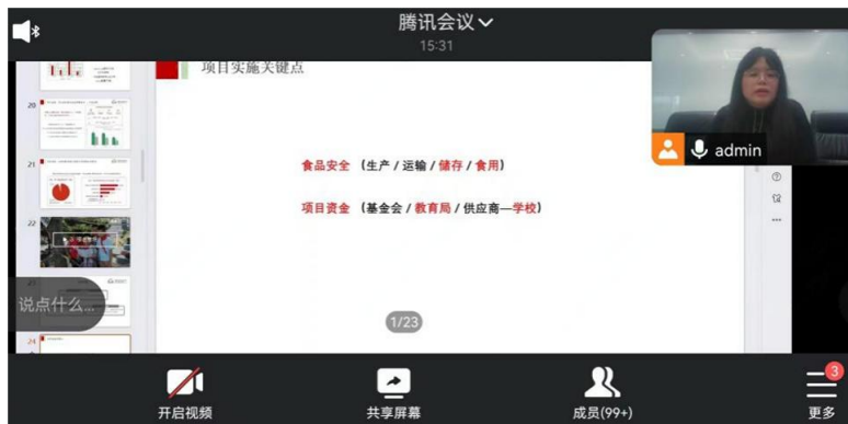
营养加餐项目管理培训

第一季度，组织开展春季学期营养加餐项目学校管理培训，围绕食品安全、日常存储等项目执行重点内容进行强调，进一步提高了项目学校的管理能力。云南省广南县、宣威市教育局代表、项目学校老师参加。