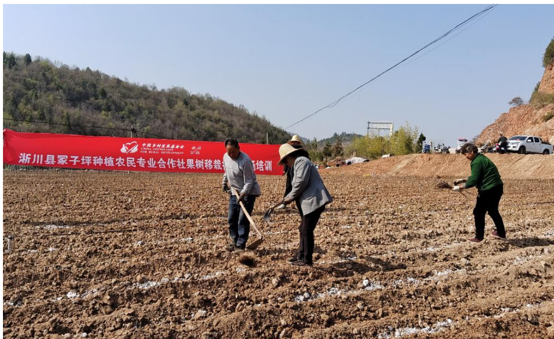
浙川县合作社培训