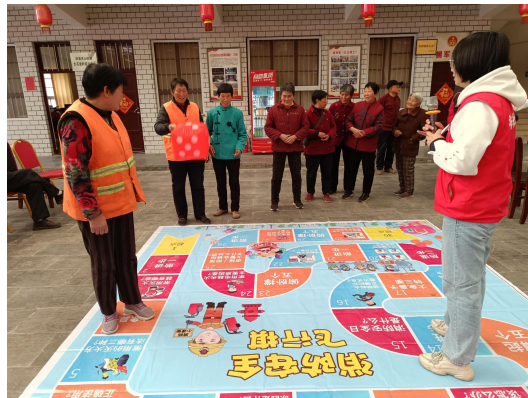
韧性家园项目大石岩村安全文化系列活动现场照片