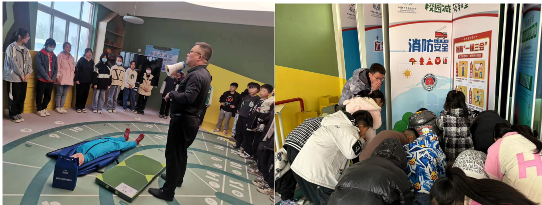
校园减灾教室项目学校日常开展校园防灾减灾课程照片

1月-3月，131所校园减灾教室学校利用减灾教室空间及课程资源开展日常校园防灾减灾课程。