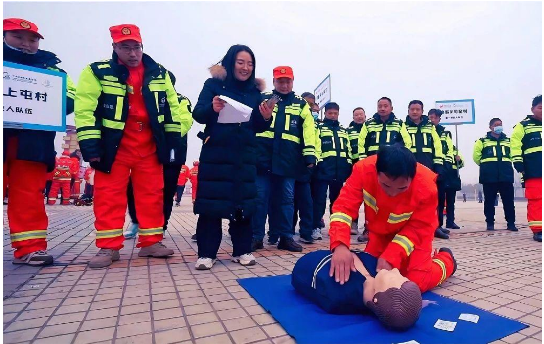
博爱县培训及大比武现场