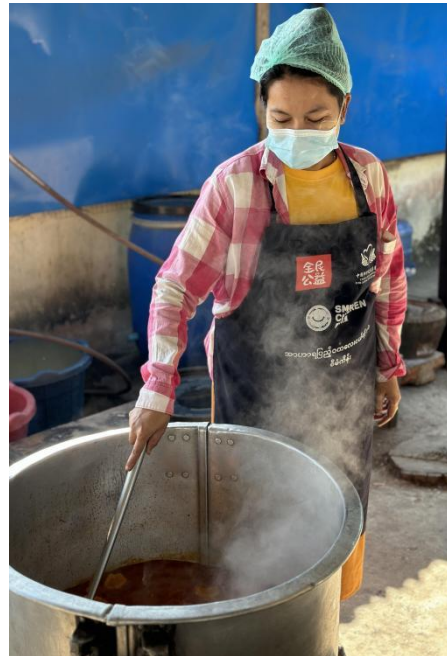
▲供餐妈妈团成员正在工作