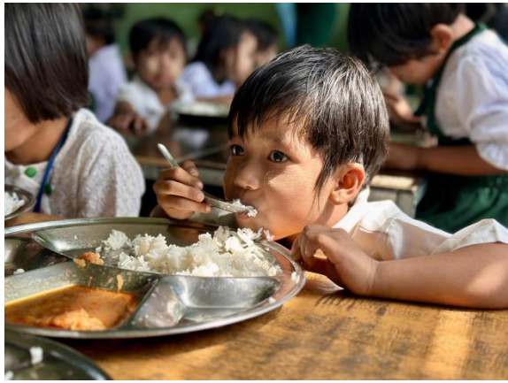
▲受益学生正在用餐