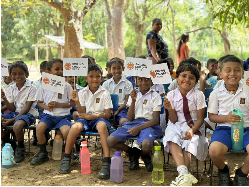
▲斯里兰卡受益学生在粮食发放现场