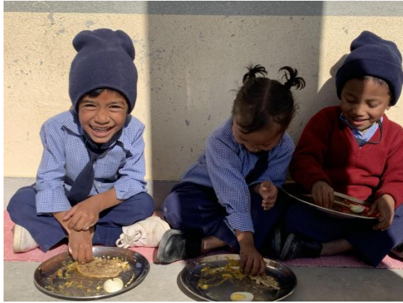
▲ 受益学生正在用餐