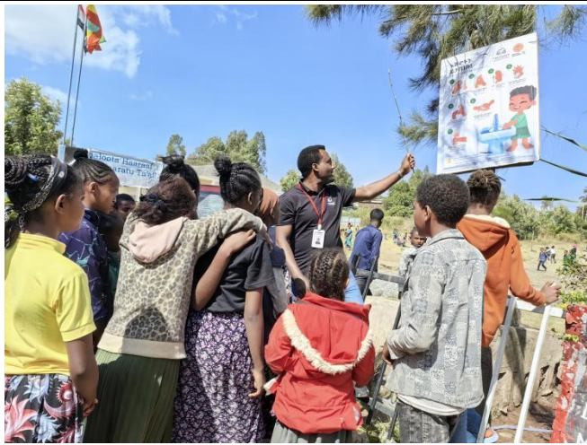
▲工作人员向学生们介绍卫生知识