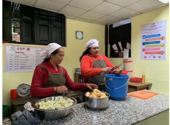
▲ 供餐妈妈团成员正在工作