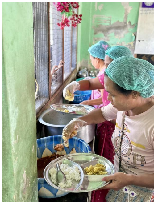
▲供餐妈妈团成员正在工作