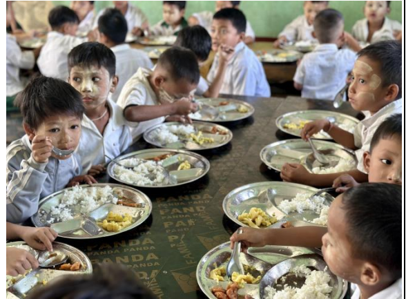
▲受益学生正在用餐