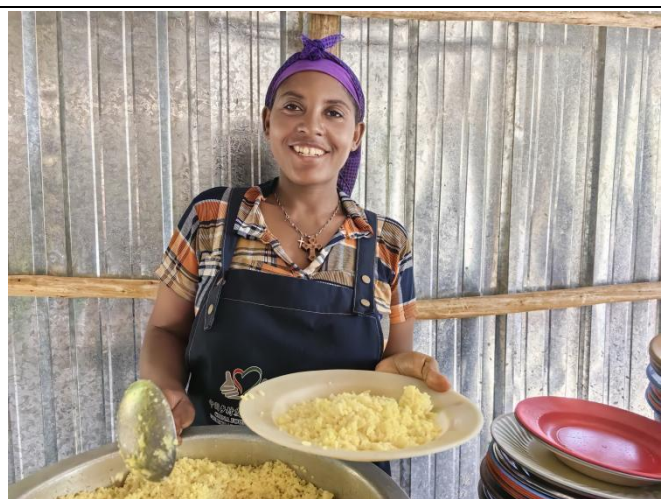
▲ 供餐妈妈团正在工作

9月，部分学校开学，同学们总是像期待节日一样期待新学期的第一餐。在图卢古拉查小学，学校里支起了巨大的火堆，全校师生围在火堆面前，共同期待中国爱心人士资助的校园餐在新学年继续供应；在布尔卡·古迪纳小学，当地教育局局长和市长办公室出席了新学期开餐仪式，并向中国乡村发展基金会表达感谢。教育局官员说：“微笑儿童项目的影响很大，我们都能看到这个项目为学生和家长生活带来的改变。有了微笑儿童项目，学生们总是早早来到学校，学习积极性和成绩都明显提高了。”