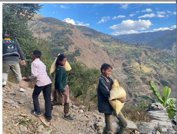
▲ 尼泊尔地震灾区儿童正在领取粮食包