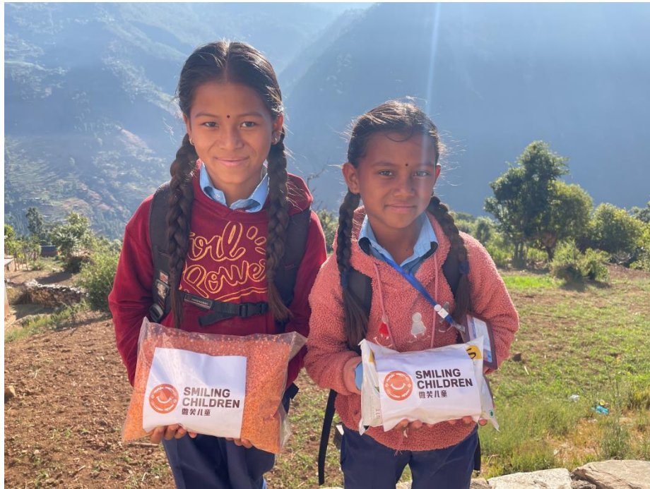
▲尼泊尔地震灾区儿童正在领取粮食包