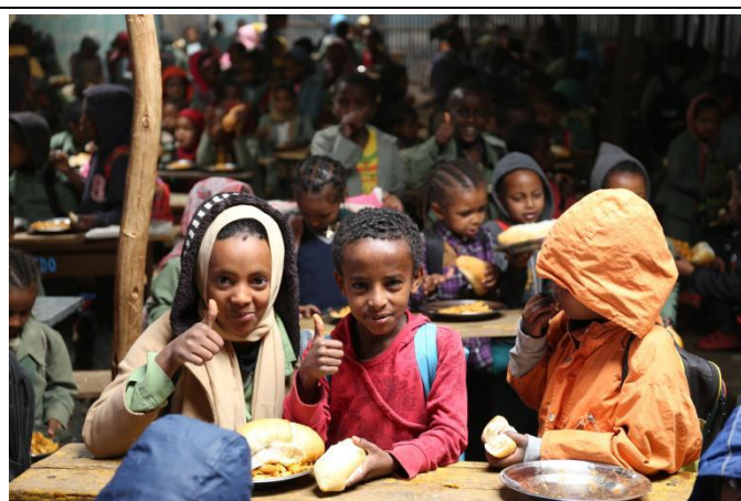
▲ 受益学生正在用餐