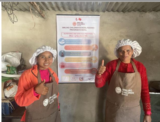
▲ 学校厨房挂上了食品安全海报