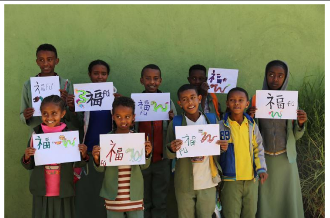
▲受益学生向中国爱心人士送上龙年祝福