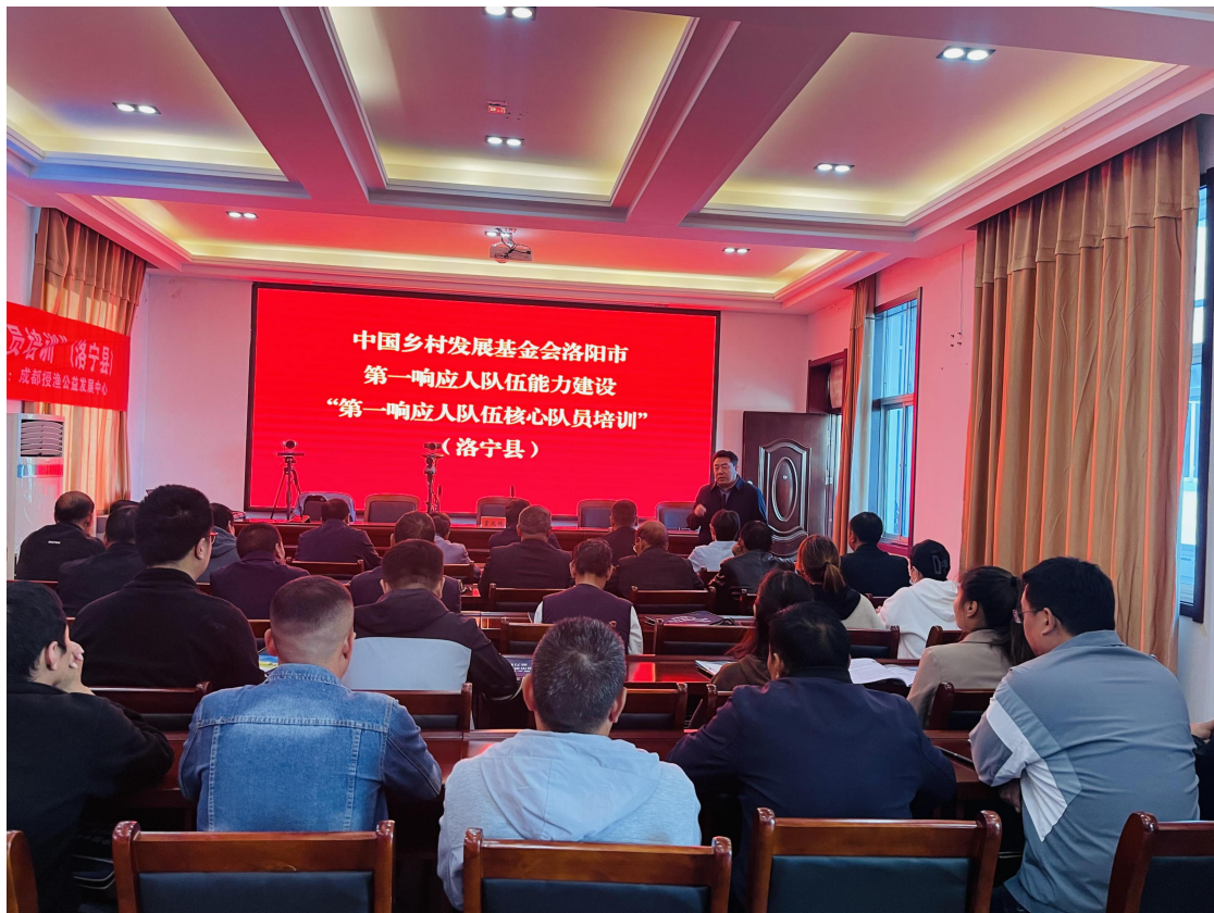
洛宁县第一响应人队伍核心队员培训现场照片

风险及隐患识别、队伍指挥与安全管理、常见救援场景的指挥与判断等七大方面提升队伍专业能力。第一响应人队伍开展大比武活动，通过演练的方式检验培训成果，激发队员自救互救守护家园的主动性，提高队伍的应急处置能力和社会动员能力。