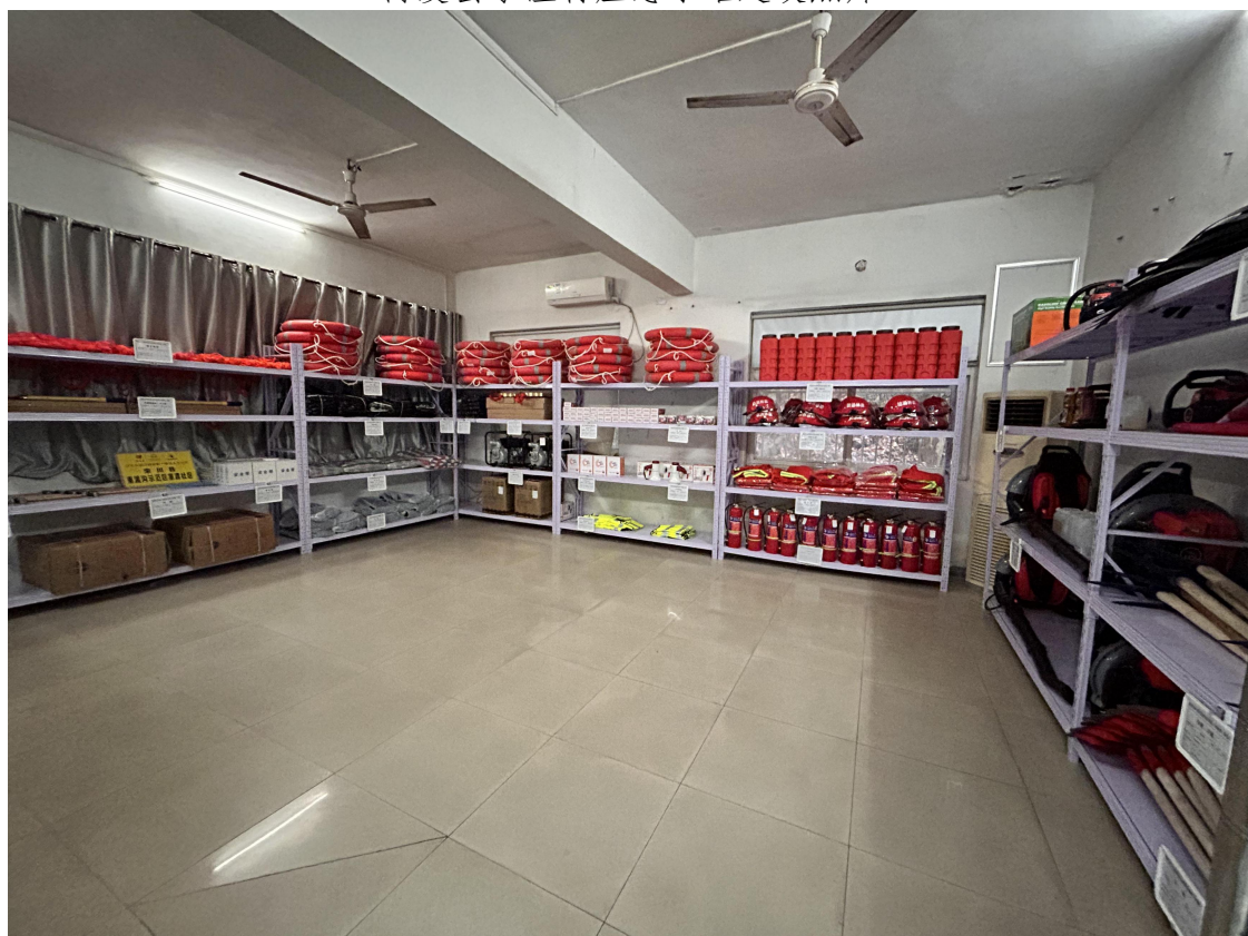
栾川县重渡社区应急小站建设照片

10月23日-12月25日，洛阳市洛宁县、栾川县、修武县陆续完成应急小站项目第一响应人队伍指挥长及核心队员能力建设，从灾害