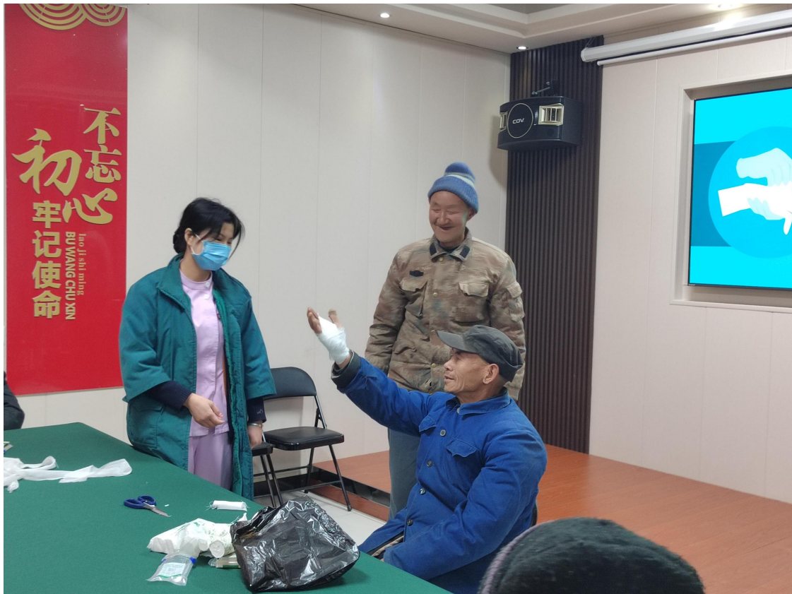
韧性家园项目大石岩村应急救护主题义剪活动照片