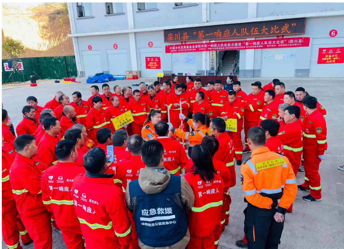
栾川县第一响应人队伍核心队员培训现场照片