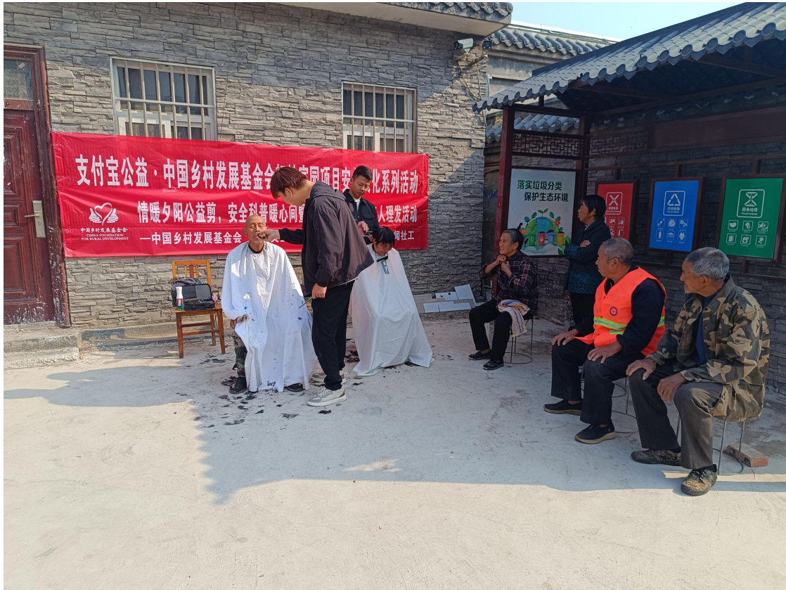
韧性家园项目大石岩村安全科普主题义剪活动照片