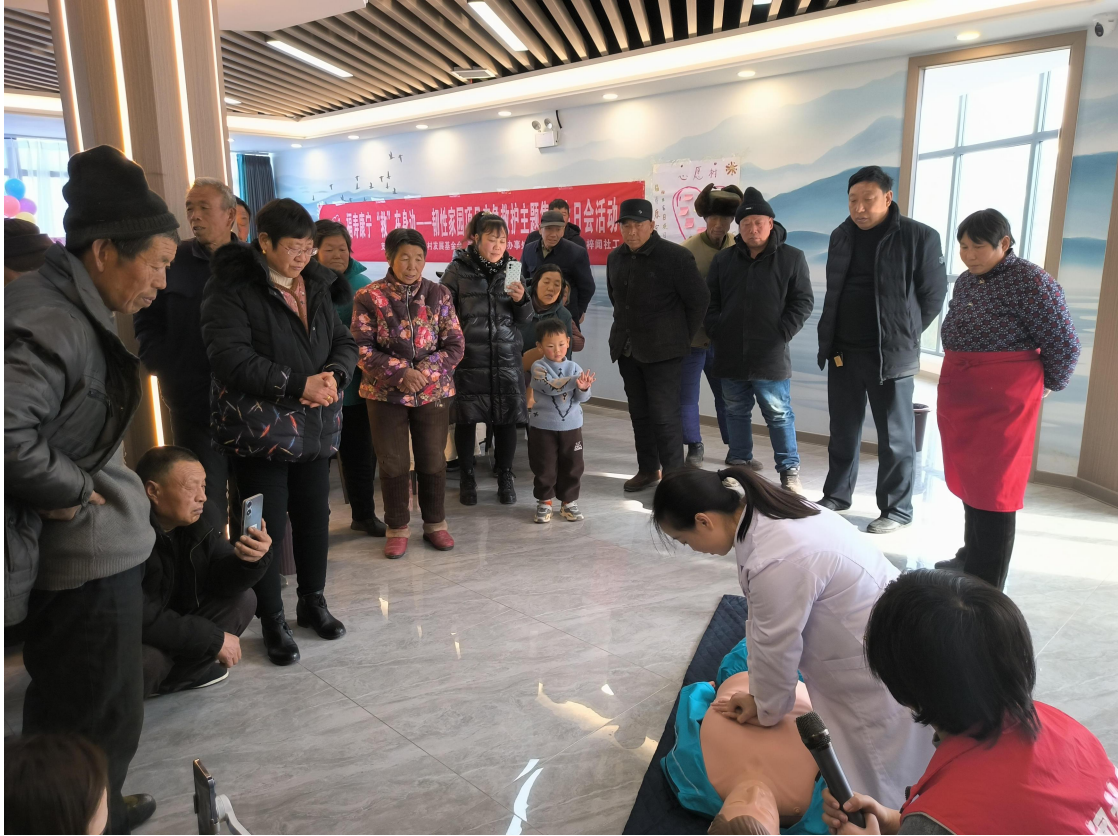
韧性家园项目大石岩村应急救护主题生日会活动照片