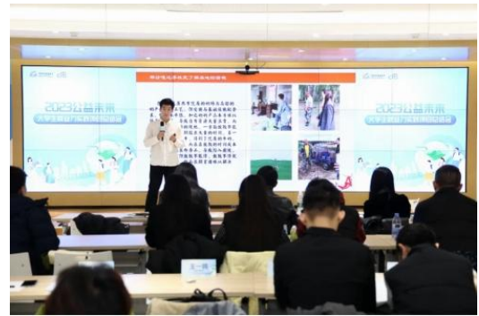
(天津天狮学院团队)

中国乡村发展基金会副秘书长王鹏表示，乡村振兴，关键在人。作为一个涉及乡村全方位建设的系统工程，乡村振兴战略需要各方面人才的支持，广阔乡村，大有可为；另一方面，大学生就业已成为全社会关注的焦点，关系着社会的稳定发展。乡村人才培养与促进大学生在“三农”领域就业是支持乡村可持续发展的重要举措。