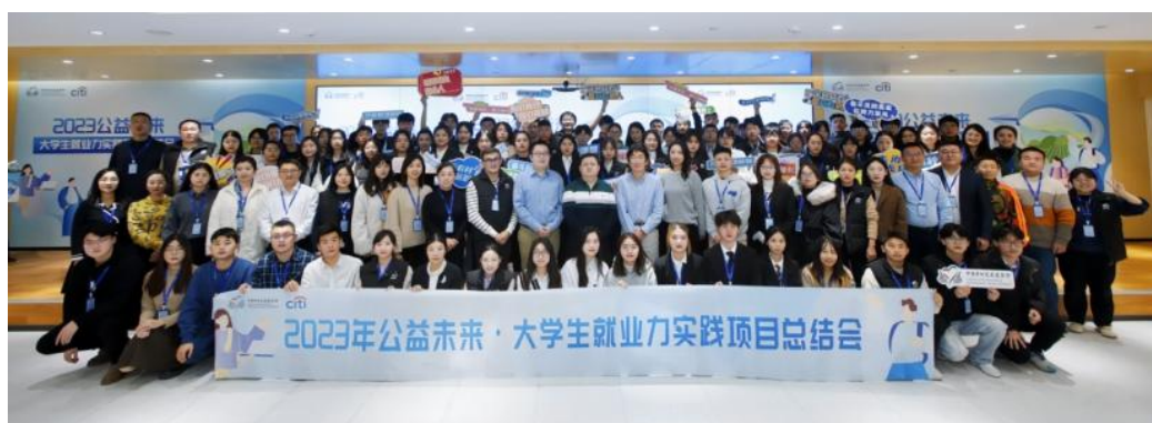
(2023 公益未来·花旗大学生就业力实践项目总结会合影)

11月26日，项目总结会在京举行，来自全国26所高校的大学生实践团队角逐全国6强。依据“目标完成性”“有效性”“创新性”“团队成长和协作”及“表现力”等评分维度，天津天狮学院“咕噜寻食记”，石河子大学“智慧棉农 数字棉花”科技服务团与山东科技大学“益科”技术服务队最终脱颖而出，获得成果汇报前三名。本次总决赛共吸引75.4万人次在线观看。