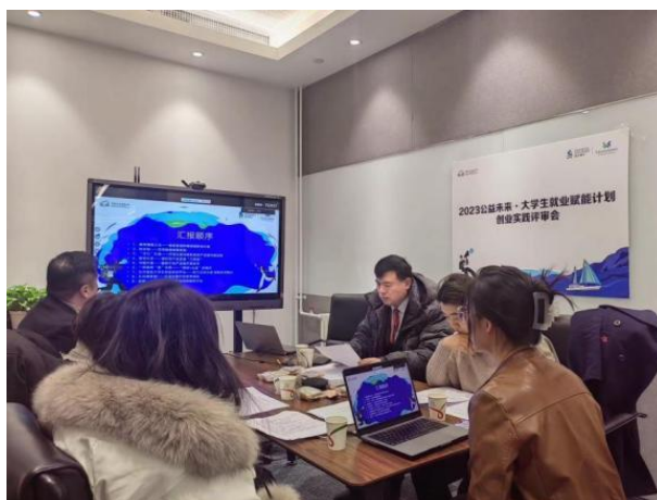
(优秀创业实践奖评审会现场)

12月21日，创业方案线上评审会在北京举办。本次评审会邀请投资人、农业领域、公益行业专家作为评委，对入选的25个创业团队进行评选，最终宁波大学、云南农业大学等五个高校的方案入选本年度优秀创业实践项目。