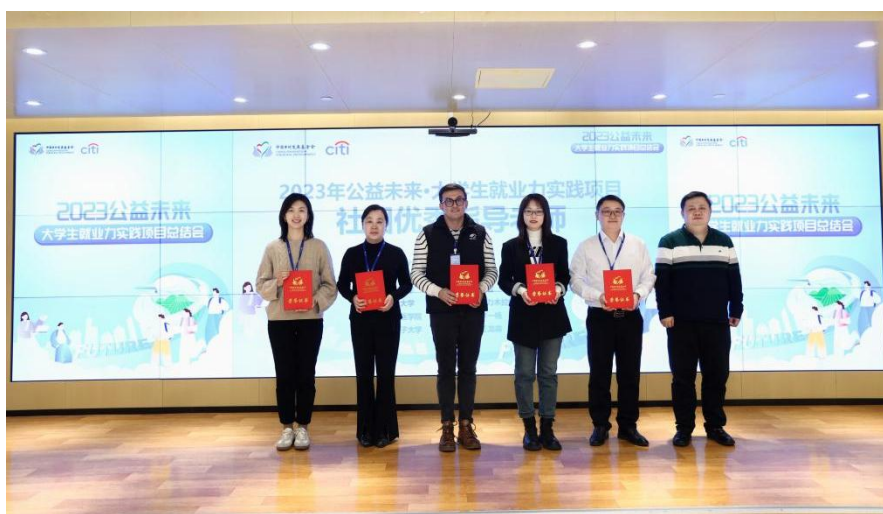
(图：优秀社团指导老师合影)