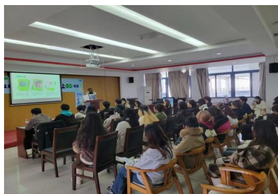
（高校社团开展大赛宣讲会）