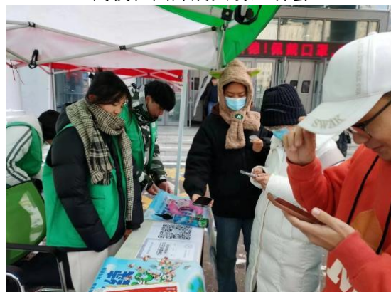
（大赛线下摆摊活动）