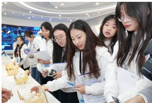
(学生前往农业公司参访)

开始，探索职场性格特征与职业期待。五天内去往渣打中国、微软中国、新浪微博、泡泡玛特等多家企业交流学习，体验职场真实工作环境，拓宽求职信息渠道与视野。