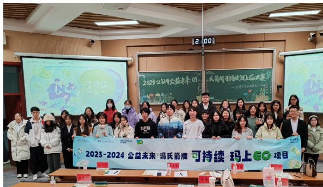
(校内赛决赛参赛学生和工作人员合影)

12月，经过广泛开展校内宣传和环保倡导活动，招募参与队伍并开展校内选拔。校内赛采用答辩汇报形式开展，由环保领域专家进行评选、晋级队伍至区域赛。