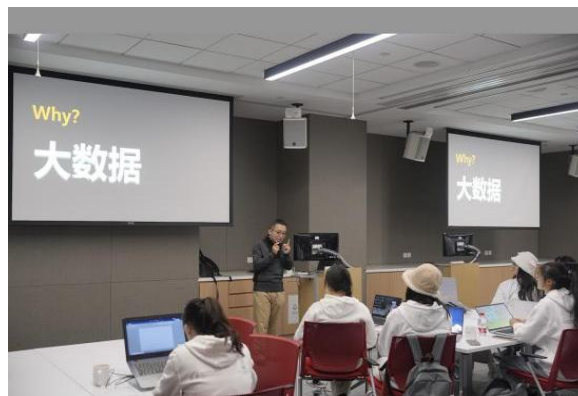
(微软 office 技能学习)