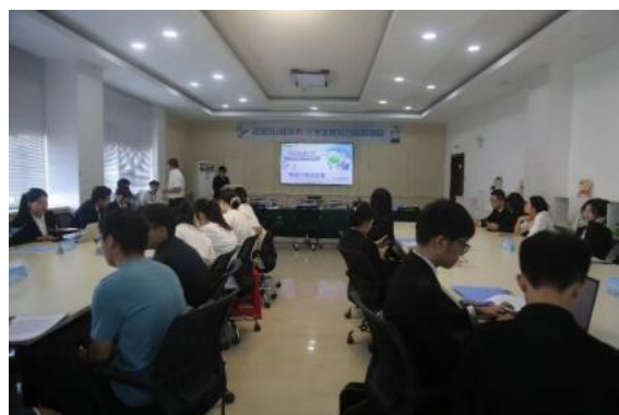
(石河子大学校内赛现场)