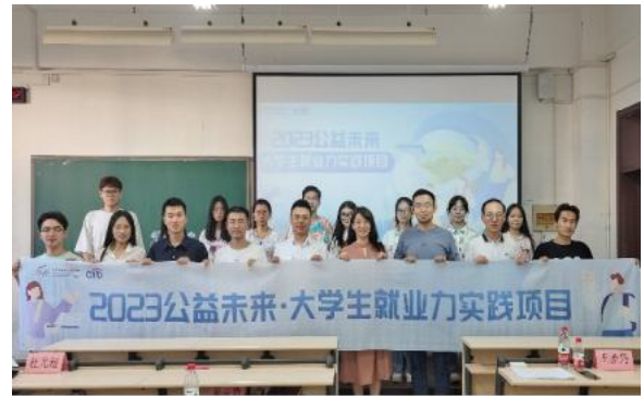
(中国海洋大学校内赛现场)