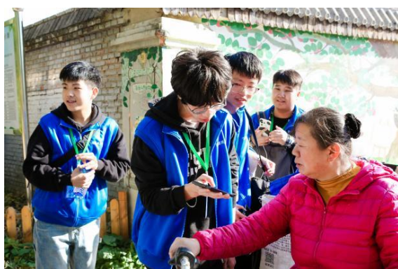
(学生代表实地调研乡村可持续问题)

11月2日-4日, 55所高校社团代表在北京及周边乡村展开了为期3天的高校培训会, 通过小组讨论形式开展赋能工作坊、乡村调研等活动, 提升社团代表综合能力。