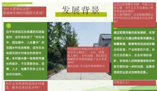
(图: 导师对方案的批注建议)

10月13日,项目组邀请四位公益领域专家对所有团队的方案进行初步评估与反馈,并根据团队方案情况匹配辅导导师。10月16日-11月15日,通过系统的线上课程和一对一的专业辅导,包括提供方案陈述模板、视频辅导会议以及持续的微信群答疑等环节,帮助学生团队更好地提炼和完善项目方案、提高项目汇报和问题解决能力。