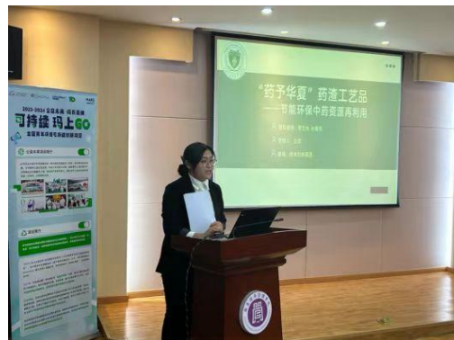
(参赛学生进行汇报展示)