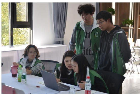
（学生探讨乡村环保问题）

持续主题”系列讲座；与同行者村庄（雄安胡各庄村、上海东厦村、广州深井村、十堰方滩村、成都安宁村）合作开展乡村调研活动。