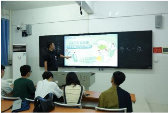
(湖南师范大学校内赛现场)