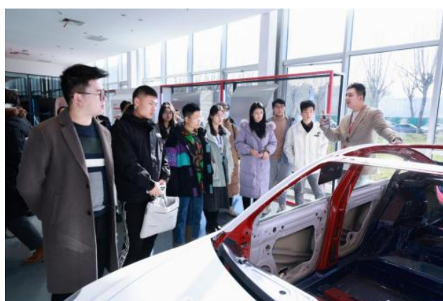
（同学们前往特斯拉参访）

11月27日，为了让同学们感受真实职场氛围，项目组织同学分组与各大企业HR、企业志愿者面对面交流职场经验。通过联合科技、农业、互联网、美妆、食品快消、潮玩文创、新能源等不同领域知名企业，项目探索出了“捐赠支持方+高校+雇主品牌+第三方就业平台”的多方参与模式，为大学生提供赋能培训与实习体验机会。