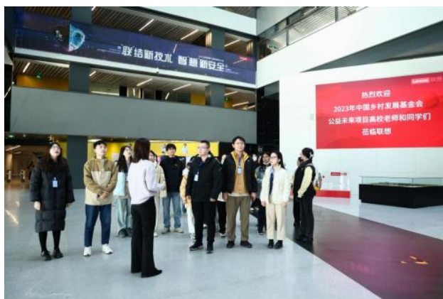
(参会团队前往联想参访)