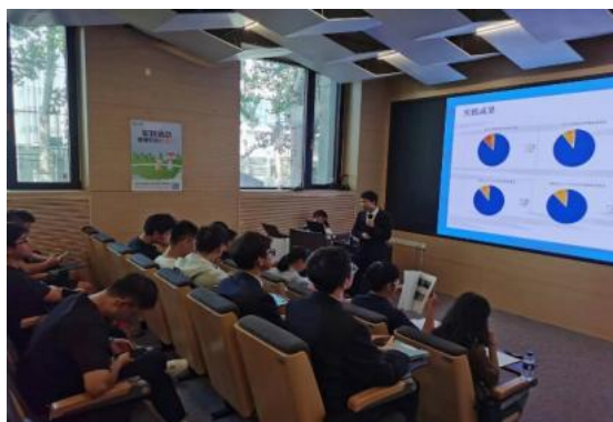
(北京交通大学校内赛现场)

9月1日-10月15日，各高校举办乡村实践成果评选校内赛，对学校十支实践团队的实践成果汇报进行检验，促进校内实践队伍之间的经验总结与交流。最终决出26支队伍晋级乡村实践成果汇报全国赛。