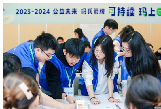
(学生探讨乡村环保问题)