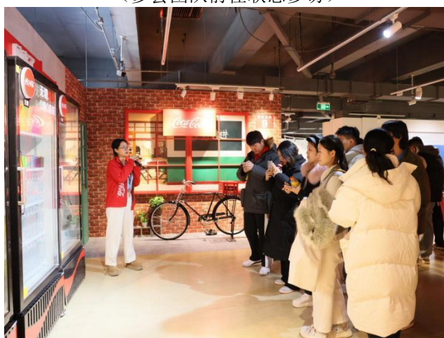
(可口可乐工作人员向同学们介绍公司发展历程)