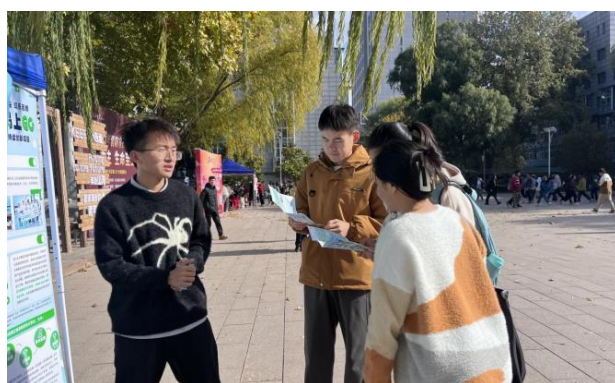
（志愿者为学生讲解大赛内容）

11月-12月，55所高校社团在校内展开了大赛宣传及参赛队伍招募活动，线上宣传累计54万浏览量，线下活动累计达160场。