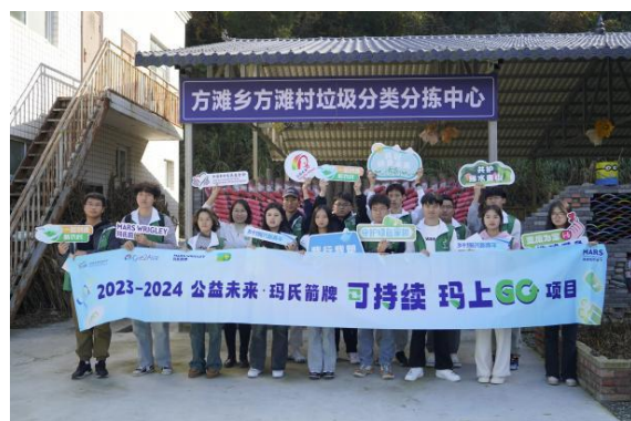
（学生代表在方滩村合影）