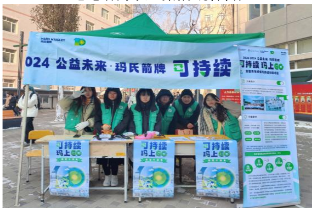
（线下活动工作人员合影）