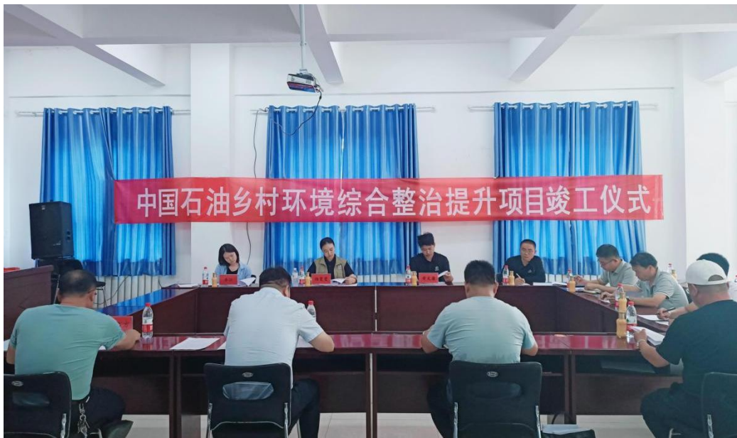
图为青河县中国石油乡村环境综合整治提升项目一期竣工暨二期项目启动仪式

2023年10月1日至2023年12月31日期间，宜居家园项目组分别与项目县相关实施单位及科研院所就项目建设进度、难题、时间节点等事项定期开展沟通。新疆维吾尔自治区尼勒克县、青河县、吉木乃县以及山西省汾西县等县开展工程建设工作。宜居家园项目组分别与项目县相关实施单