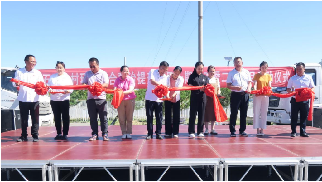
图为吉木乃县中国石油乡村环境综合整治提升项目一期竣工暨二期项目启动仪式