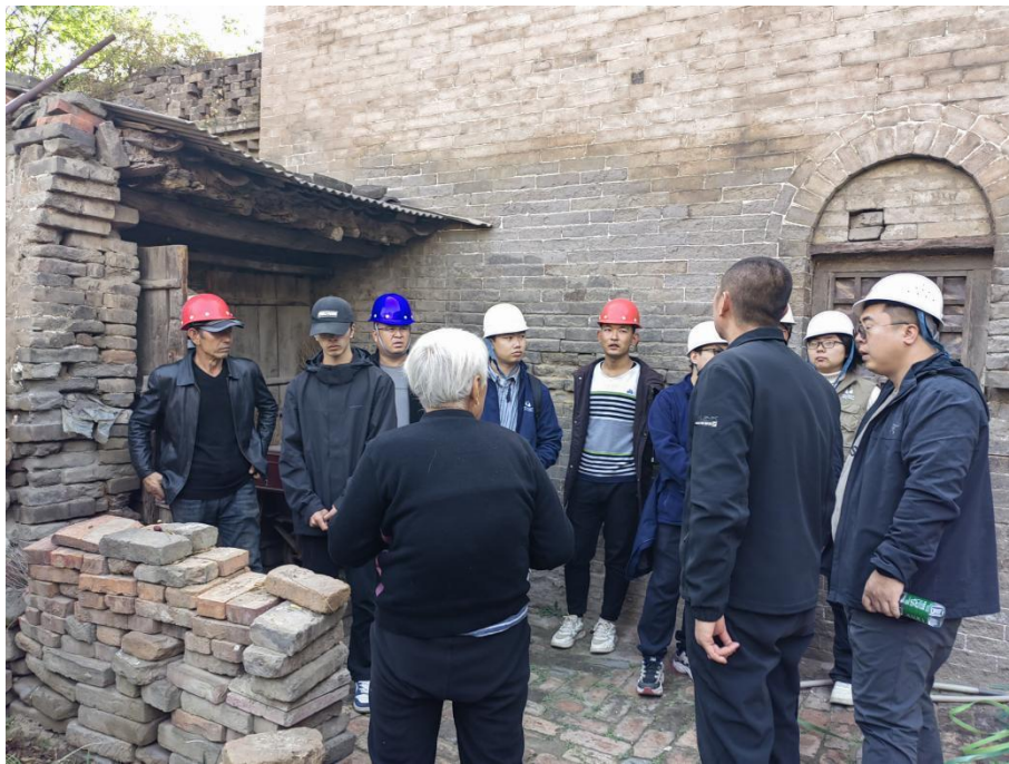
图为开展汾西县宜居家园项目驻场工作