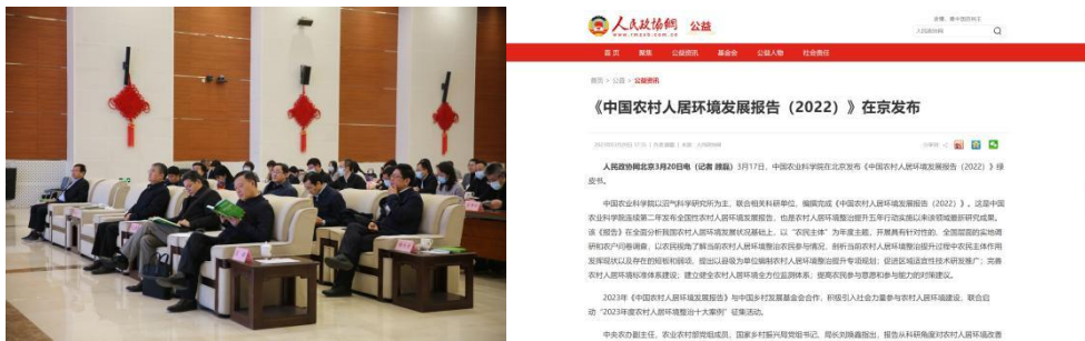
图7 《中国农村人居环境发展报告（2022）》发布会现场及新闻稿

1) 2023年3月17日，中国农业科学院在北京发布《中国农村人居环境发展报告（2022）》绿皮书。依据宜居家园项目在新疆三县的建设模式，所形成的“多元社会力量共商共建农村人居环境整治提升——宜居家园项目在新疆的探索与创新”案例，入选2022年《中国农村人居环境发展报告》绿皮书典型案例。并在《人民政协报》、《公益时报》、《农民日报》等媒体发布新闻。