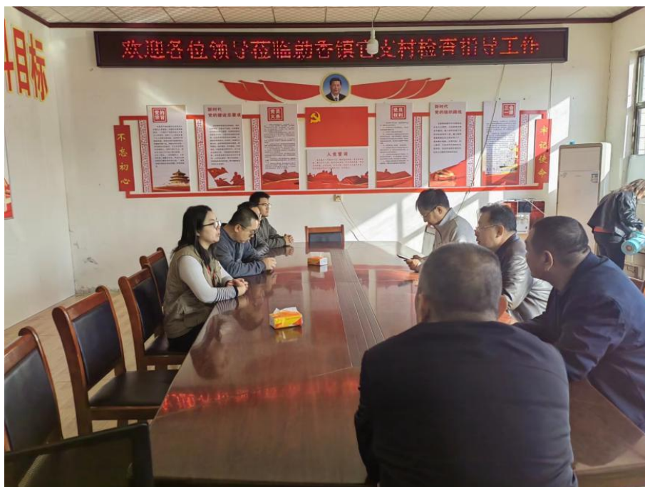
图为开展汾西县宜居家园项目调研工作

期调研选点工作；湖南省永顺县开展前期调研及落地建设等工作；河南省滑县、封丘县持续推进乡村振兴示范点建设及人居环境整治改厕项目；两台垃圾处理设备已经在贵州省赫章县及云南省麻栗坡县顺利落地。