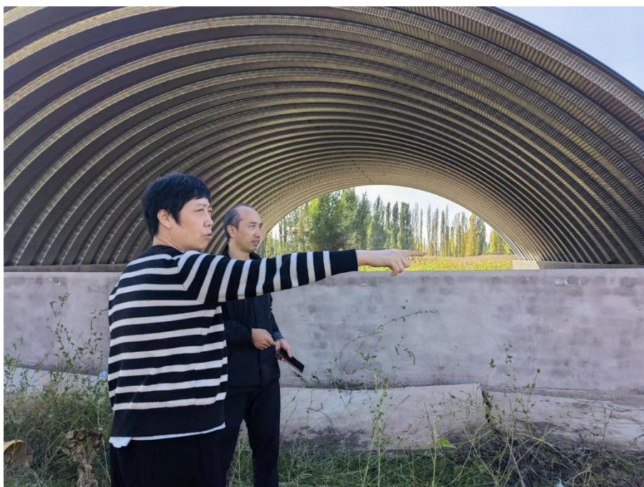
图为开展尼勒克县中国石油乡村环境综合整治提升项目技术交底工作