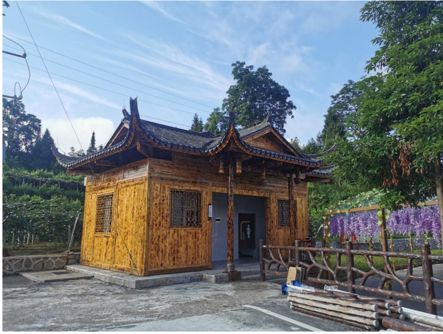
图为永顺县宜居家园项目公厕

2023年7月1日至2023年9月30日期间，宜居家园项目组分别与项目县相关实施单位及科研院所就项目建设进度、难题、时间节点等事项定期开展沟通。新疆维吾尔自治区尼勒克县、青河县、吉木乃县一期项目进行验收并完成二期项目启动仪式；山西省汾西县举办项目开工仪式并开展工程建设；河南省滑县、封丘县持续推进乡村振兴示范点建设及人居环境整治改厕项目。