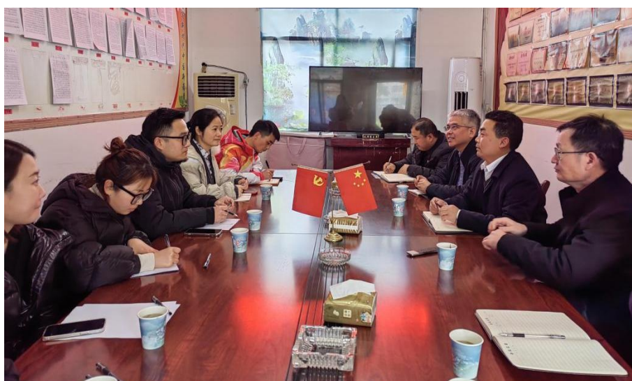
图为开展永顺县宜居家园项目调研工作