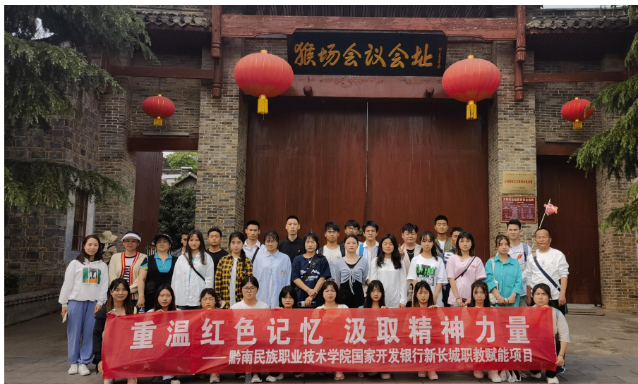
在猴场会议会址前的合影

4月25日至26日，5月19日至20日，2所项目受益院校开展游学活动，帮助同学们拓展视野，实现了资助保障与成长性发展相结合。