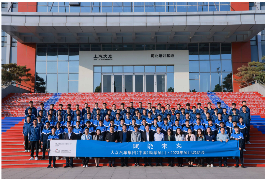
2023 年项目启动会合影

10月27日，“赋能未来”——大众汽车集团（中国）助学项目2023年项目启动会在河北石家庄市顺利举行。90名河北省受助中高职学生齐聚河北交通职业技术学院，共同见证了2023年“赋能未来”助学项目的正式启动。活动邀请了3位具有丰富职场经验或经销商店工作经验的企业志愿导师，为学生们带来了实用的课堂分享，涵盖表达交流、文化认知和信息检索与筛选等方面的内容。这些分享将帮助学生提升语言沟通表达能力，了解一线经销店工作经验，学习高效检索和筛选有效信息的方法。同时，这些课堂分享也将制作成视频素材，以便更多学生学习，从而提升综合能力，助力他们的长远发展。