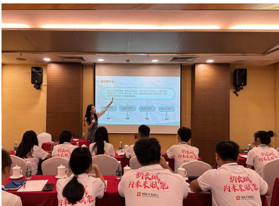
暑期能力提升成长营活动照片

7月，国家开发银行新长城职教赋能项目暑期能力提升成长营活动在北京举行。来自贵州省、四川省四所高职院校的二十名优秀学子齐聚北京，参加能力提升课程及研学活动。