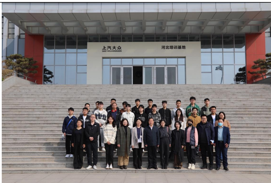
与河北交通职业技术学院受益师生合影

4月25日至26日，项目组赴四川汽车职业技术学院、北川羌族自治县“七一”职业中学进行回访，监测项目开展情况，沟通发展新需求并进行项目评估工作。