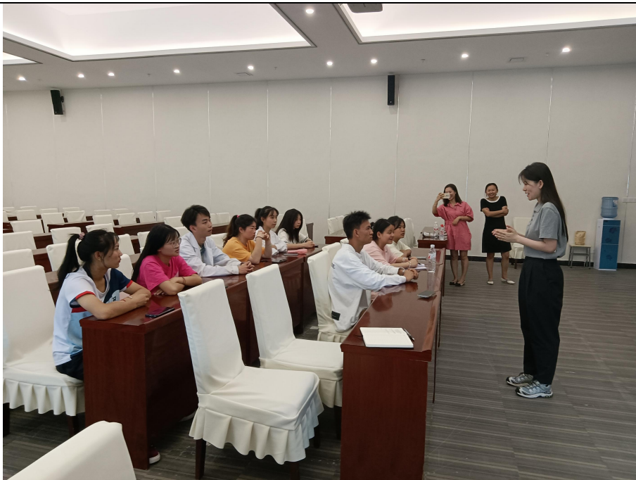
与受益学生代表交流