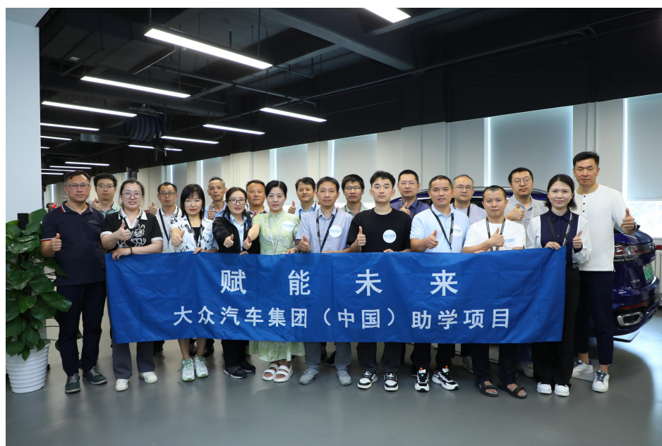
2023年暑期教师交流活动合影

7月25日至28日，“赋能未来”助学项目教师暑期交流活动在京举办。活动旨在使教师们更深入的了解新能源汽车理论知识并提升实践能力，从而在未来教学过程中更好地帮助学生全方位了解新能源汽车行业，为学生在相关领域的学习及发展提供有力支持。来自湖南、四川、河北六所中、高职院校的十五名教师参与活动。