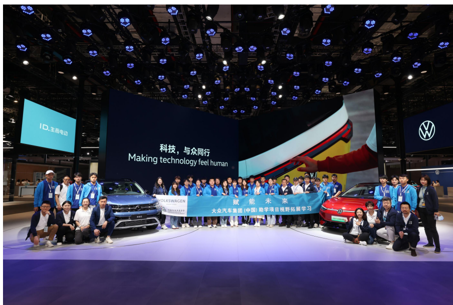
上海车展观摩合影

三十名优秀学子齐聚上海，通过参观上汽大众经销商店、上汽大众新能源汽车工厂和上海车展等实践活动，深入了解汽车行业最新产品和前沿技术趋势；大众汽车集团（中国）志愿者、经销商店工作人员以及工厂员工与学生们深入交流，在开拓视野的同时，帮助他们全方位了解汽车行业的就业环境与未来职业发展前景。