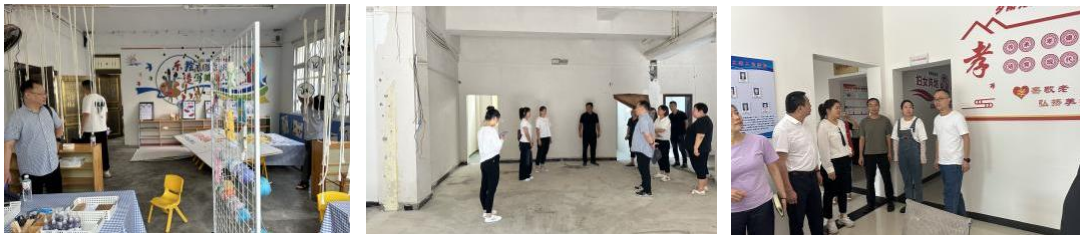
上图：分别为罗甸县、凤冈县和赤水市项目实地调研

第三季度，项目组紧密推进新增项目点申报工作，面向贵州省及江西省组织开展项目申报线上说明会，并完成贵州省实地调研工作。