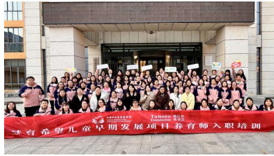
左图：2月27日-3月2日，2023年项目苏赣黔30村养育师入职培训在婺源开展 右图：12月24日-28日，2023年项目贵州省新增35村养育师入职培训在绥阳开展

第二，开展养育师线上督导。2023年苏赣黔第一批项目试点养育师入职培训后，配套开展6个月的在线督导答疑，包括专家答疑、专家诊断、实操指导会，有效巩固培训的成果，在养育师理论学习的“窗口期”给予督导支持，有效巩固提高养育师队伍整体业务水平。