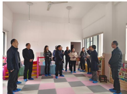
左图：贵州省项目说明会，共计4个市州，7个区县民政相关负责人参加 右图：与会人员实地参访绥阳县溪源村儿童早期发展活动中心

第三季度，分批次对新增申报的项目县和项目村进行实地考察调研，综合评估儿童早期发展活动中心场地适配性以及养育师的全职性、稳定性和专业性，新增项目村实地调研完成率达 100%，最终确定在贵州省、江西省 2 省 8 县新增 55