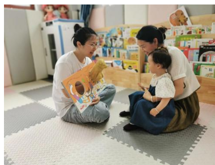
上图：养育师开展一对一亲子互动游戏课程和一对一亲子阅读