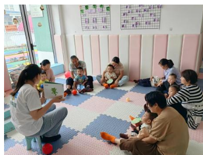
上图：养育师开展集体活动和集体故事会