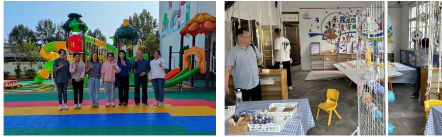
上图：分别为江西省和贵州省新增项目点实地调研

第三，在项目执行检查方面。对于 2022 年第一批试点县，项目组根据项目执行情况，对婺源县、绥阳县及宿迁市 4 区县全部进行实地督导调研，检查养育师开展课程服务的专业性以及县项目办项目管理执行的规范性。