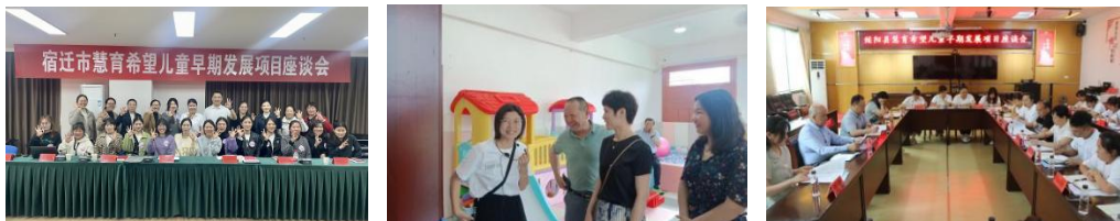
左图：4月10日-12日，宿迁市实地督导并开展集中座谈会

第三，在项目执行检查方面。对于 2022 年第一批试点县，项目组根据项目执行情况，对婺源县、绥阳县及宿迁市 4 区县全部进行实地督导调研，检查养育师开展课程服务的专业性以及县项目办项目管理执行的规范性。