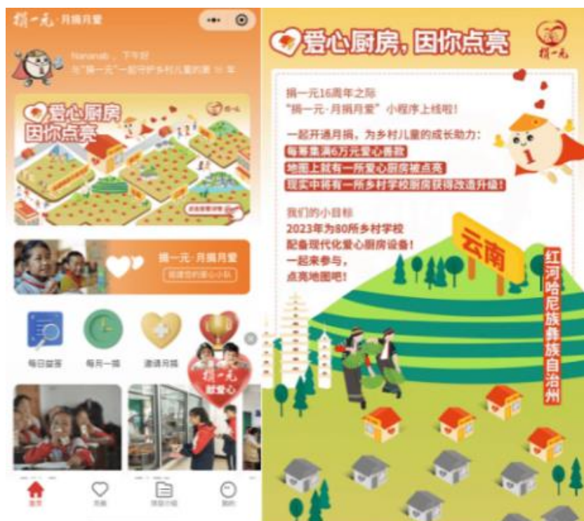
“捐一元，月捐月爱”小程序页面

2、捐一元项目参与多平台传播节点活动：参与腾讯平台99公益日，共动员18个项目县参与；邀请秦岚等20多位明星、达人带筹款链接参与抖音话题活动；支付宝蚂蚁庄园平台活动。