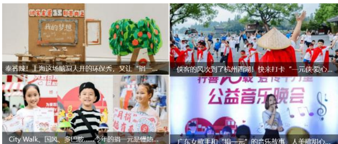
微信公众号“捐一元”推送文章

4、捐一元项目在百胜全国市场开展线下劝募活动：捐一元项目在百胜中国的全国市场开展创意主题活动，如非遗剪纸、环保秀、多巴胺市集等，在有爱的互动中点滴持续、人人公益的理念正浸润入更多大朋友小朋友心中。