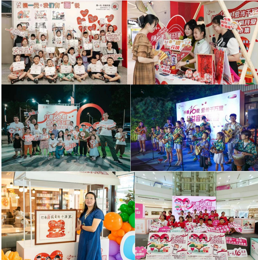
百胜中国在全国市场开展线下劝募活动精彩照片