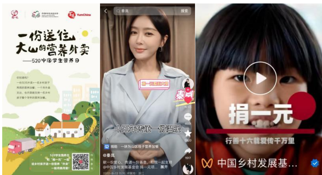
从左至右依次为：520中国学生营养日#大山里的小小外卖员#话题活动；

2、捐一元项目参与多平台传播节点活动：参与腾讯平台99公益日，共动员18个项目县参与；邀请秦岚等20多位明星、达人带筹款链接参与抖音话题活动；支付宝蚂蚁庄园平台活动。