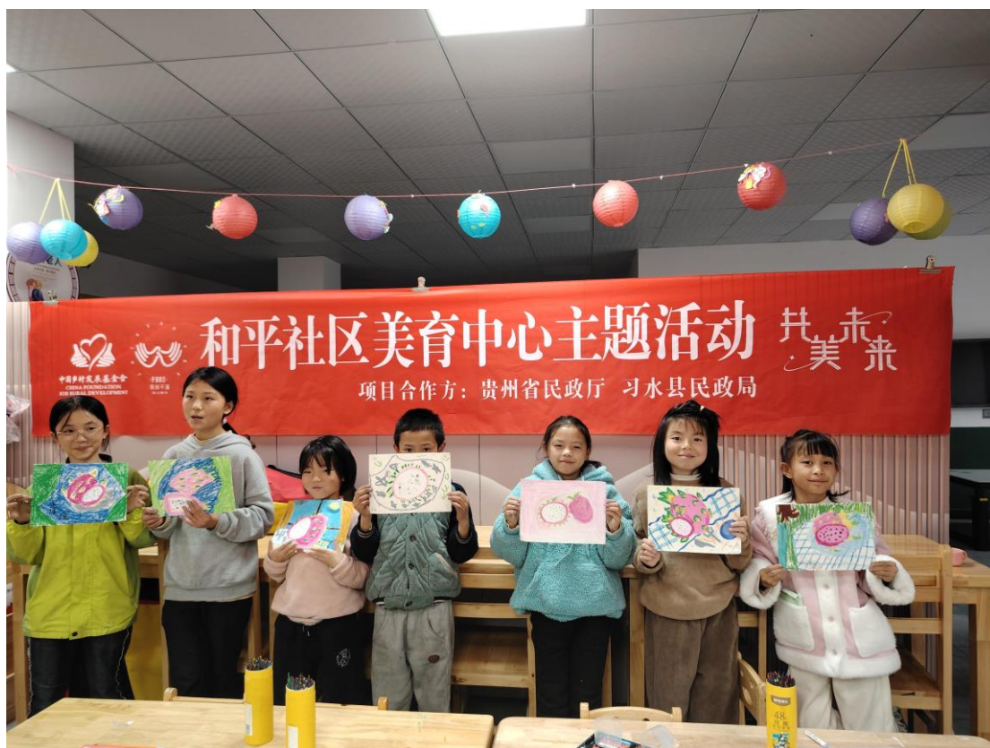
图：《枚瓣裹雪影》课堂中，孩子们展示“火龙果”作品