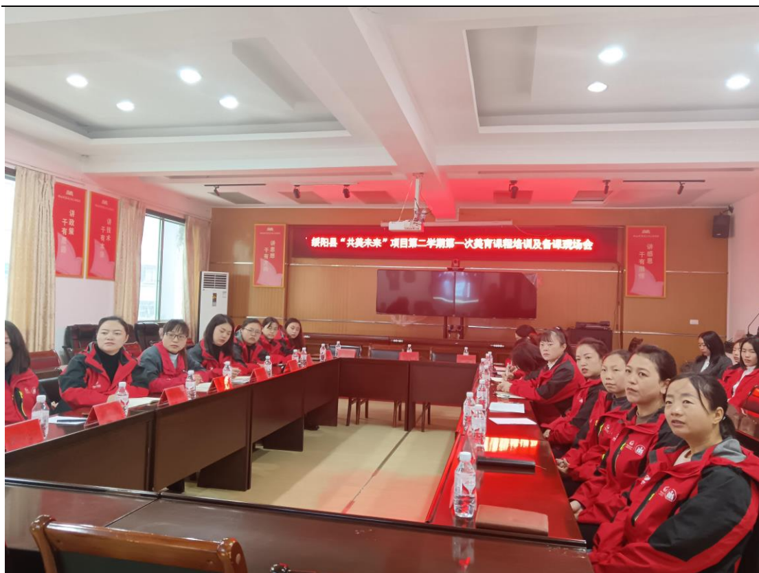
图：2023 年 11 月 24 日，第二期共美未来项目顺利开班