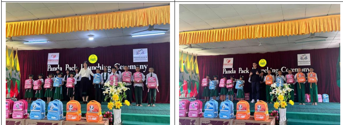
缅甸爱心包裹发放仪式