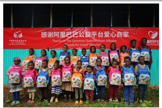
爱心包裹发放仪式