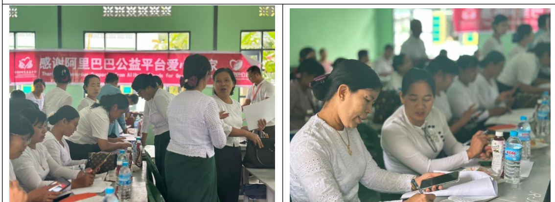
缅甸爱心包裹项目培训