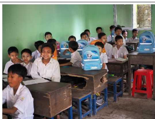
缅甸爱心包裹受益学生