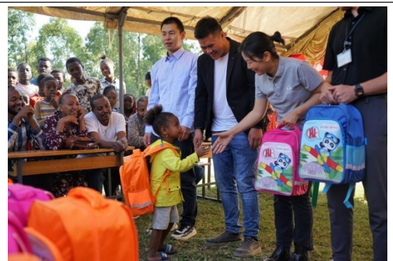
工作人员给当地小学生发放爱心包裹