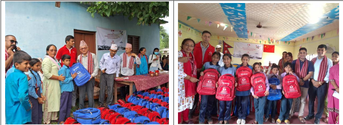
工作人员给学生发放爱心包裹

项目团队在尼泊尔的加德满都地区、Kanchanpur 地区、Kailali 地区发放 3562 个爱心包裹。