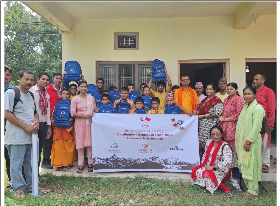
爱心包裹发放仪式