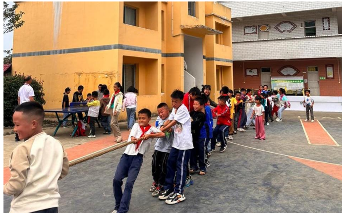
（月捐人与学生一起拔河）

第三季度，加油未来项目为 11451 名受益学生和捐赠人建立结对关系。9 月，加油未来项目组织了两场月捐人探访活动并进行网络直播，月捐人实地参观项目学校并参与加油课堂，成为了孩子们的好朋友。