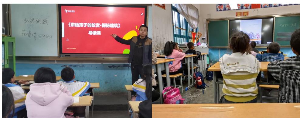
（孩子们上加油阅读课）

9月，56所项目学校共计开展566节加油阅读课。老师带领孩子们拓展阅读了《讲给孩子的故宫·探秘建筑》《我想去太空》等加油课程用书，设计了“如果你是图书管理员”等活动。不仅教会了学生如何高效阅读，而且还带领学生探索了语言世界的奥秘。精彩的故事和绘本使孩子们感受到了文字中蕴含的情感和思想，在书本中探索不同世界的同时也拓宽了眼界。