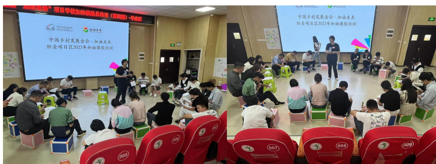
（加油社会情感培训图片）

9月下旬，加油社会情感课程培训在织金县开展，共计154名乡村教师参与。培训包含团队合作、沟通技巧和冲突解决方法等内容，帮助加油课老师更有效地引导学生解决社会情感问题、建立积极人际关系以及培养积极的价值观和社会责任感。