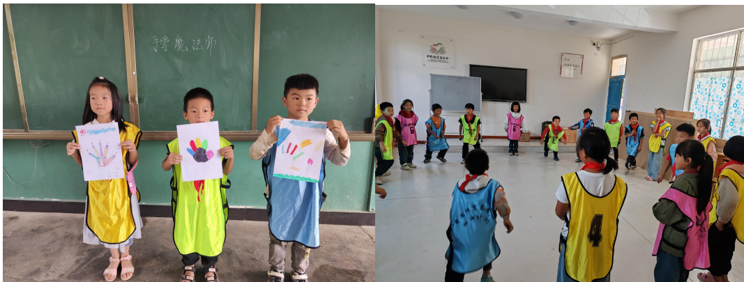
(孩子们上加油社会情感课)

9月,183所项目学校共计开展1937节加油社会情感课。老师们为孩子们设计了“飞盘运球”“我是谁?”“我的手掌”“加油合约”等一系列生动有趣的加油社会情感课程,为年轻心灵的成长添砖加瓦;孩子们在课堂中开启了发现自我的旅程,提升了耐挫力,学会了如何应对生活中的挑战。