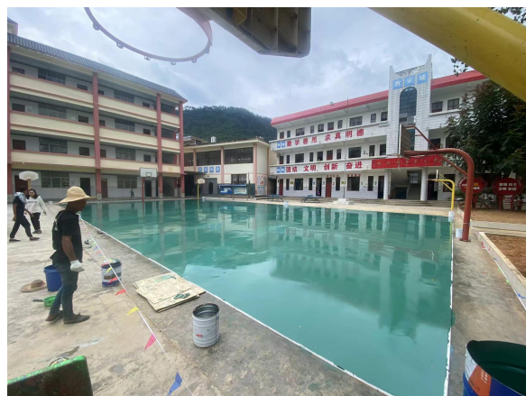
(运动天地修建图片)