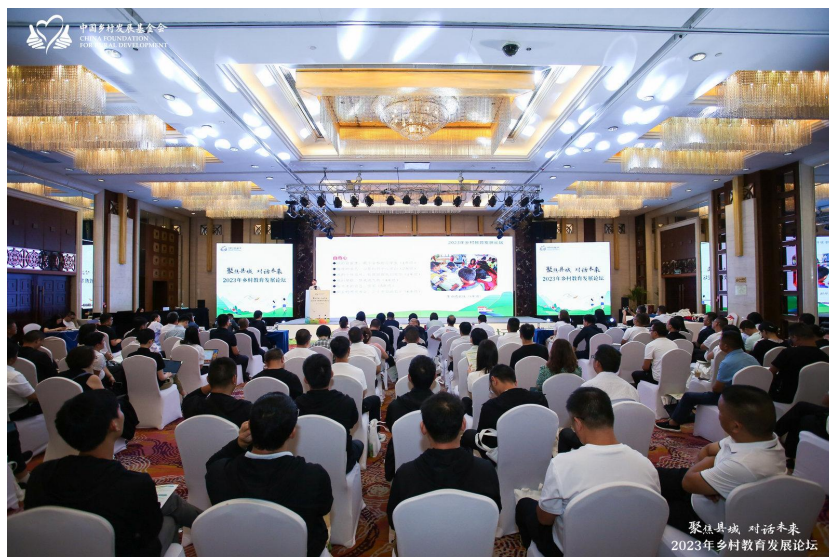
(乡村教育发展论坛现场)

8月18日，以“聚焦县域，对话未来”为主题的乡村教育发展论坛在北京举行，会议发布了乡村教育发展相关报告，会泽县、织金县中心小学及项目学校校长参与了教师队伍建设、学生发展等县域教育发展议题的交流讨论。