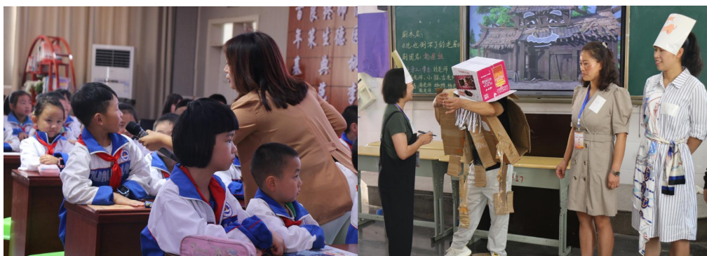
（赫章县加油阅读培训现场）

9月，加油阅读课程培训分别在赫章县、印江县、会泽县开展，共计407名加油教师参与。培训围绕阅读课程设计理念、具体实施方式、班级读书会、教学要点和示范课展开，帮助参训教师了解加油阅读课程、学习掌握阅读教学技能，并为老师返校后所开展的阅读课程增加专业性和趣味性。