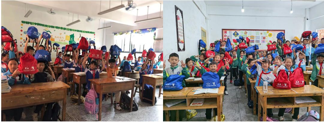
（学生们收到加油包）