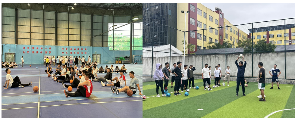
（广南县加油未来运动课程培训现场）

9月，加油运动课程培训分别在广南县、印江县、青龙县和正安县开展，共计341名加油教师参与。培训内容包括常规组织课程、专项技能主题教学、体能训练等，帮助参训教师规范使用器材、丰富教学内容、拓展启发教学设计等。