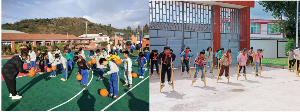
（孩子们上加油运动课）