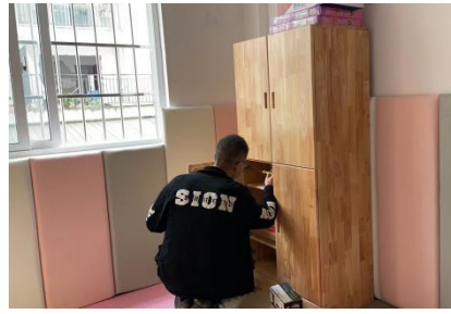
左图：婺源县太白镇儿童早期发展活动中心硬装隔断