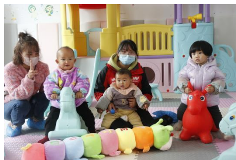
左图：婺源县太白镇儿童早期发展活动中心内景