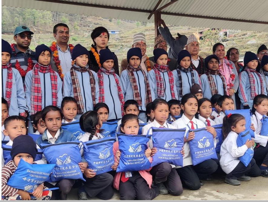
爱心包裹发放仪式