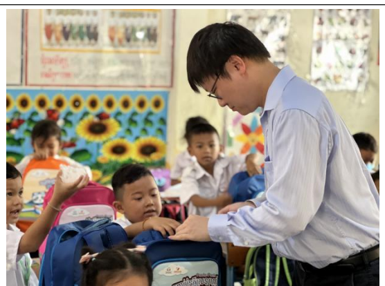
给当地小学生发放爱心包裹