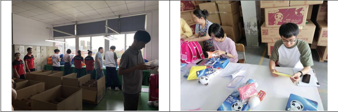
工作人员对运往各个国别的包裹进行查验