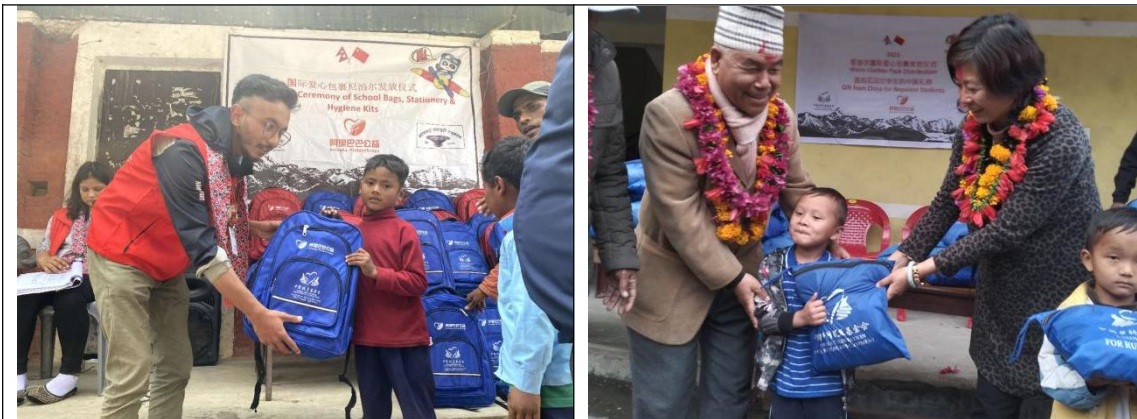
工作人员给学生发放爱心包裹

项目团队在尼泊尔的 Morang、Dang、Nawalpur、Baglung、Lalitpur、Bardiy、Dhading、Syangja、Parbat、Lumjung、Gulmi、Chitwan 和 Banke 等十三个地区进行包裹发放，发放过程中项目人员还对受益学校师生进行了培训。