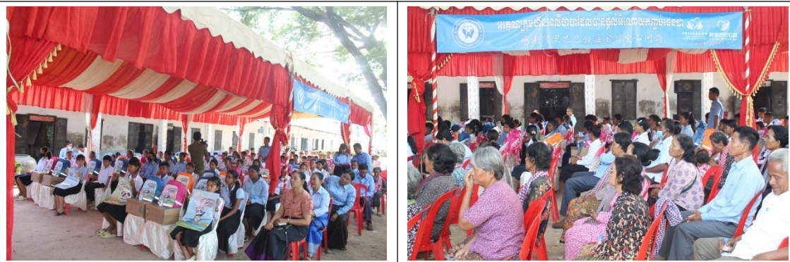
爱心包裹发放仪式

项目团队在柬埔寨金边省、茶胶省、磅同省、磅士碑省、马德望省、暹粒省举办两场爱心包裹发放仪式、六场爱心包裹培训会，完成了在这六个省的包裹发放工作。