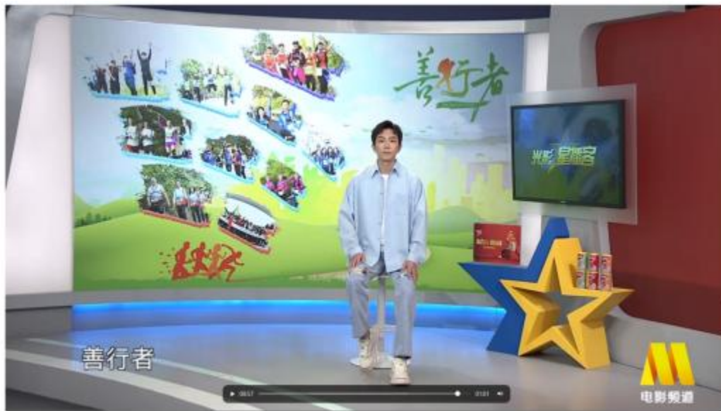
（电影频道上刊视频）