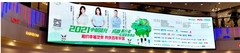
(上海商圈巨幕大屏)