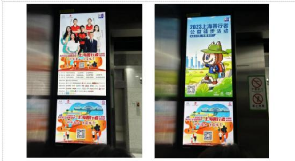
(电梯楼宇广告大屏)