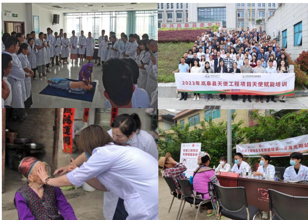
天使赋能培训及义诊活动照片

2023 年第二季度，完成岚皋县、洛宁县、元阳县、渭源县、黄平县 5 县 663 名乡村医生赋能培训及 10 场义诊活动，推进雷山县、会宁县、泽库县、凤凰县、治多县、祁连县等新增项目县天使赋能培训开展；