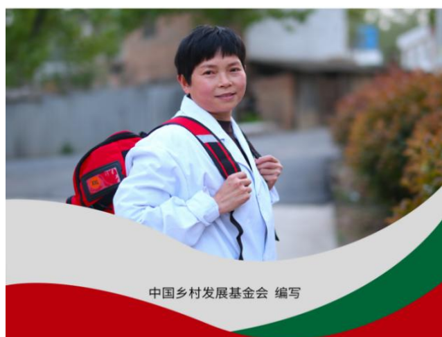
天使工程项目健康卫生手册封面