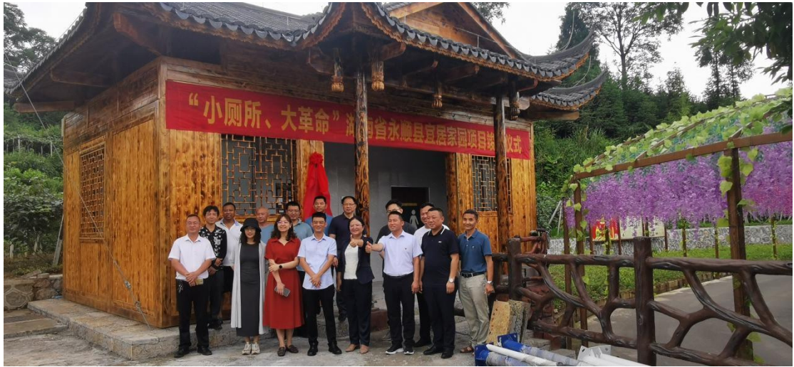
图为永顺县竣工仪式现场