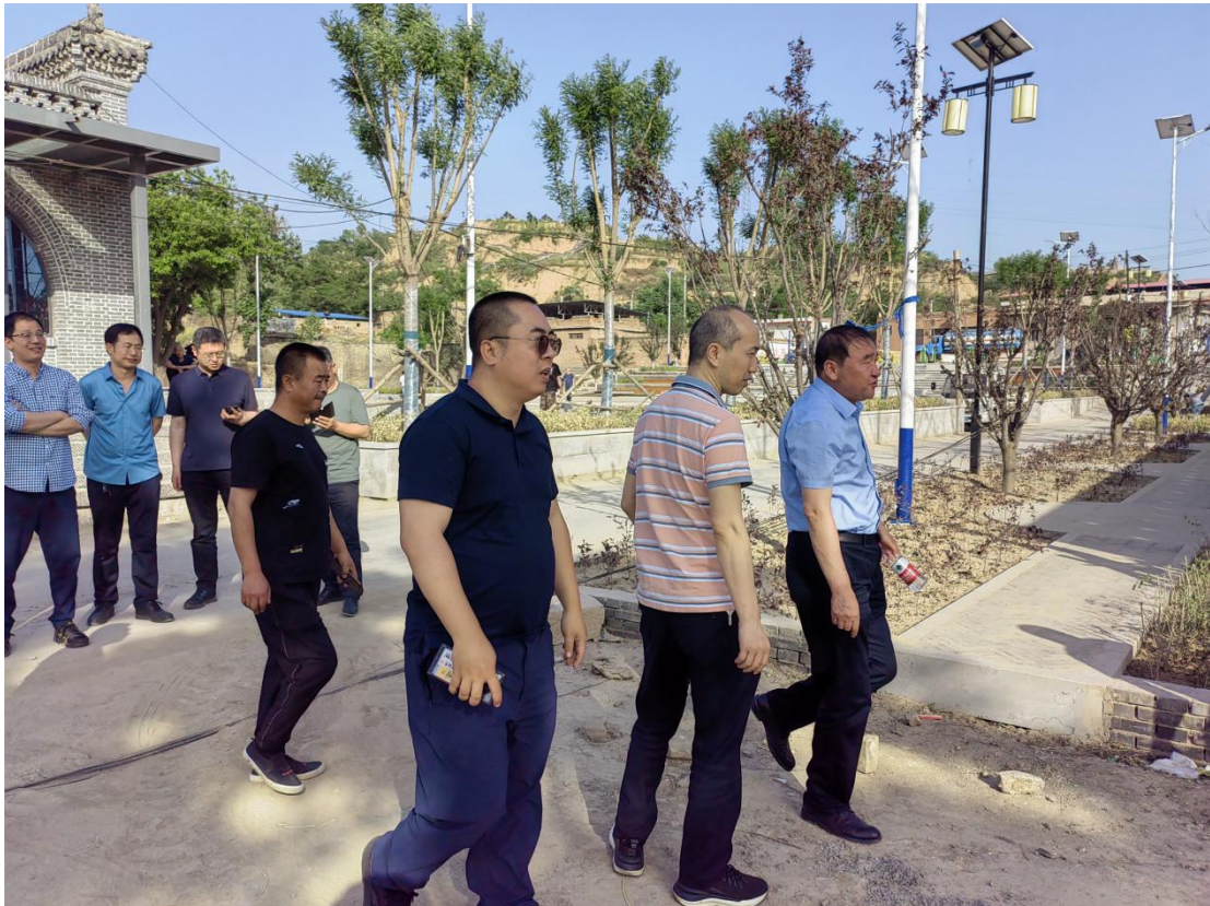
图为汾西县实地勘察现场

4月-5月，宜居家园项目团队携手专家团队共同前往汾西县下团柏村开展实地勘察工作，通过与项目县多次讨论，确定在厕所改造、污水处理、生活垃圾、村容村貌提升等方面开展建设工作，并启动《实施方案》编制工作。6月，结合《实施方案》召开项目讨论会，明确项目时间节点、技术示范性与建设要求。