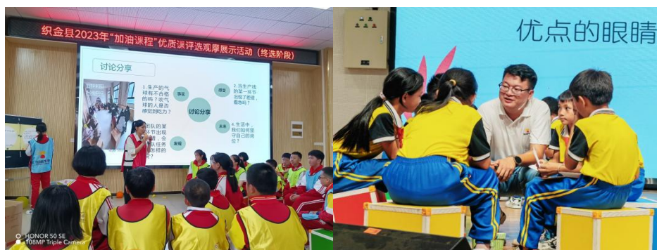
(优质课评选观摩展示活动现场)