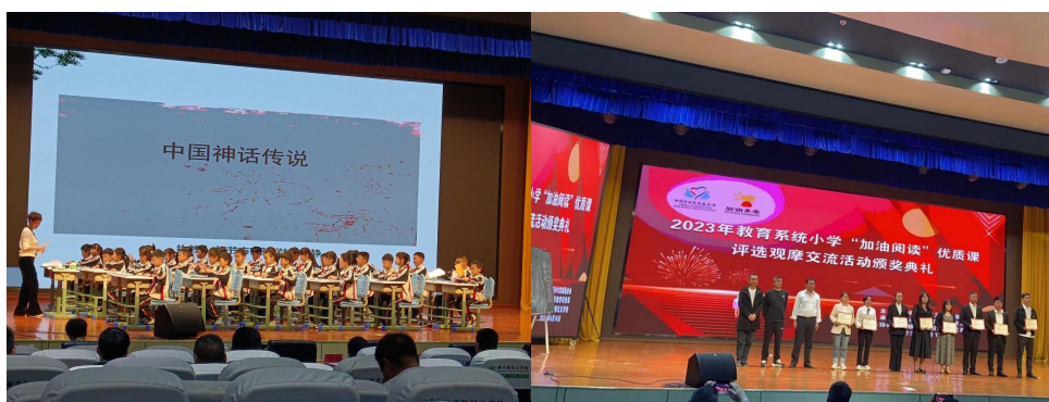
(赫章县加油阅读课观摩交流活动现场)

赫章县、印江县组织了加油阅读优质课交流活动，共计225名教师参加。会上，专家向县域教师们展示了阅读公开课，课程注重养成学生阅读兴趣和习惯，巧妙地为学生搭起了一座阅读的桥梁，引导学生慢慢掌握阅读方法，进而激发学生的阅读兴趣。