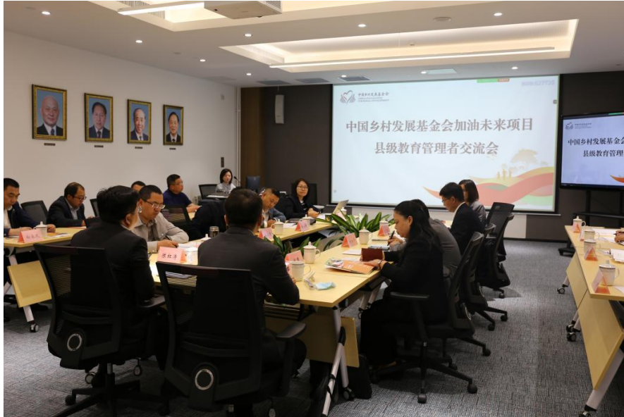
(县级管理者交流会现场)