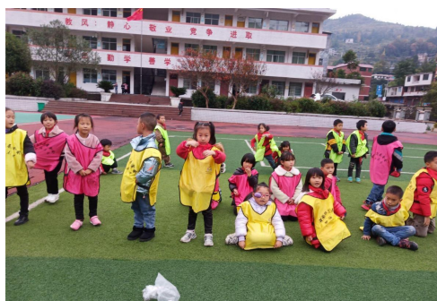
(孩子们上加油运动课)

加油运动课程在会泽、镇雄、青龙等项目县开展。老师参加培训后，为孩子们设计了生动有趣的运动课程，如篮球、足球、排球、跑步等。让孩子们在运动中享受自由、快乐和挑战，帮助孩子们增强了体质、提高协调能力，让他们在团队协作和竞技中感受到友谊和成功的喜悦。通过运动课程，孩子们能够更好地了解自己的身体、挑战自己的极限、培养自信心和勇气，孩子们将会拥有更加健康、快乐和更有意义的童年并得到成长。