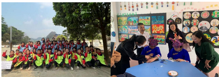
（专家们进行入校指导）

了入校指导活动，共 45 名专家们走进项目区 81 个乡镇的项目学校观摩学校“加油未来”相关课程的开展情况，累计听取 179 所项目校办学基本情况、面临的问题、困惑以及学校下一步发展规划。在交流互动环节，专家们就学校面临的问题详尽解答，对各校的特色课程给予充分肯定并给出了建设性指导建议，并针对各类问题开展专题讲座，答疑解惑。