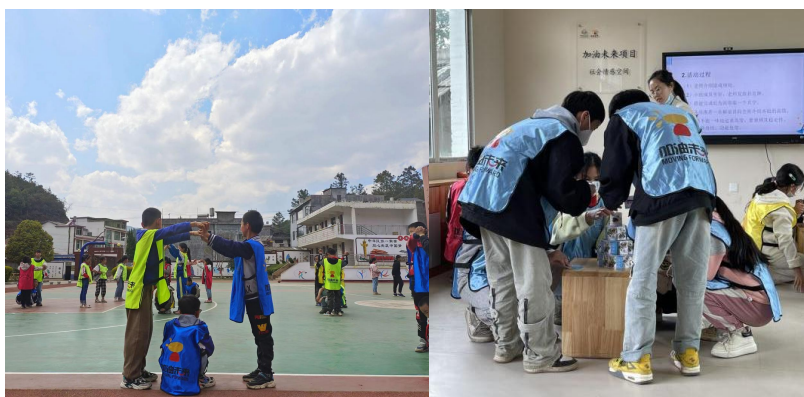
（孩子们上加油社会情感课）

加油社会情感课程在广南、织金等项目县开展。一系列加油社会情感课程，锻炼了孩子们团结协作能力、合作能力、耐挫力等等，体验成功与失败。培养他们越挫越勇，一往无前的精神。