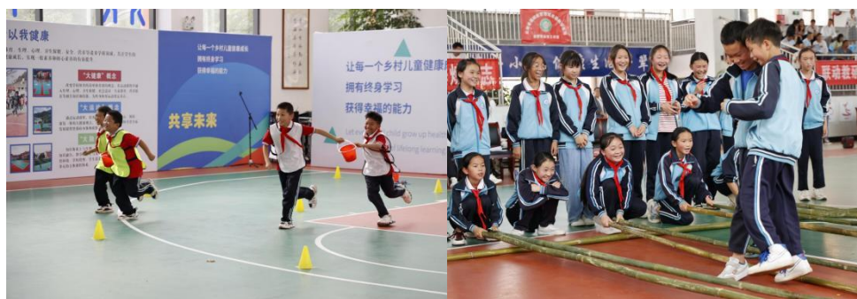
（学生正在参与体育教学示范课）

程专家对示范课进行详细点评，并就《体操》《民族传统体育》两个主题课程进行现场示范。此次观摩活动对全县体育教师教育教学理念的转变、专业水平的提高起到了示范引领作用，让体育课堂真正活起来、趣起来，让孩子们爱上加油运动课。