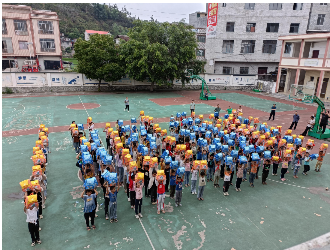
凤县长洲镇百乐小学爱心包裹发放现场