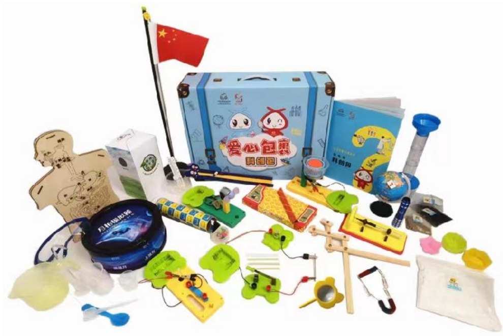
(图为学生型科创包，因厂家和生产批次不同，包裹颜色略有不同)