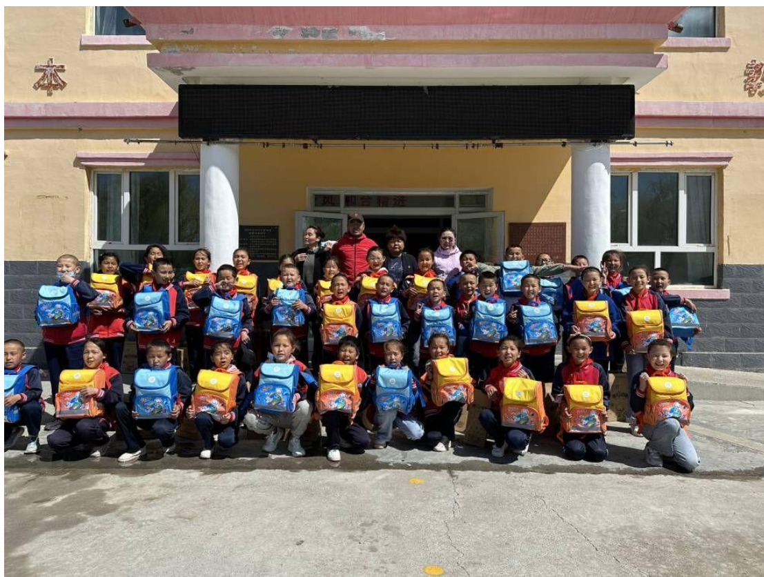
吉木乃县别斯铁热克牧业寄宿学校爱心包裹发放现场