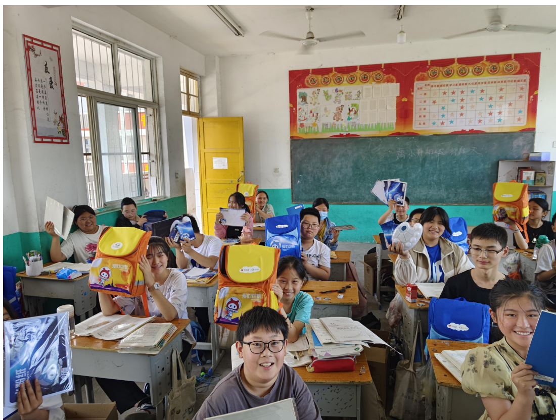
范县王楼镇王楼小学爱心包裹发放现场