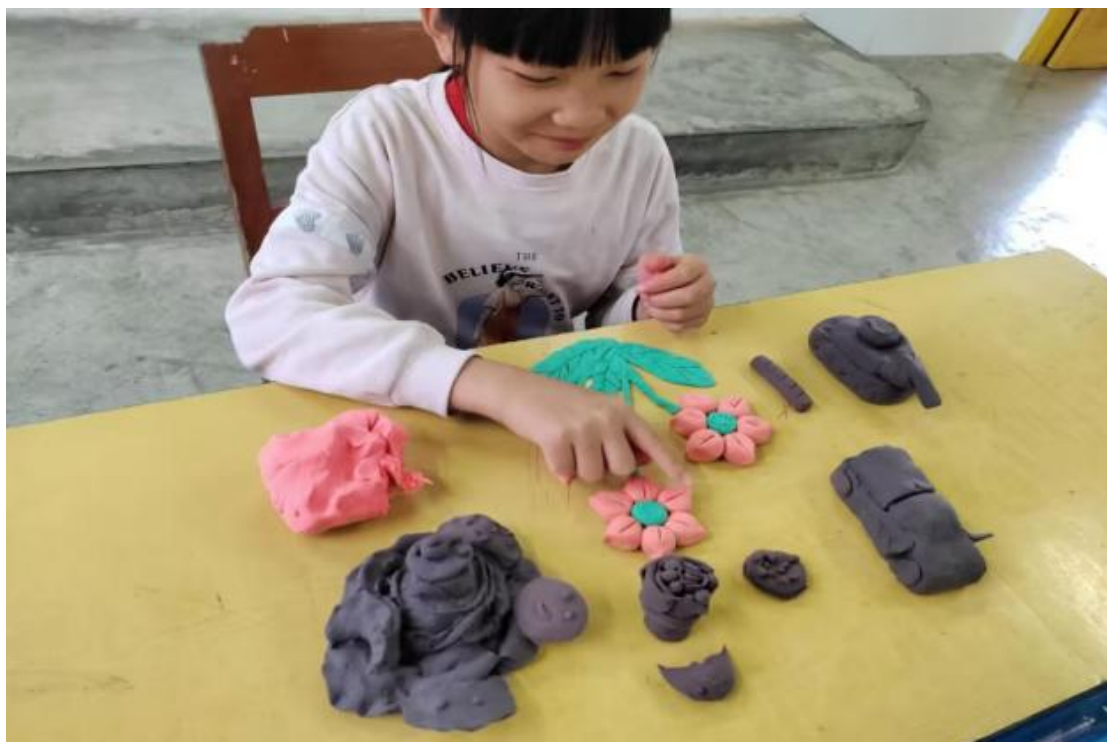
富宁县小里达小学的小茨正在用橡皮泥创作