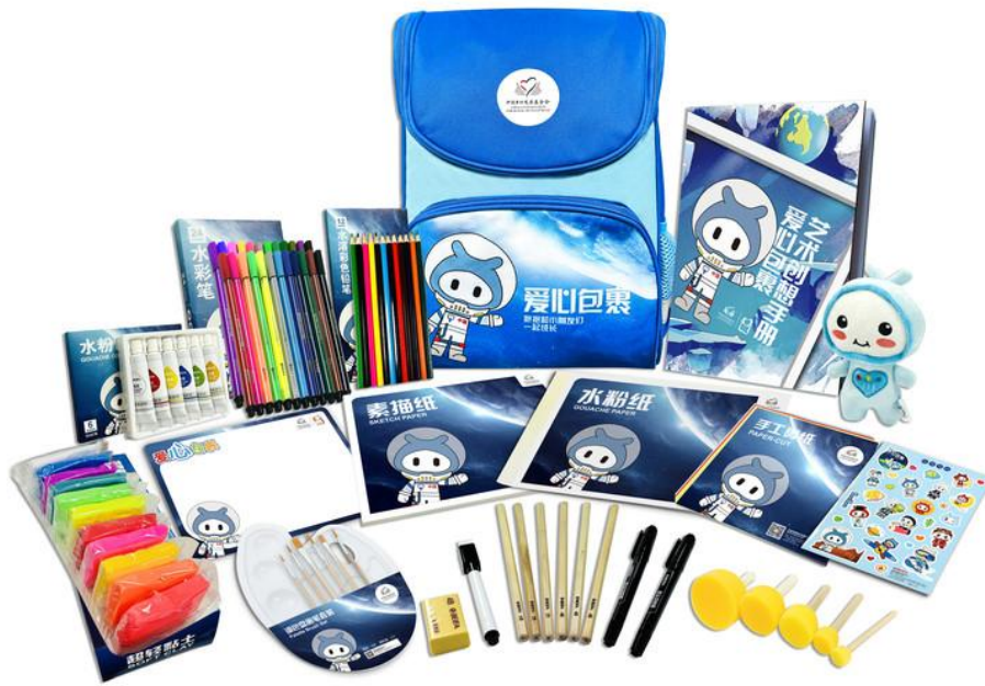
(图为学生型美术包，因厂家和生产批次不同，包裹颜色略有不同)