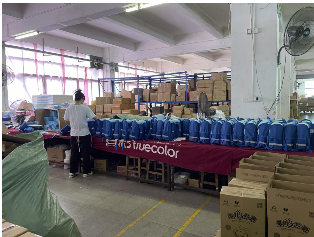
爱心包裹验货现场