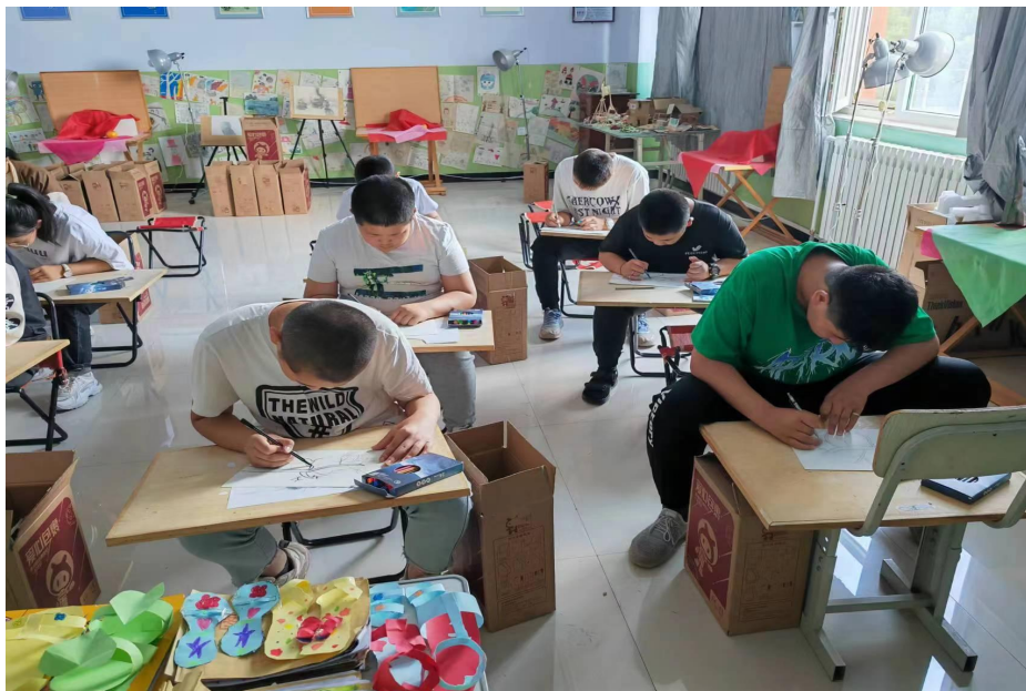
怀安县王虎屯中心学校的同学们正在上美术课

我们将好好地使用好爱心包裹里的每一份学习用品，画好每一幅画，写好每一个字，我们一定不辜负远方的爱心朋友对我们的厚望，好好学习，长大以后为祖国、为家乡贡献自己的一份力量。同时我们也祝福天下所有的好心人身体健康、工作学习顺利、合家欢乐。