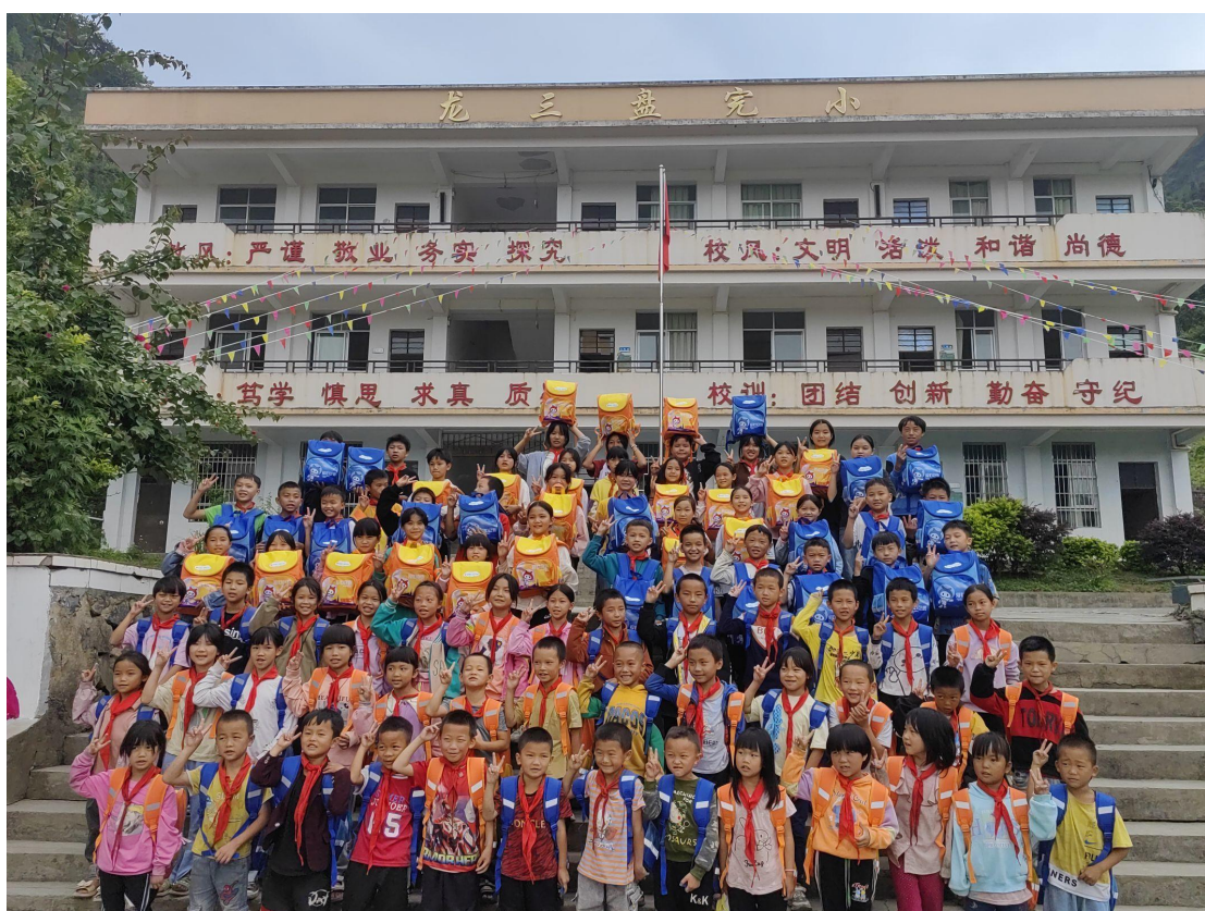
富宁县龙三盘小学爱心包裹发放现场