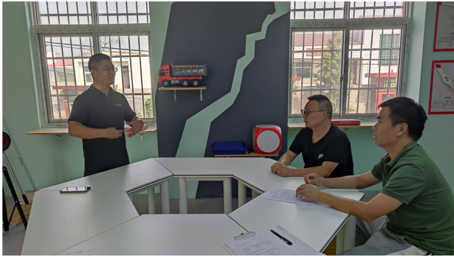
洛阳市偃师区减灾教室课程培训及督导机构开展入校单独指导