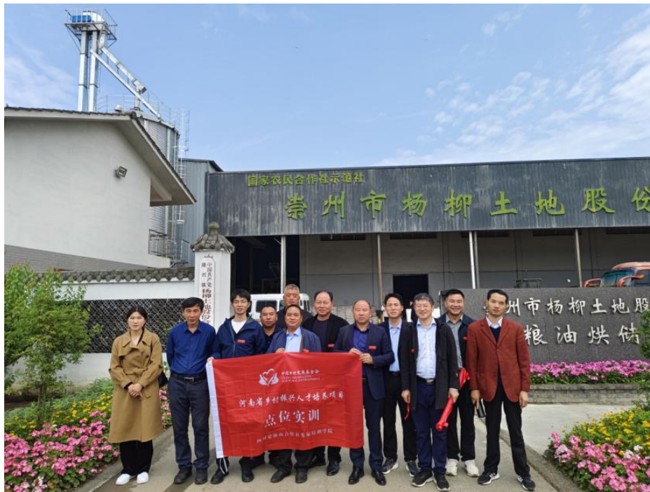
新农人项目第二季度点位培训