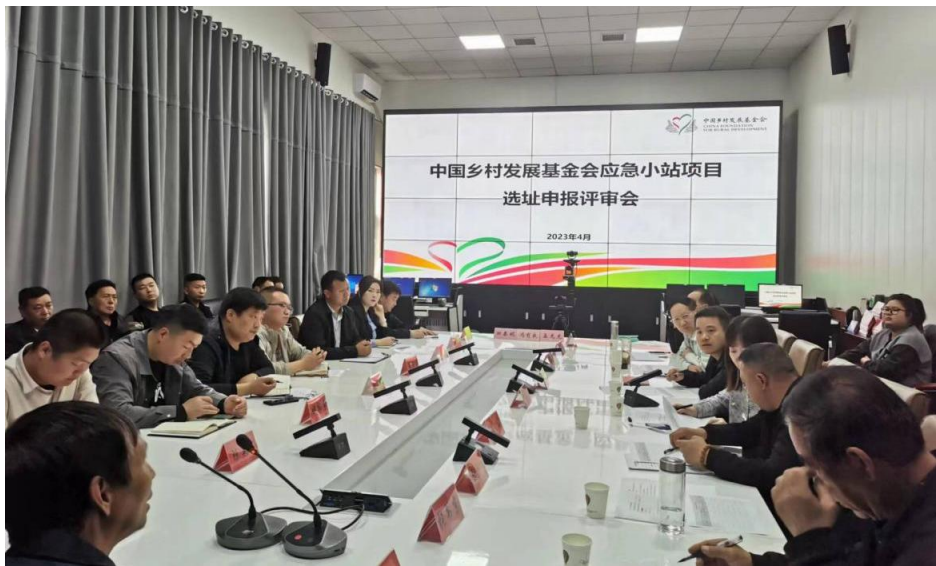
洛宁县应急小站项目选址评审会现场

2023年4月至6月，我会重建项目团队分别前往新乡市卫辉市、鹤壁市浚县、淇县开展应急小站一期项目物资入库验收工作。