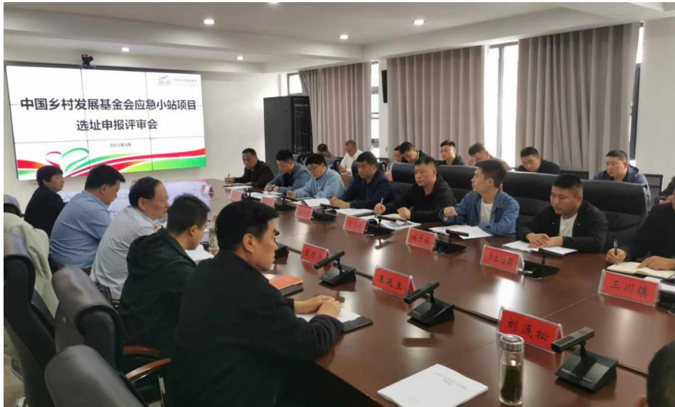
栾川县应急小站项目选址评审会现场