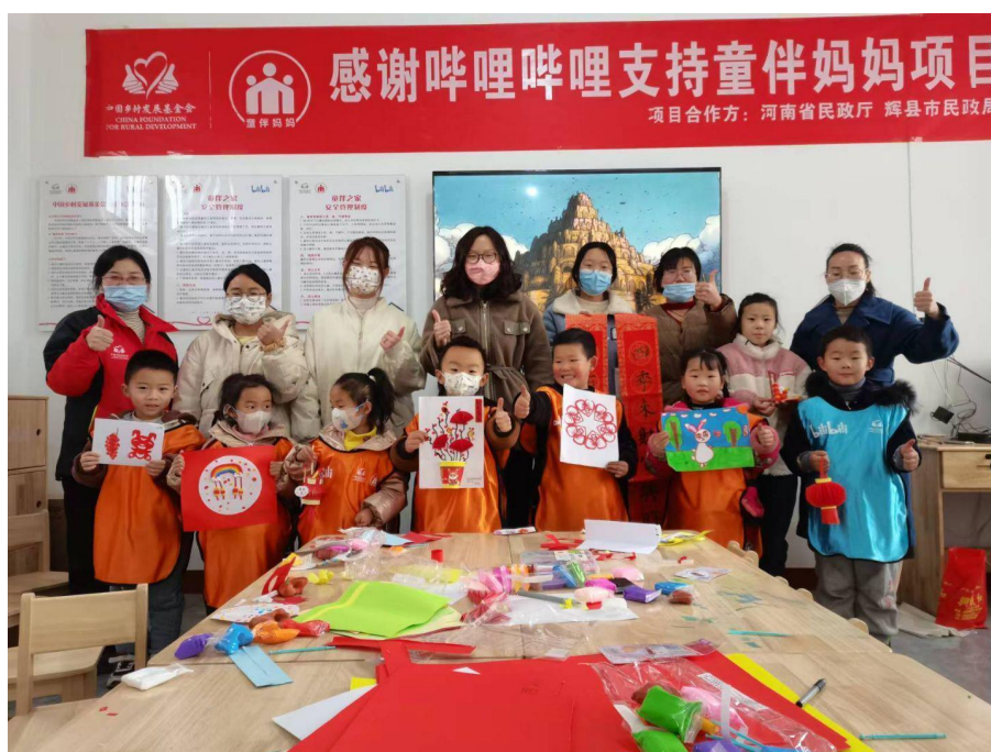
河南省辉县童伴之家创意手工主题活动

2023年第二季度，在河南省2市2县30个项目村童伴之家累计开展主题活动1100余场，童伴妈妈入户走访3400余户。