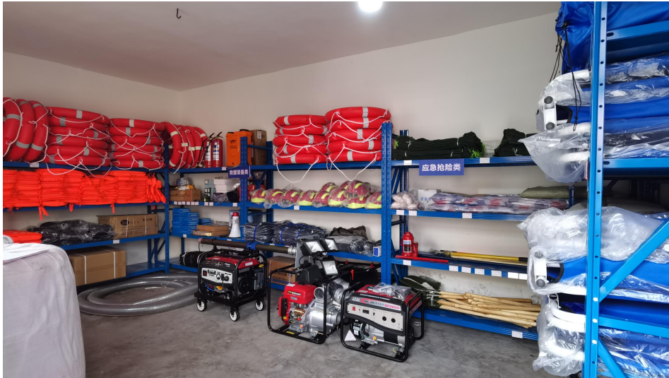
浚县应急小站项目物资入库验收