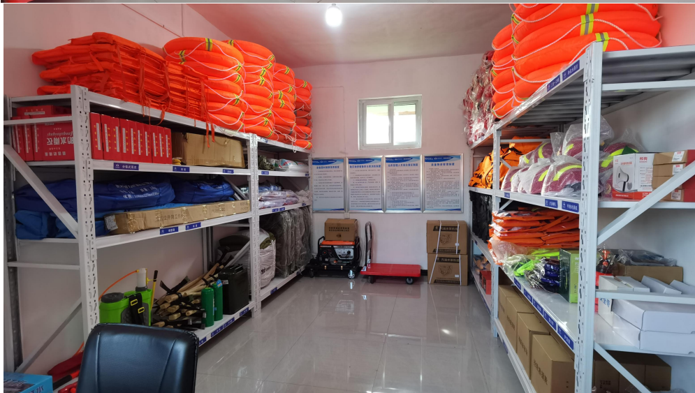
淇县应急小站项目物资入库验收