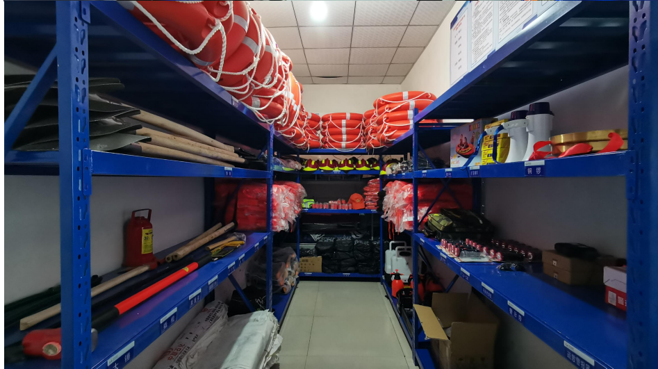
卫辉市应急小站项目物资入库验收