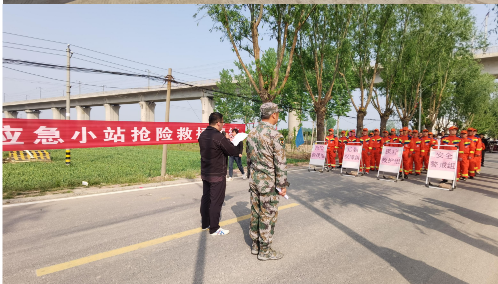
卫辉市应急小站装备物资实操培训及防汛演练

2、2023年6月30日，上八里镇杨和寺村组织村组干部，党员、村民代表及部分村民到卫辉市唐庄镇石屏村学习观摩桃树种植管理及销售，下一步，结合本村实际情况，与会人员各自发表了意见和建议，给今后我村的产业发展和村民增收致富奠定了基础。在此，再次感谢中国发展乡村基金会和