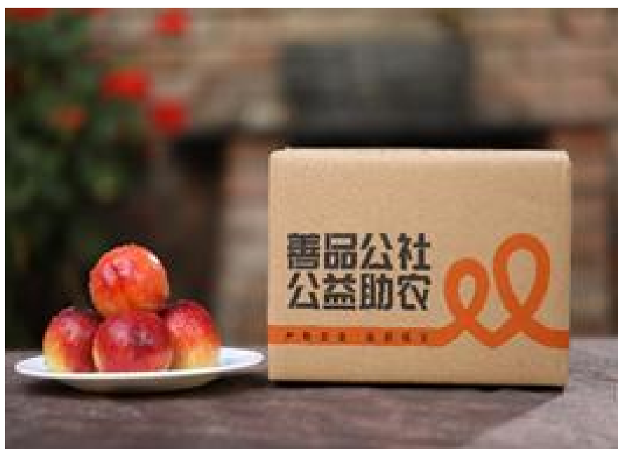
辉县鲜桃电商试水