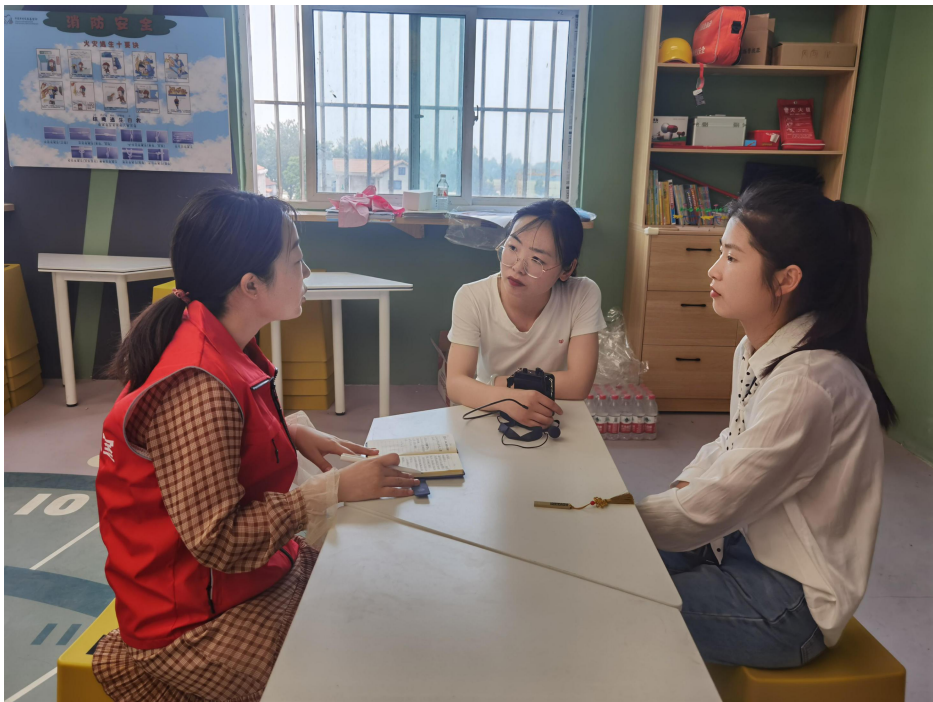
滑县减灾教室课程培训及督导机构开展入校单独督导