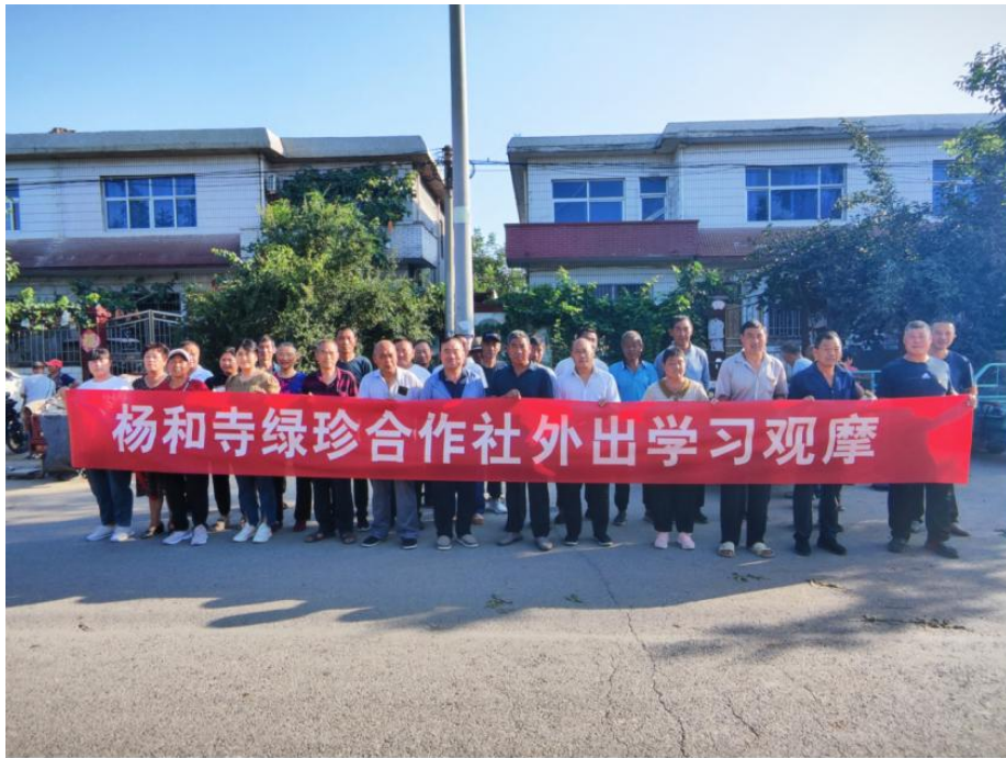
杨和寺绿珍合作社外出学习观摩