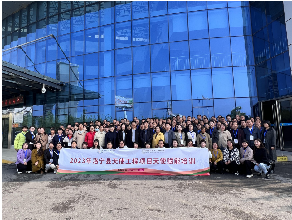
洛宁县天使工程项目天使赋能培训