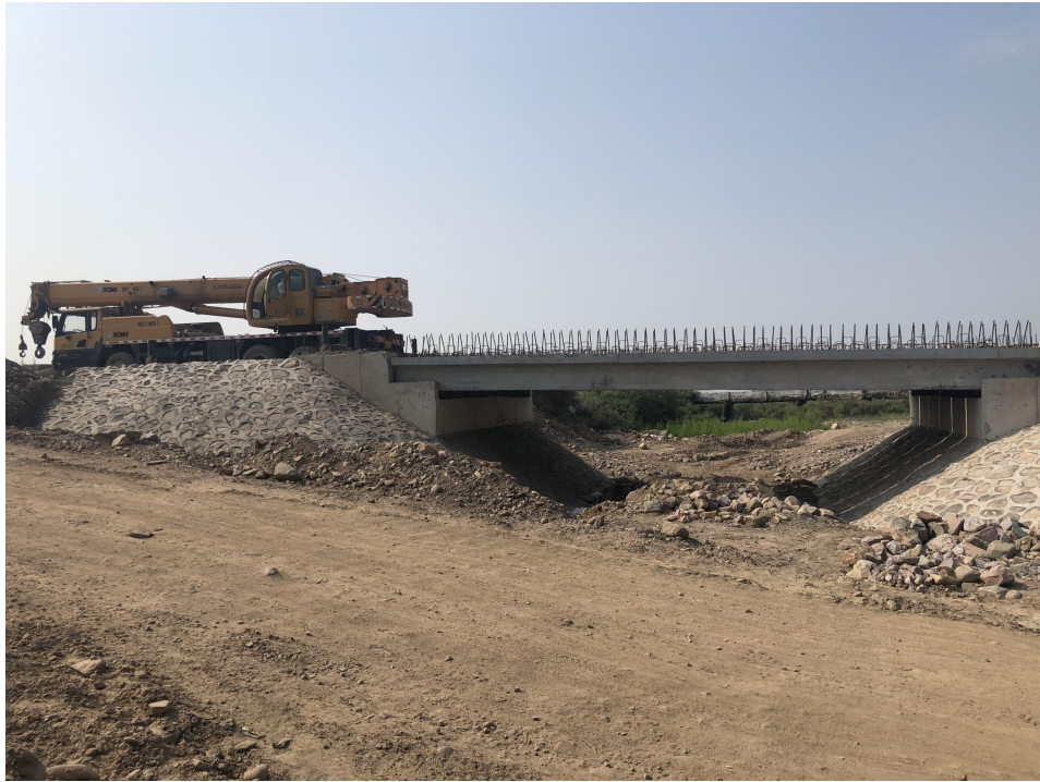
辉县市上八里镇何庄村小桥建设照片