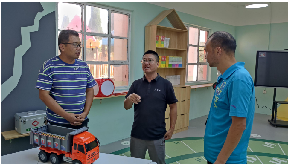
洛阳市偃师区减灾教室课程培训及督导机构开展入校单独指导

3月-6月,10家课程培训及督导执行机构在10个区县开展完成项目学校的四次单独指导、两次单独督导工作。