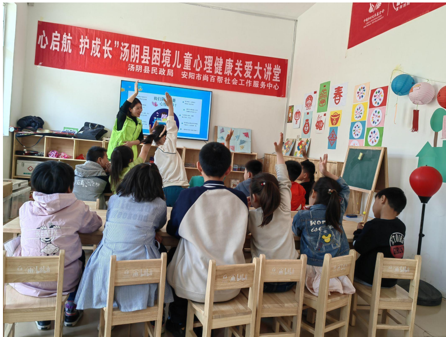
河南省汤阴县童伴之家心理健康讲座主题活动