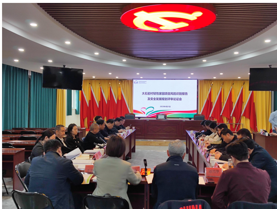
研究成果评审论证会现场照片

4月21日，我会项目组联合项目合作团队前往鹤壁市淇县大石岩村召开研究成果评审论证会，邀请鹤壁市及项目推进工作领导小组成员、行业专家对项目研究成果进行评审和意见征询。目前，已完成大石岩村风险识别及韧性评估及大石岩村安全发展规划。6月28日至30日，我会项目组与中国水利水电科学研究院合作推进应急避难场所的可研工作，完成实地调研勘测。