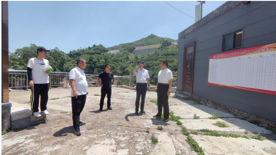
大石岩村应急避难场所可研实地走访照片