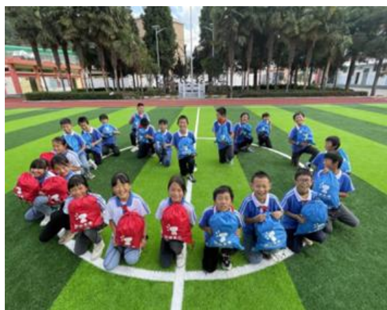
学生开心地展示加油包