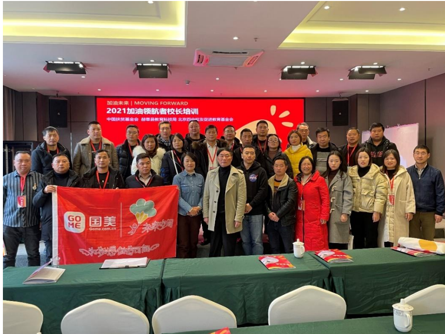
校长培训现场合影

2022 年，项目组织 10 所项目学校 20 位校长前往贵州毕节参加跟岗实践培训，在赫章三小开展加油课程优质课评比活动。截至 2022 年底，项目已完成所有工作顺利结项。