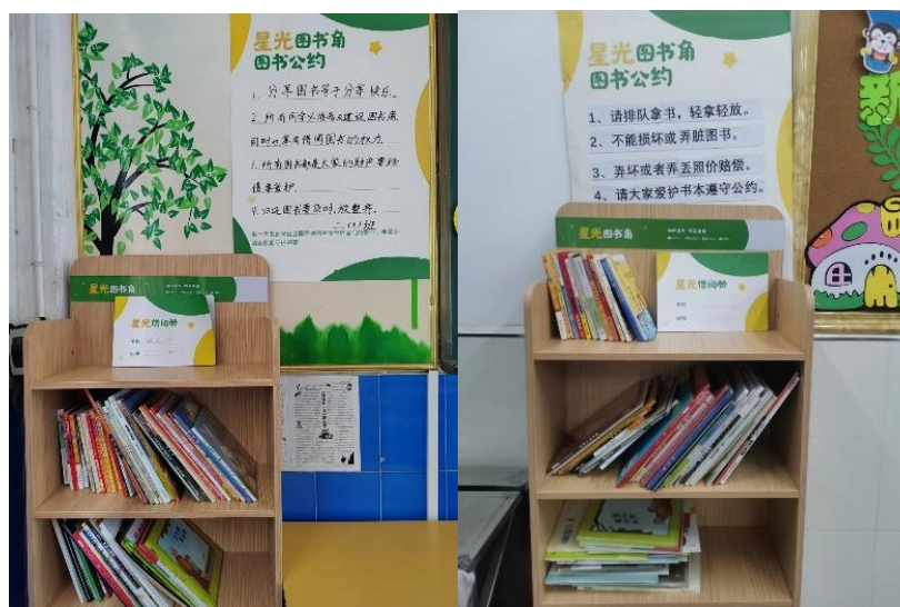
建成的星光图书角

“知识星光公益计划”由微信支付、腾讯公益联合中国乡村发展基金会等公益机构共同发起，旨在通过图书捐赠、空间搭建、教师培训等方式，改变乡村小学生阅读能力滞后、阅读水平低下的问题，并通过以点带面的方式，提升项目区学生整体阅读水平发展。截至 2022 年底，由中国乡村发展基金会执行的知识星光项目已为云南镇雄、会泽，贵州赫章 3 县 50 所学校建设星光图书室并投入使用，为贵州正安、河南太康、陕西白河、云南广南 4 县 192 所学校建成图书角，为乡村学校送去 20 万册图书并为学校教师提供专业培训，极大地改善了项目地区阅读环境。