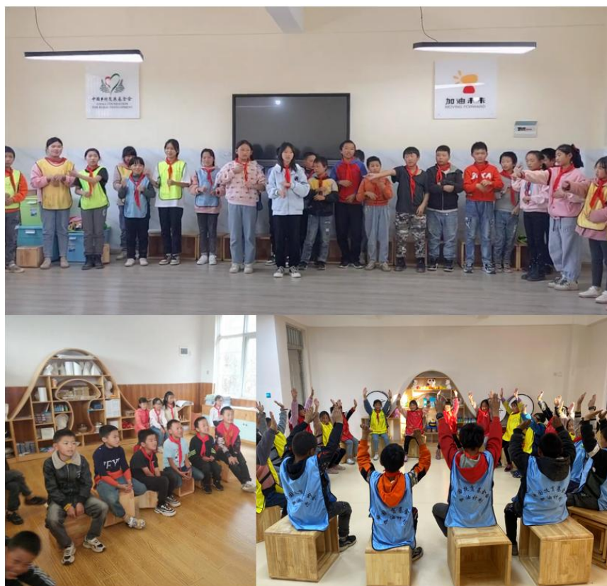
学生上社会情感课