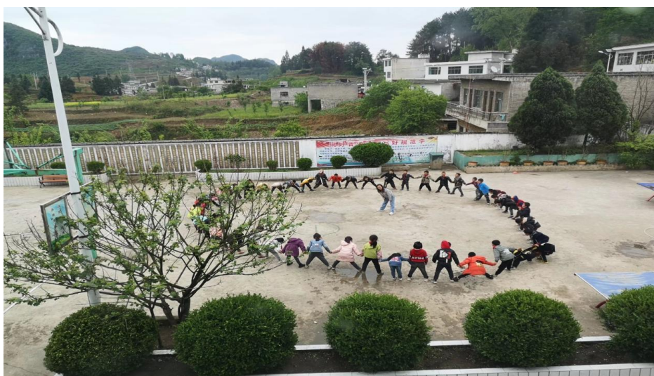
织金杨柳小学在上社会情感课

己与他人的关系、自己与团体的关系，从而培养良好的生活适应和社会适应能力。活动不仅打破了学校与课堂的束缚，也鼓励学生走出自己的一方小天地去发现美、感受美、创造美，这也是加油社会情感课落入项目学校的课表后，在当地生根发芽最好的延伸和延续。