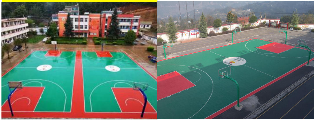
加油运动天地实景