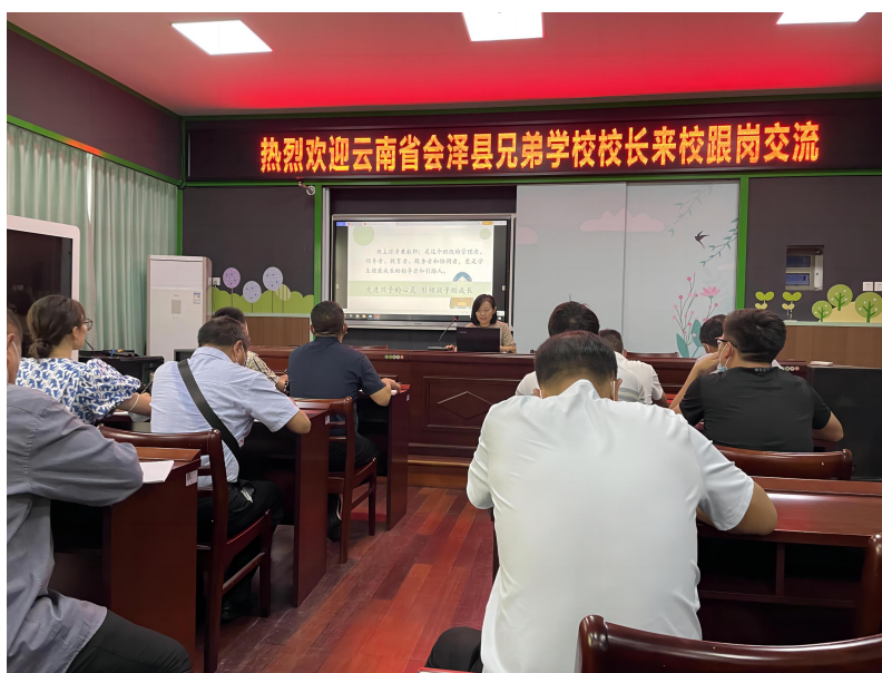
领航者跟岗校长们聆听专家讲课

2022 年，加油领航者组织会泽县项目区的 30 名校长分组前往浙江绍兴、湖南郴州、陕西西安的四所小学开展为期五天的跟岗学习。