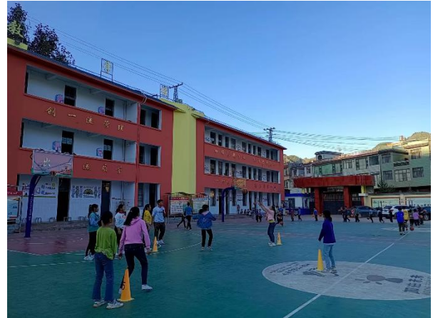
学生上加油运动课