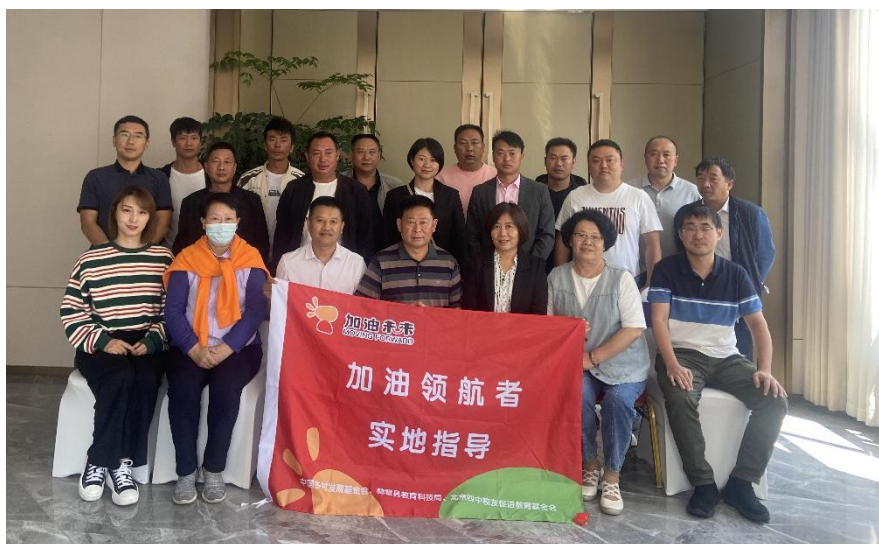
领航者实地指导合影

2022 年，加油未来项目组织开展了 2 次实地督导和师徒指导活动，邀请 8 名专家赴赫章县开展实地督导，29 名项目校校长参加；邀请 6 名专家开展师徒制指导活动，47 所项目校校长及骨干教师团队参会。