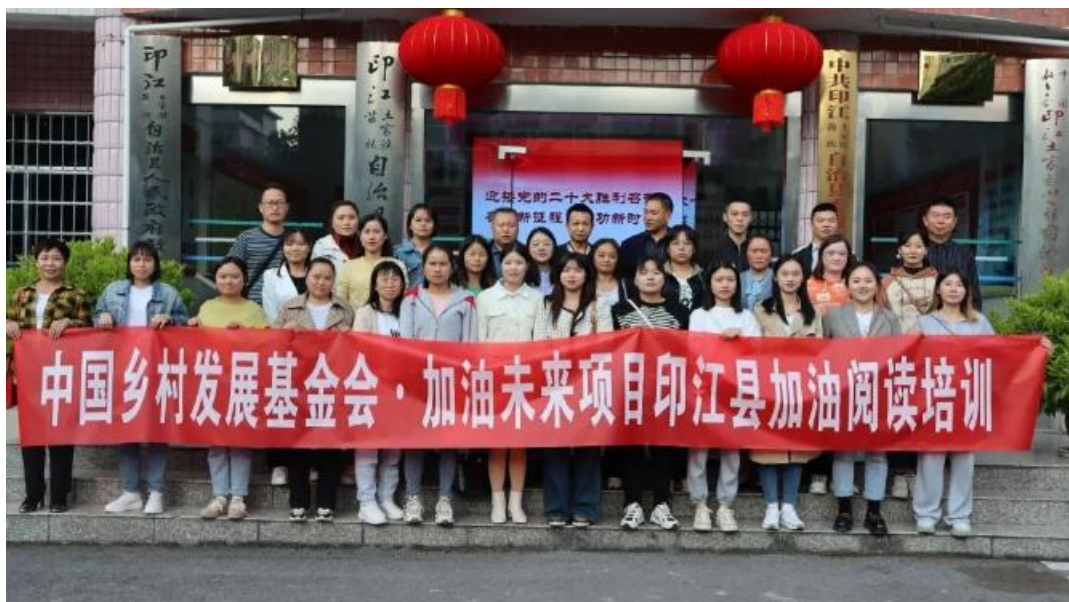
加油阅读培训参训教师合影