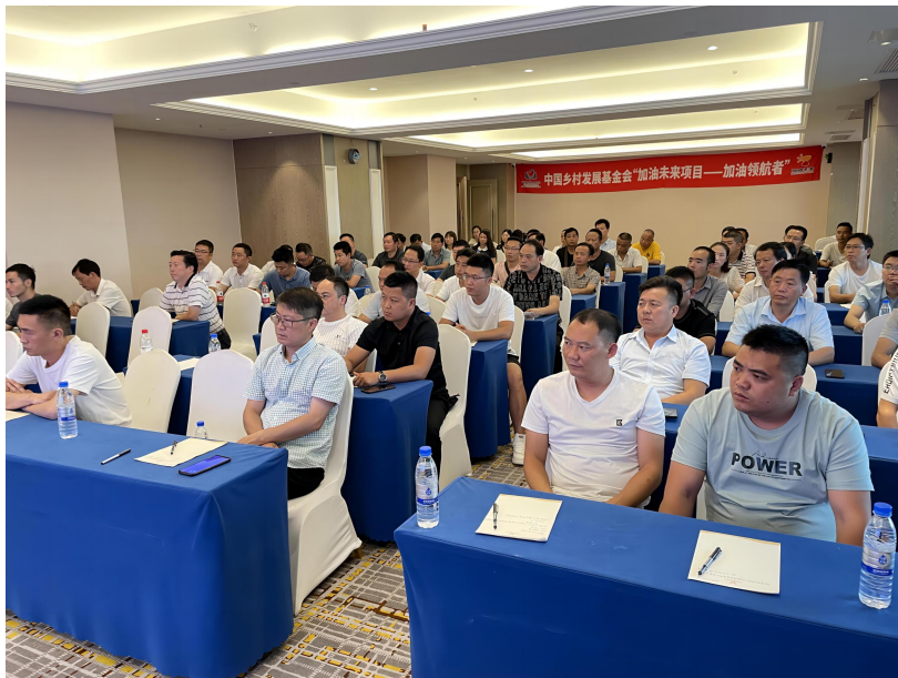
加油领航者培训现场