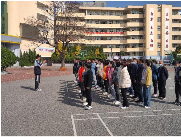
加油运动课培训现场