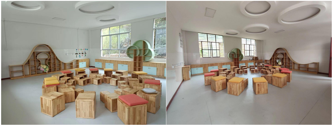
广南县社会情感空间修建过程