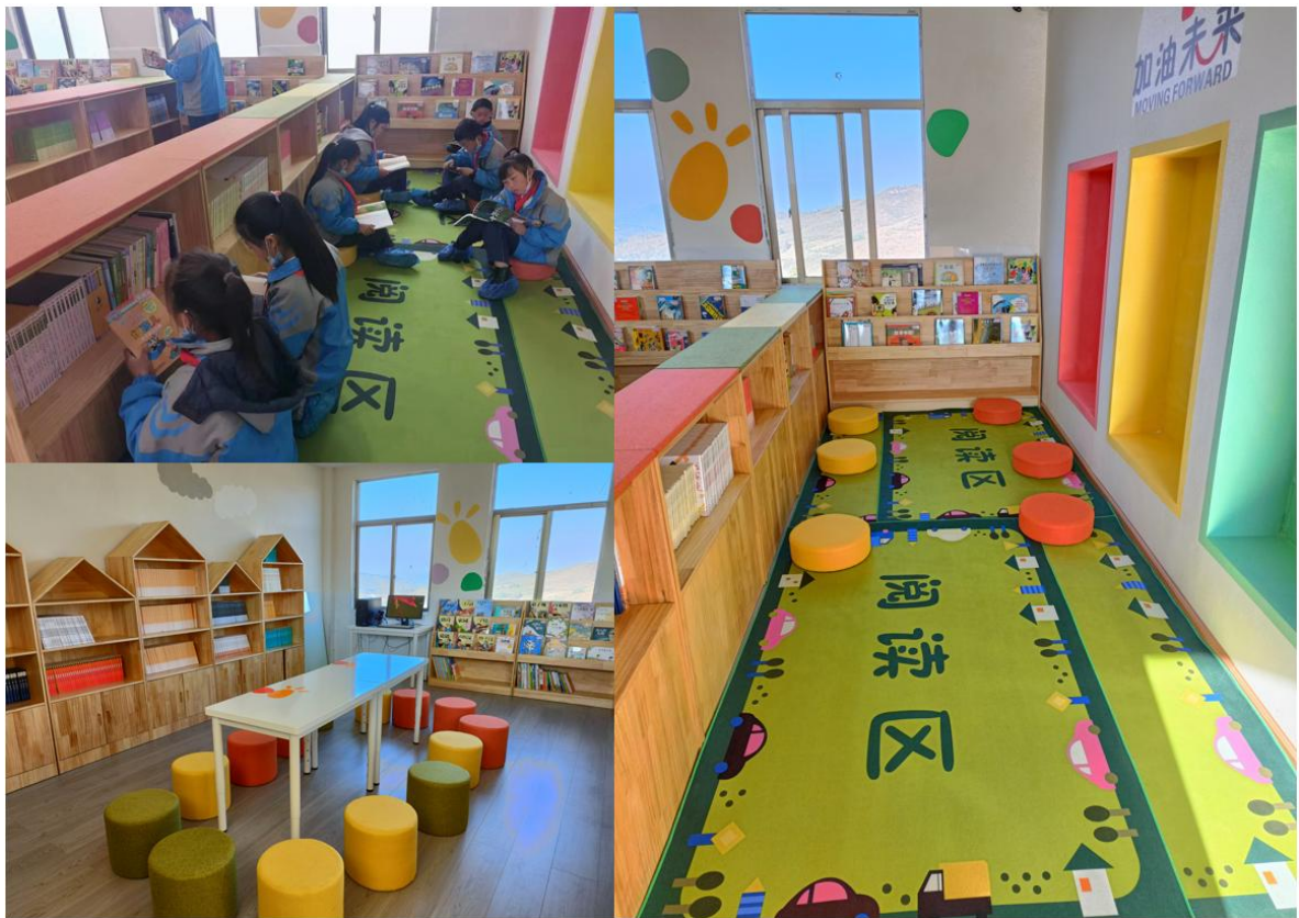
加油阅读空间实景图