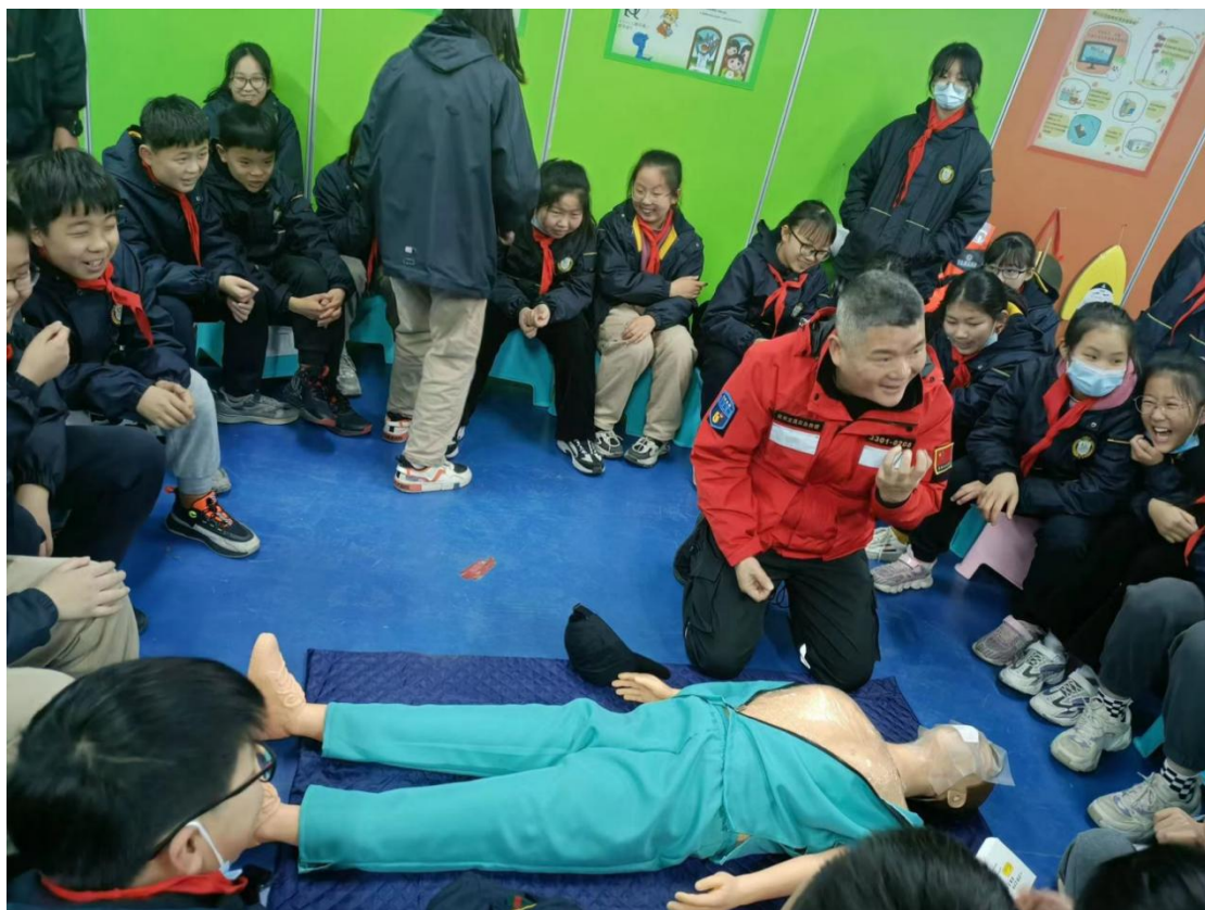
杭州市临平实验小学学生上课