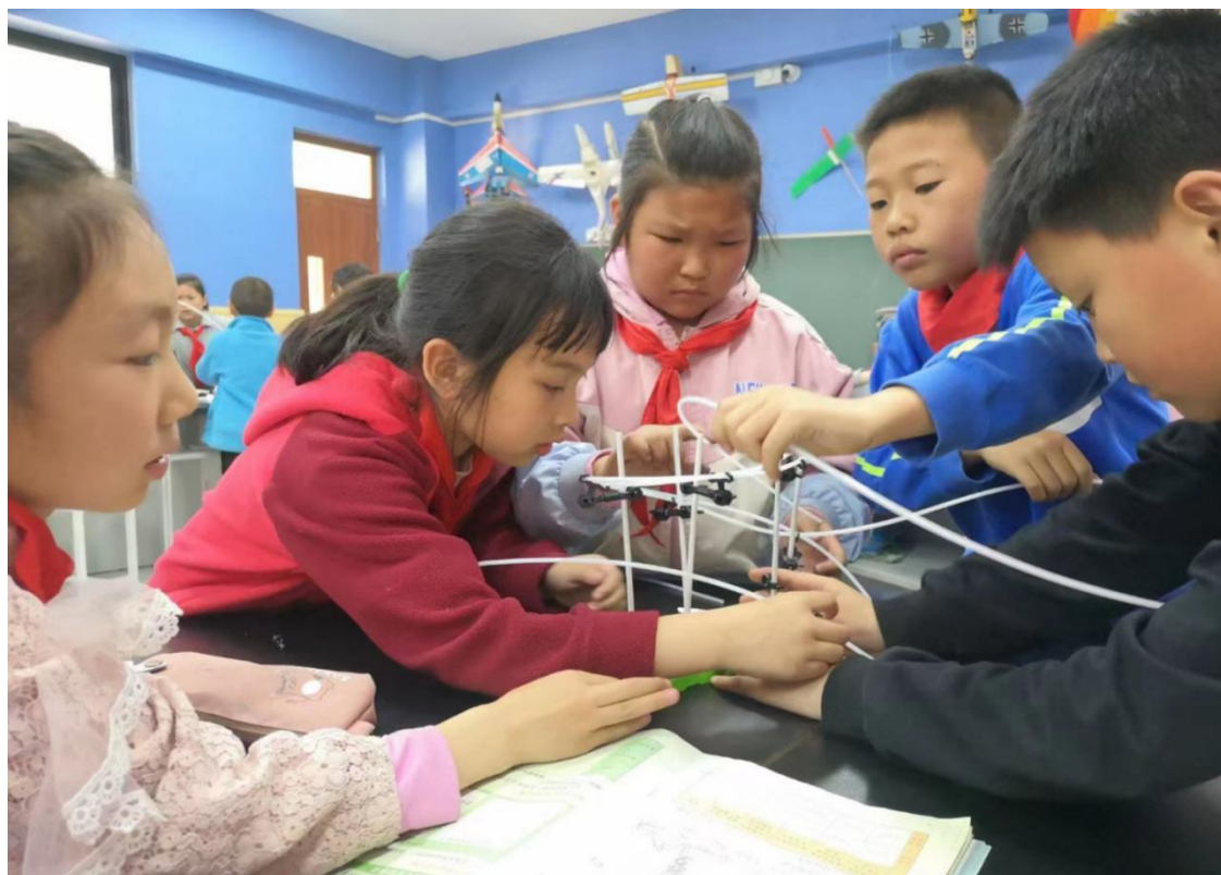
宝兴县实验小学学生上课

中国乡村发展基金会 CHINA FOUNDATION FOR RURAL DEVELOPMENT