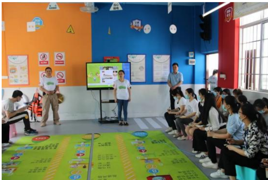
桂平市石咀镇中心小学教师培训