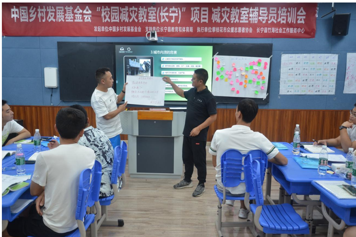
长宁县校园减灾教室项目教师培训

中国乡村发展基金会 CHINA FOUNDATION FOR RURAL DEVELOPMENT