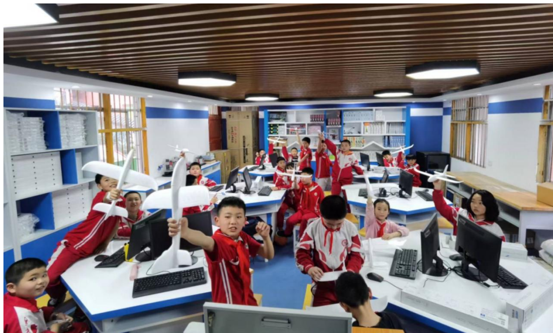
沿河县民族小学学生上课