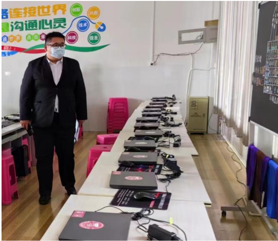
图：项目工作人员进行项目监测。