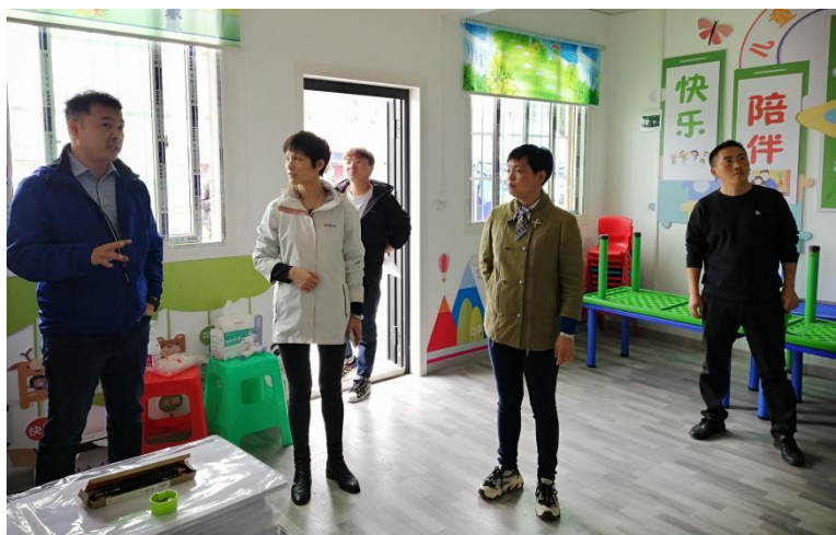
▲ 实地督导绥阳县儒溪村美育中心

美育师通过线上培训以及线上集中备课两个环节相扣，整体上掌握课程流程、重点内容，保证实际开课质量。