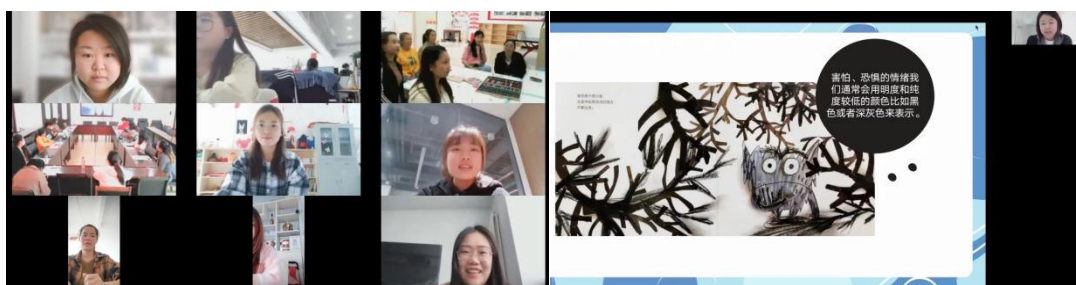
▲ 美育师接受线上培训

美育师通过线上培训以及线上集中备课两个环节相扣，整体上掌握课程流程、重点内容，保证实际开课质量。