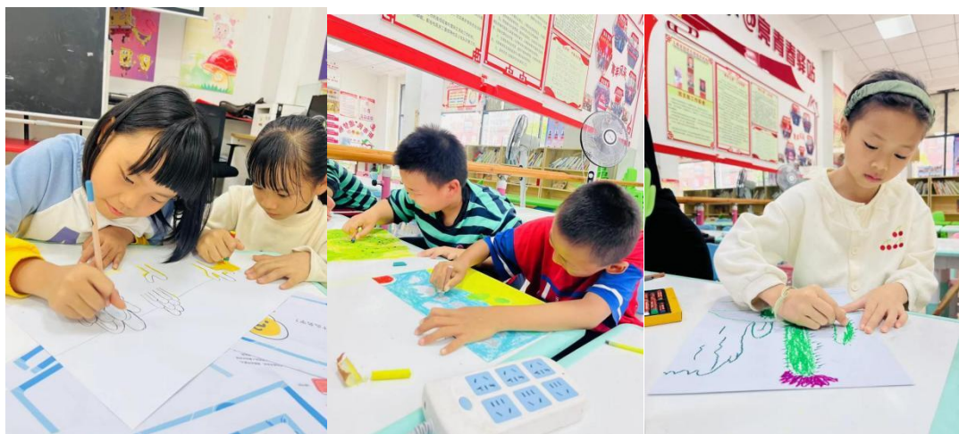
▲ 项目区孩子们沉浸在创作中