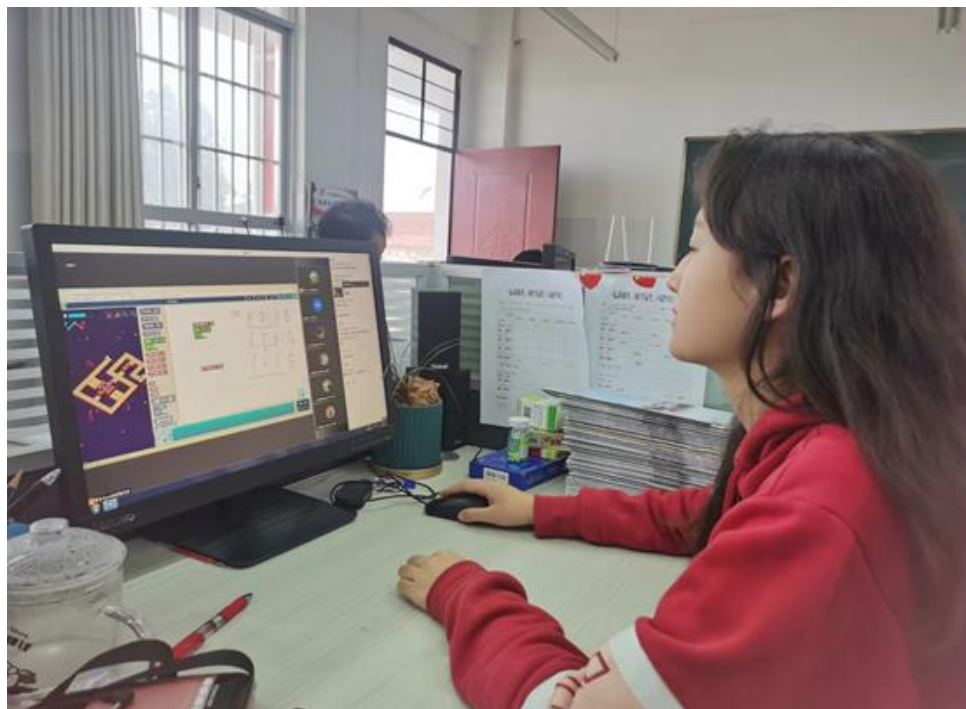
图：项目学校老师参加项目培训。

4月-5月，项目为云南省广南县、河南省洛宁县、贵州省石阡县共计89所学校的91名老师开展了专业的积木基础课程培训和在线考核，提高了乡村教师的数字化能力。