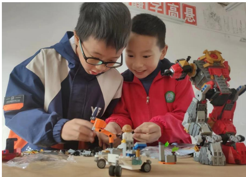
图：孩子们开心地拼搭乐高积木。