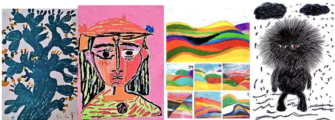
▲ 共美未来项目区小朋友画作