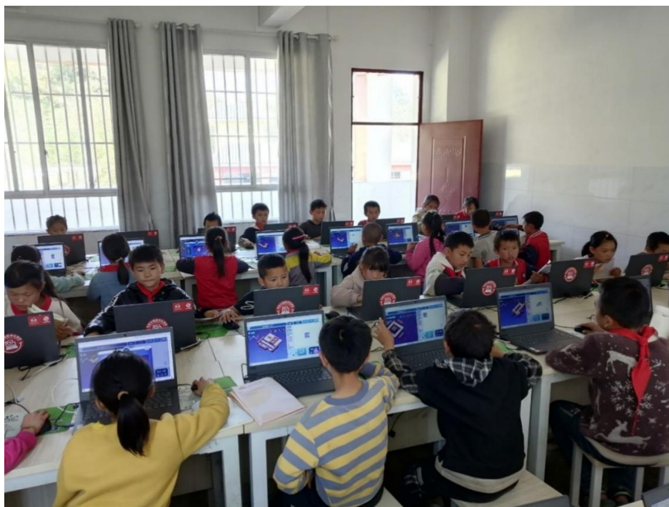
图：项目县学生在进行编程内容学习