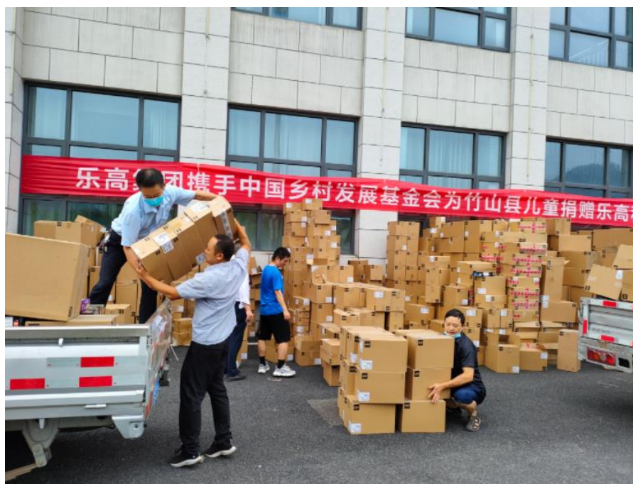
图：项目县组织人员搬运乐高玩具套装。

2022 年，通过县里报名、提交资料，项目部审核，确定了拟受益县 21 个县、1076 所学校。项目部根据捐赠数量、各校学生人数，进行分配，并运送到学校。