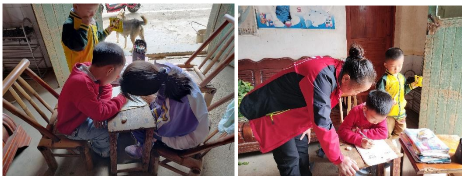
童伴妈妈入户走访,为上网课的孩子辅导功课

2022 年,受疫情的持续影响,童伴妈妈积极参与村内的防疫站岗工作,并随村委、村医调查走访,入户排查,向村民宣传防疫知识,了解儿童的各方面的需求情况。对于留守儿童和困境儿童及家庭,童伴妈妈们给予更多的关注,定期的走访和关爱为孩子们带去温暖。