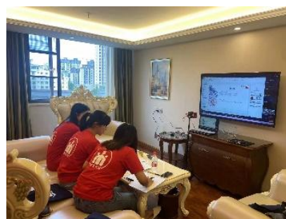
童伴妈妈项目（赣贵皖）骨干中级培训采取“线上授课、线下集中”方式开展