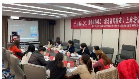
童伴妈妈项目川豫鄂上岗培训线上开展