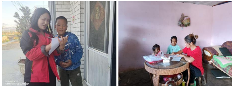
左图：湖北房县化龙村童伴妈妈入户走访，宣传防疫知识，了解儿童生活需求

2022 年度，童伴妈妈共解决项目区儿童福利信息 11.3 万余例，包括协助申请农村合作医疗、协助办理低保、协助辍学儿童返校、协助户籍登记等。