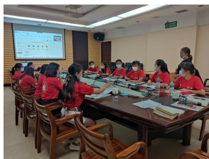
童伴妈妈项目赣皖 TOT 中级培训顺利开展