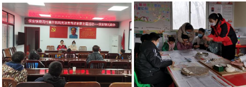
左图：湖北大冶市塘湾村童伴之家开展“宪法宣传进家庭”主题活动

2022 年度，项目区开童伴之家共组织活动 11.89 万余次，有 75.53 万余人次的儿童，13.48 万余人次的家长参加童伴之家的日常活动和 “宪法宣传进家庭”、“冬至包饺子”、“感恩节”等主题活动。孩子们在活动中学习传统文化知识，培养孩子们对传统文化的兴趣。