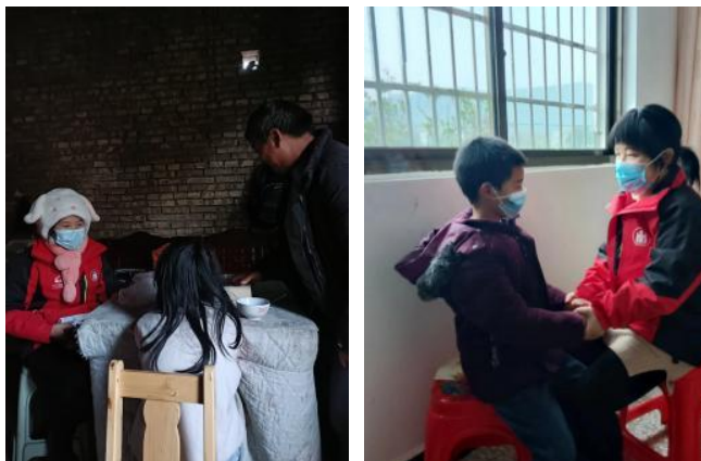
左图：贵州普安县棉花村童伴妈妈疫情期间入户走访，了解儿童心理和生活情况