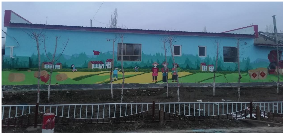
尼勒克县墙体彩绘