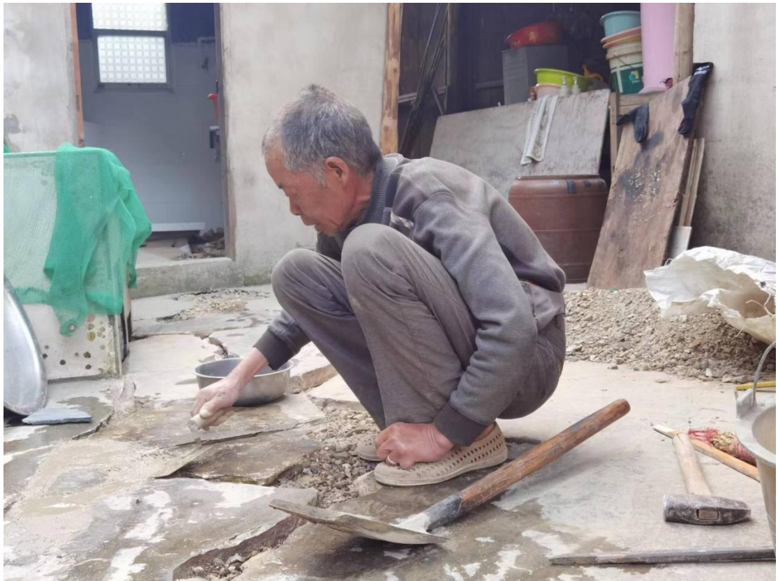
雷山县厕所革命农户投工投劳