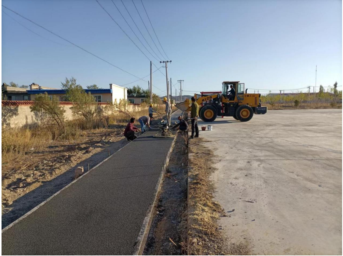
吉木乃县施工建设